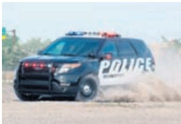
Lögreglan í Bandaríkjunum fær öflugri bíla.

Bílyklar geta skemmt við hátt fall. Þá geta þungar kippur skemmt sviss bílsins.