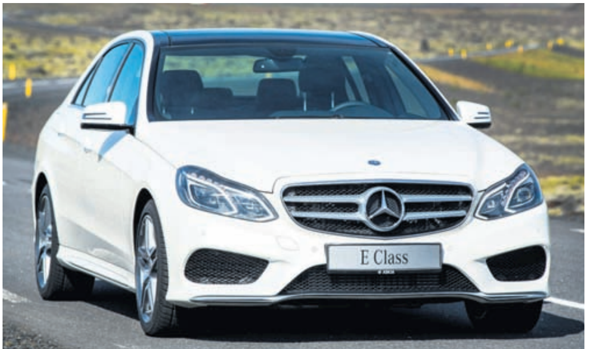
2.000 íhlutum í bílnum hefur verið breytt á milli árgerða.