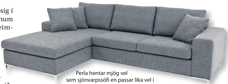
Perla hentar mjög vel sem sjónvarpssófi en passar líka vel í setustofuna.

Hreiður er dýpsti sófi G.Á. húsgagna. Hann tekur vel á móti þeim sem í hann sest með mjúkri setu og baki. Fæstir vilja standa upp úr þessum sófa.