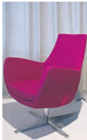
Án bólstrunar sæti fólk á grindum og gormum. Bólstrun er gríðarlega mikilvægur hlekkur í nútímabægingdum.

Starfsmenn G.Á. húsgagna fylgjast vel með ríkjandi tísku-straumum í húsgagnahönnun. Sem stendur má greina umtalsverða fortíðarhyggju í hönnuninni og minnir form og efnisval um margt á tísku sjöunda áratugarins.