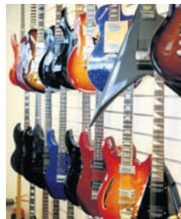
Rafmagnsgítarar af öllum gerðum.