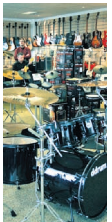
Úrvalið í Rín hefur aldrei verið ríkulegra af heillandi og vönduðum hljóðfærum.

Rín hljóðfæraverslun er í Brautarholti 2 í Reykjavík. Sjá nánar á www.rin.is og www.facebook.com/rinehf .