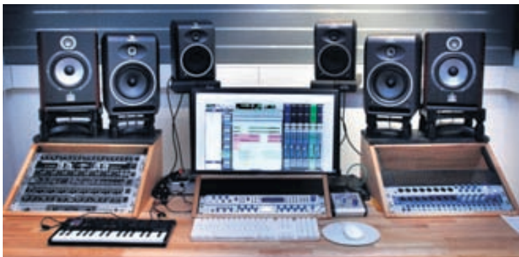
Fullbúið stúdíó er í versluninni þar sem viðskiptavinir geta prófað hátalara og hugbúnað.