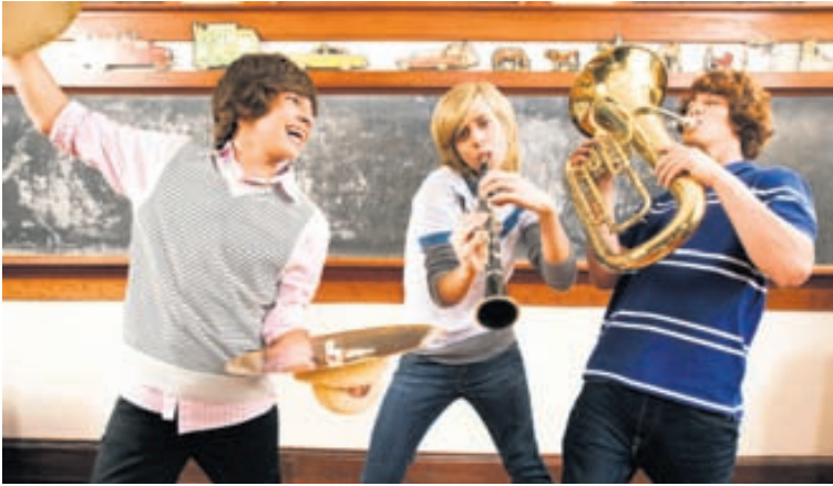
Það er gaman að kunna á hljóðfæri og geta brugðið á leik við ólík tækifæri lífsins.