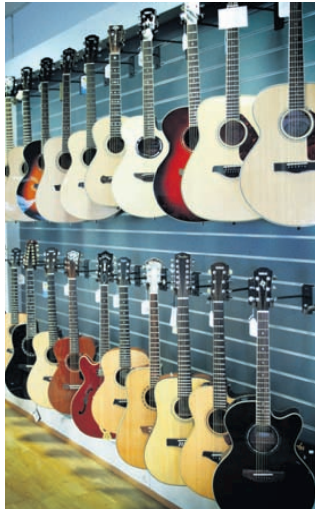
Sindri segir styrk Hljóðfærahússins liggja í breiðu vöruúrvali og traustum vörumerkjum.