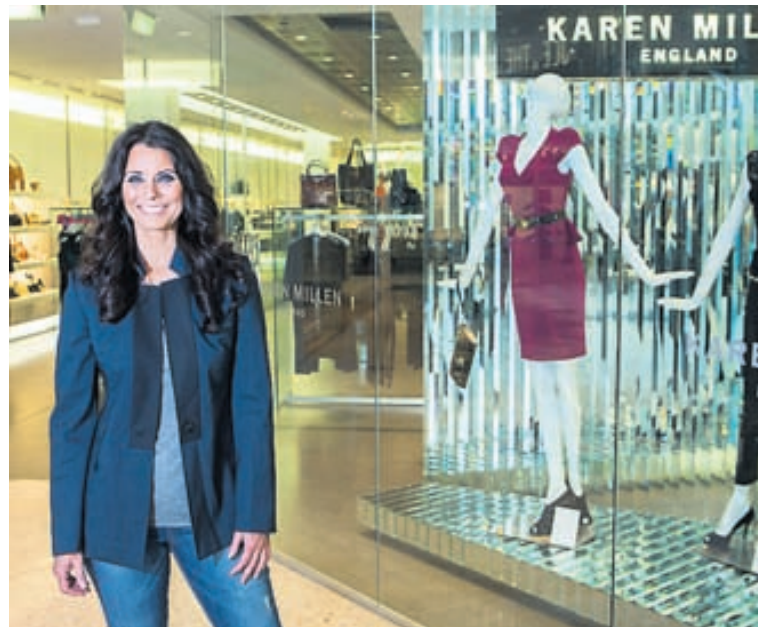
Hulda segir Karen Millen leggja gríðarlega mikla áherslu á gæði og í ljósi þess koma verðin á óvart.