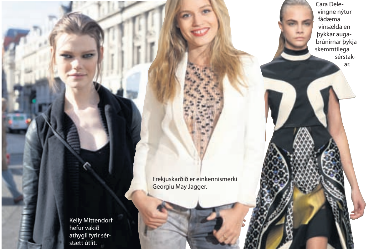
Cara Delevingne nýtur fádæma vinsældar en þykkar augabrúnirnar þykja skemmtilega sérstakar.