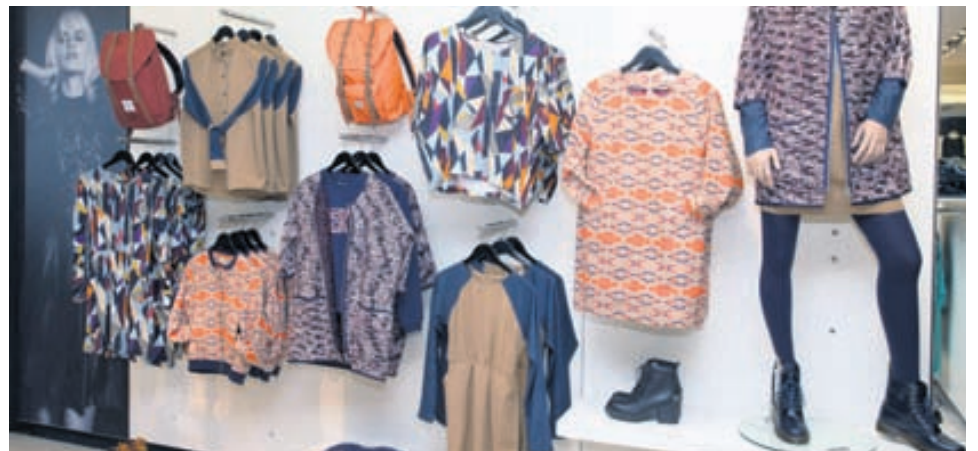
Björt og falleg sumarlína.