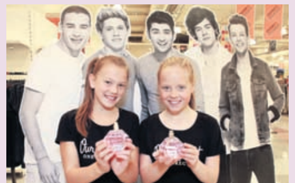
One Direction nýtur fádæma vinsælda meðal stúlkna hér á landi. Ilminn Our moment hönnuðu strákarnir í sveitinni í samvinnu við ilmvatnsfyrirtæki.

Þess má geta að auglýsingin um Our moment var skoðuð yfir tvö milljón skipti á tveimur sólarhringum þegar hún var birt á Youtube og Twitter.