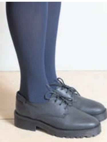
Úrvalið í GS skóm er mikið og fjölbreytt. Svartir og brúnir leðurskór eru vinsælir fyrir haustið og veturinn.