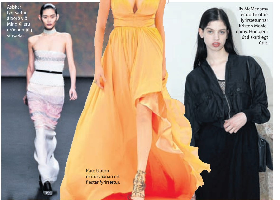
Asískar fyrirsætur á borð við Ming Xi eru orðnar mjög vinsælar.

Hugmyndin um óhefðbundnar fyrirsætur er reyndar ekki ný af nálinni. Á núnda áratugnum voru hönnuðir á borð við Giles Deacon og Jean-Paul Gaultier þekktir fyrir að kippa inn stúlkum af götunni sem þóttu óvenjulegar útlits. En hugmyndin er hins vegar að verða mun almennari og fær æ meira vægi í tiskuheiminum.