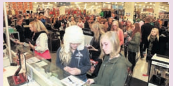
Mikill fjöldi mætti á kynninguna á Our moment í Hagkaup í Smáralind síðastliðinn föstudag.