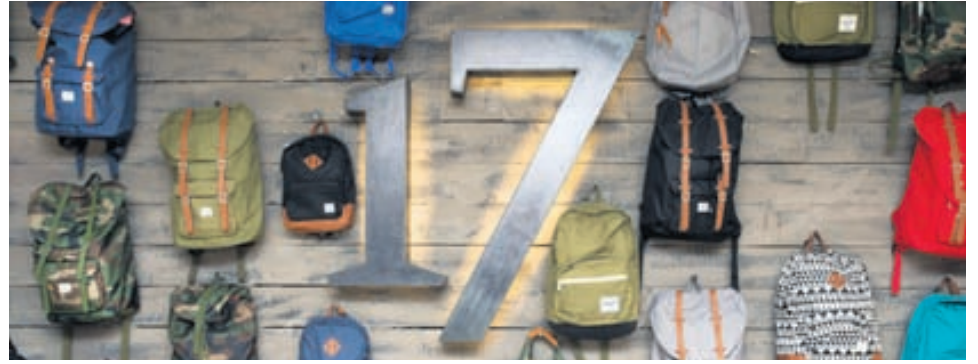
Herschel-töskurnar hafa slegið í gegn, sérstaklega hjá skólafólki.