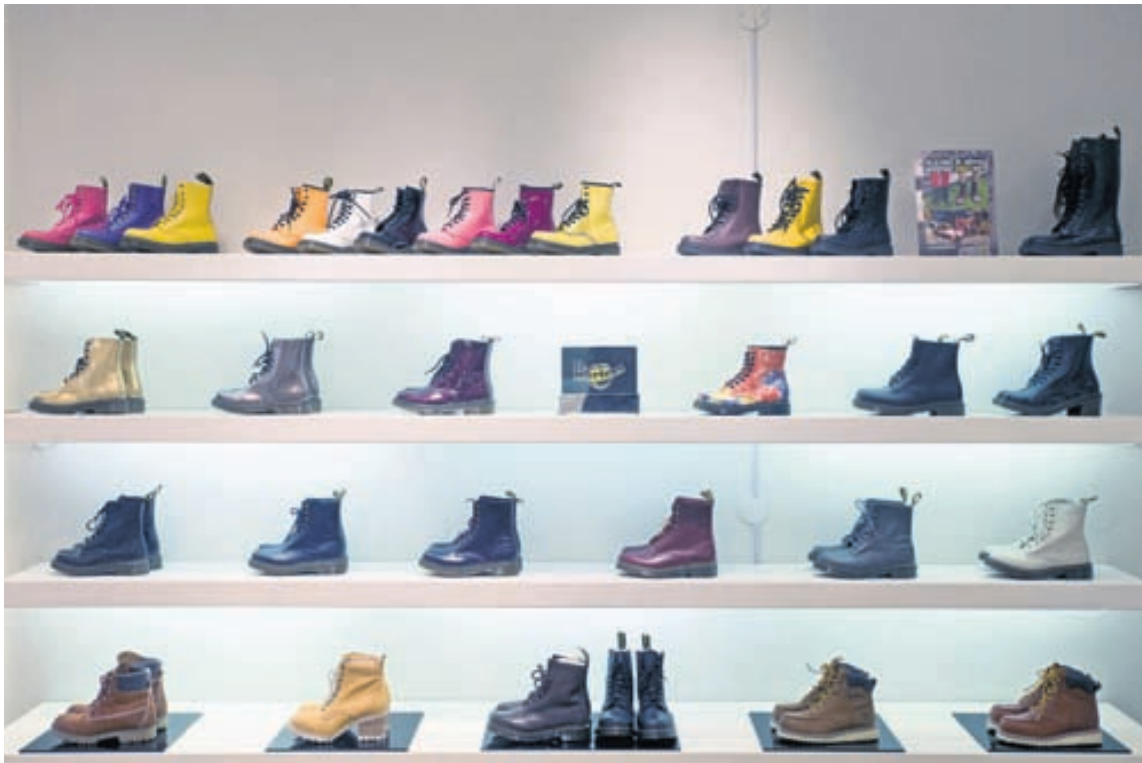
Skór haustsins í GS skóm eru flestir með grófum botni. Hér má sjá úrval af skóm frá merkinu Dr. Martens.