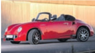
Cévennes er stæling á Porsche 356.