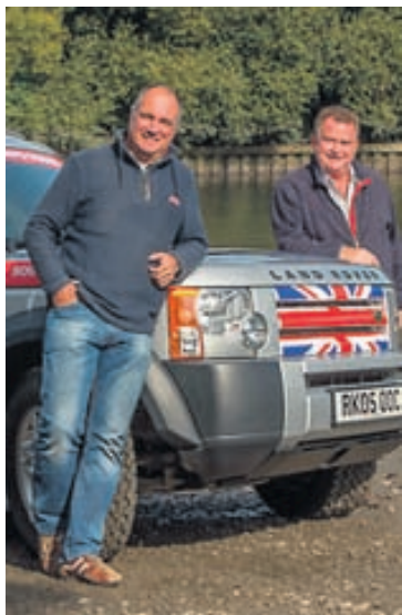
Land Rover Discovery ætlar í langferð.

Þeir hjá franska fyrirtækinu PGO eru greinilega miklir aðdáendur Porsche og hafa mætur á hinum hálfar aldar gamla Porsche 356 Speedster. Svo miklar reyndar að þeir hafa framleitt eftirmynd hans sem þeir nú bjóða til sölu undir nafninu Chevennes. Ekki er þó hægt að segja að um algera eftirmynd sé að ræða þótt hann sé líkur 356-bílnum en hann ber svip hans þó þokkalega. Chevennes er með 1,6 lítra vél frá BMW sem skilar 181 hestafli. Það hljómar ekki svo mikið en rétt er að hafa í huga að hann vegur ekki nema 999 kíló og er líklega nokkuð sprækur. Hámarks hraðinn er 225 km/klst. Bíllinn er afturhjóladrífinn að sjálfsögðu, eins og rökrétt er með sportbíl. Sala á bílnum er hafin í Evrópu en engum sögum fer af vinsældum hans.