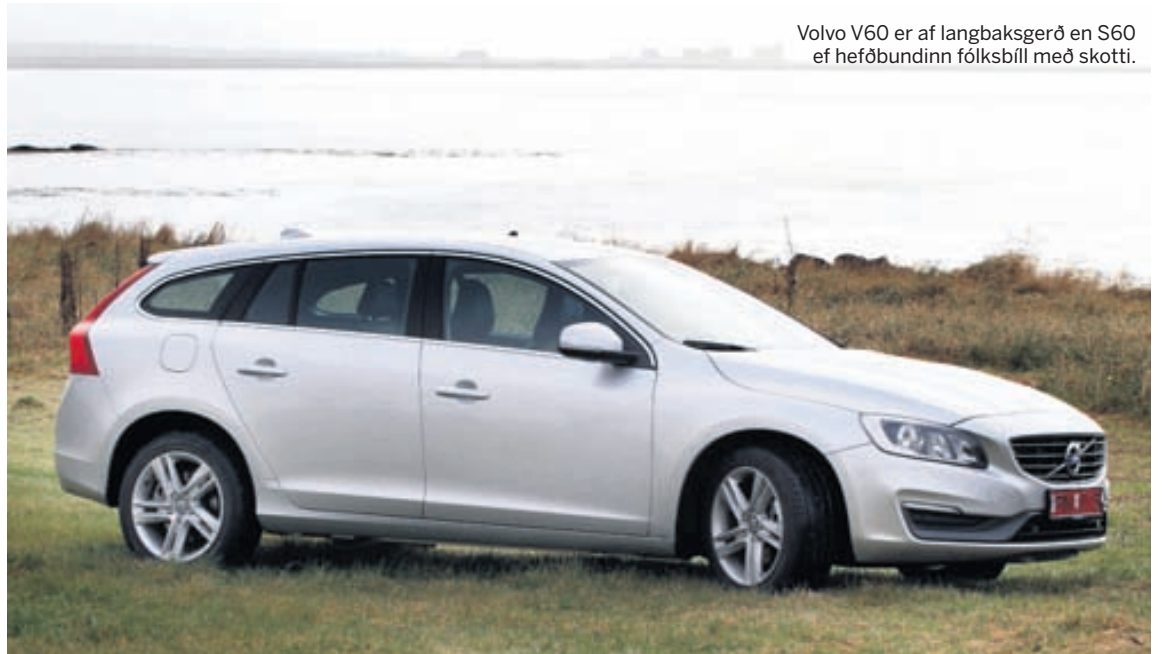
Volvo V60 er af langbaksgerð en S60 ef hefðbundinn fólksbíl með skotti.

Mengun 110 g/km CO2 Hröðun 11,3 sek. Hámarkshraði 190 km/klst Verð 6.190.000 kr. Umboð Brimborg