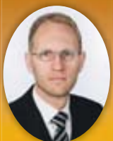
Frímánn Andrésson útfararþjónusta