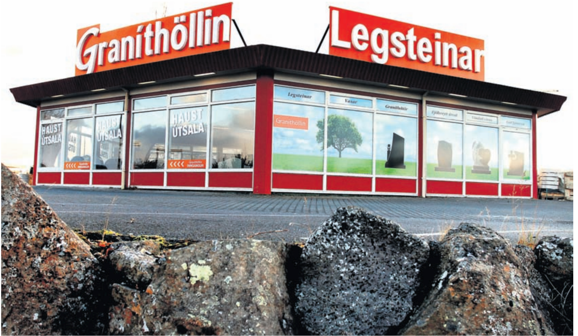
Markmið Graníthallarinnar, í Bæjarhrauni 26, er að bjóða fallega og vandaða legsteina og fyrsta flokks þjónustu.