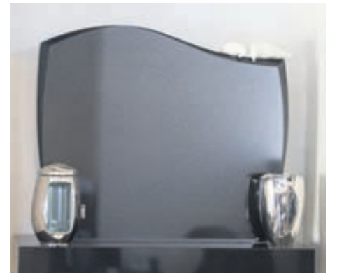
Svartur granítsteinn með lukt og vasa úr platinummálm.