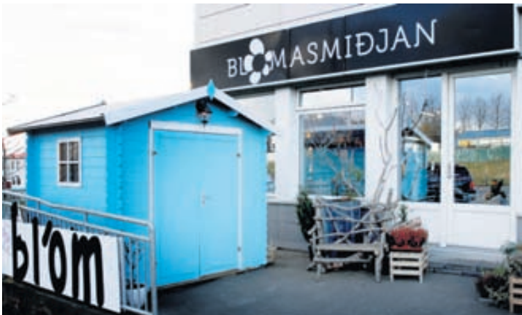
Blómasmiðjan er til húsa í verslunarmiðstöðinni Grímsbæ, Efstalandi 26.