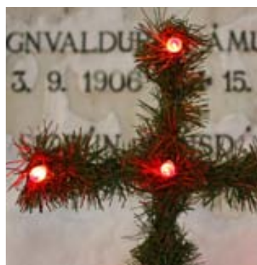
Jólaskreytingar setja hátíðlegan blæ á kirkjugarðana en mikilvægt er að hafa þær vistvænar þar sem förgun á óendurvinnanlegum jólaskreytingum er afar kostnaðarsöm.