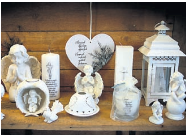
Úrval samúðargjafa er að finna í Blómasmiðjunni.

Síminn er 5881230 og netfang: blomasmidjan@blomasmidjan.is.