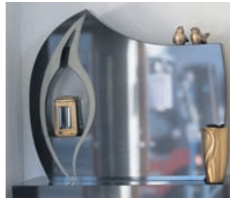
Svartur granítsteinn með vasa og innbyggða lukt úr brönsi.