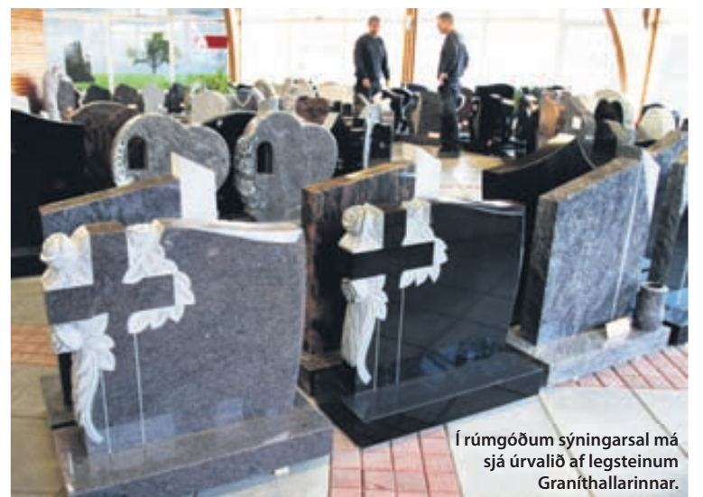
Í rúmgóðum sýningarsal má sjá úrvalið af legsteinum Graníthallarinnar.