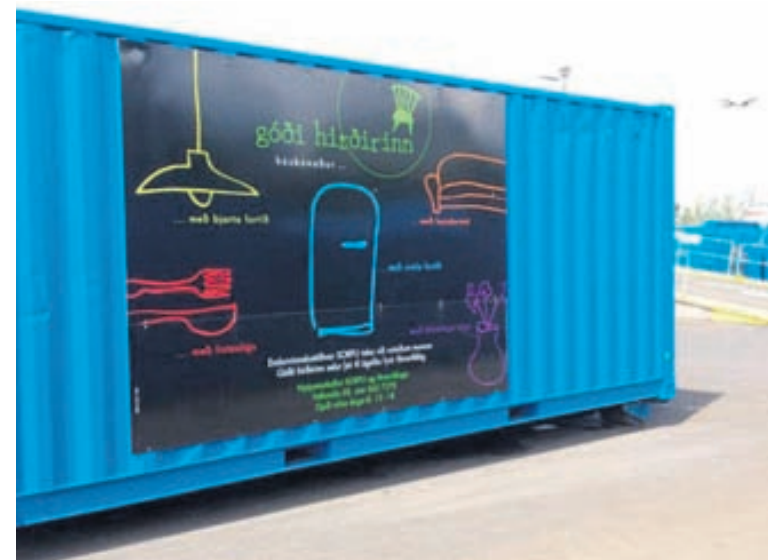
Allur ágóði af sölu Góða hirðisins rennur til góðgerðarmála og líknarfélaga og hafa safnast rúmar 158 milljónir frá upphafi.

Góði hirðirinn er markaður sem gaman er að koma í og kaupa sér hluti sem oftast en ekki finnast ekki annars staðar. Segja má að gullgrafarinn í okkur öllum fái útrás í Góða hirðinum en margan fjár-