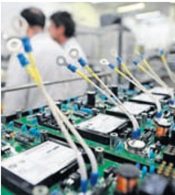
Hætt er við íhlutaskorti í rafkerfi bíla.

Forstjóri Tesla, uppfinningamaðurinn Elon Musk, var staddur í Þýskalandi í síðustu viku og tjáði sig þar mjög opinskátt um framtíð bílaiðnaðarins og hversu stórt hlutverk rafmagnsbílar myndu leika í framtíðinni og hversu brýnt það væri að hægja á brennslu á jarðefnaeldsneyti á jörðinni. Musk fór einnig yfir aðra tækni sem gerðar hafa verið tilraunir með til að leysa jarðefnaeldsneytið af hólmi, svo sem vetni. Musk sagði að notkun vetnis í bíla væri best lýst með einu orði, þ.e. vitleysa! Hann sagði að eina markmið bílaframleiðenda með að þróa vetnisbíla væri í markaðstilgangi og ímyndarsköpun. Þessi tækni væri alltof dýr og hættuleg. Vetni væri afar hættulegt gas. Það væri heppilegt til notkunar í stórar eldflaugar en alls ekki í bíla. Þar sem Musk var í Þýskalandi sagði hann frá sérstökum hraðbrautarpakka sem Tesla mun bjóða þýskum kaupendum bílsins. Með honum verður bíllinn hæfari til aksturs á þýskum hraðbrautum, með meira afl og fjöðrun sem ræður við meiri hraða. Hann greindi einnig frá þéttingu nets hleðslustöðva í Þýskalandi og að í lok næsta árs yrði enginn þjófverji lengra frá hleðslustöð en sem næmi 200 km og að 80% þeirra yrðu innan við 100 km frá næstu hleðslustöð.