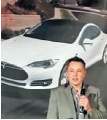
Elon Musk tjáir sig um vetnisbíla.