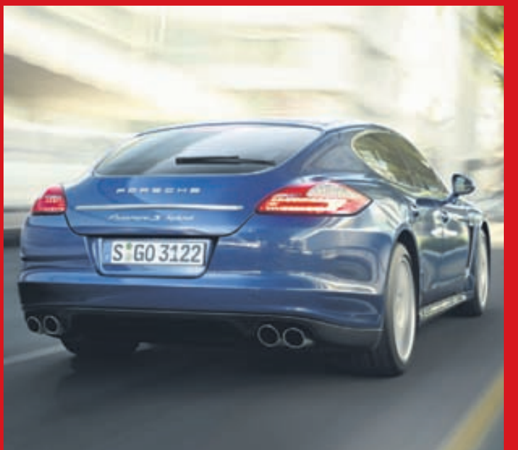
Porsche Panamera Hybrid er með hreint ótrúlega lága eyðslu.

Innréttingin er tiltölulega látlaus og án takkaflóðs, en stjórnþæki eru einföld og skiljanleg