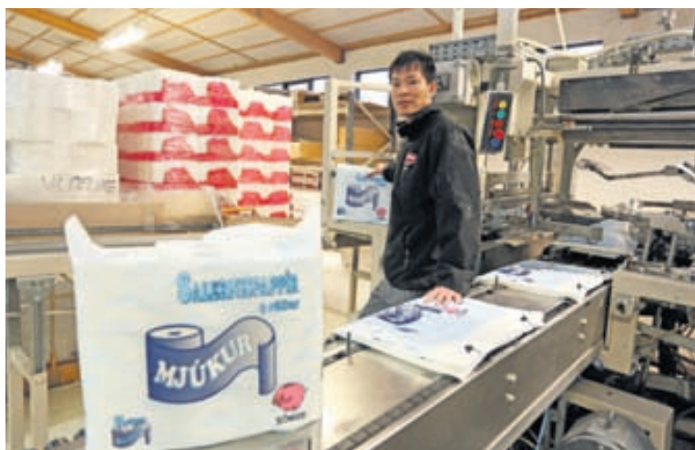
Fjölmargar framleiðsluvörur Papco eru með umhverfisvottun.