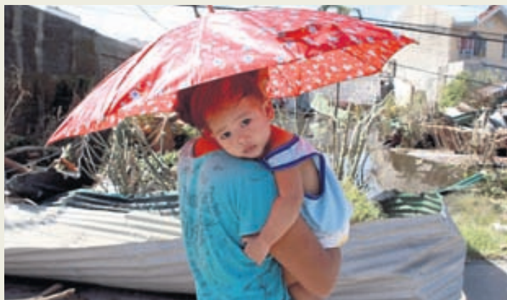
Mikil neyð ríkir meðal barna á Filippseyjum í dag.