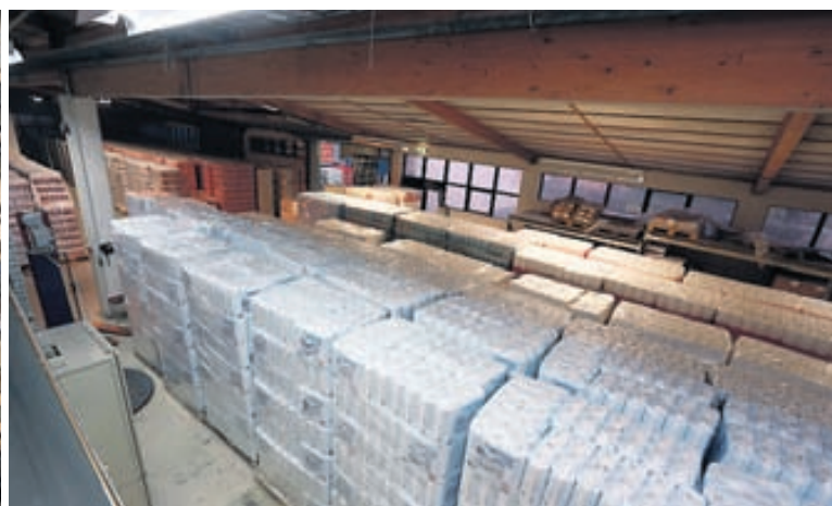
„Á undanförunum árum höfum við bætt við framleiðsluna, meðal annars hágæðapappír sem seldur er í fjáröflunum.“