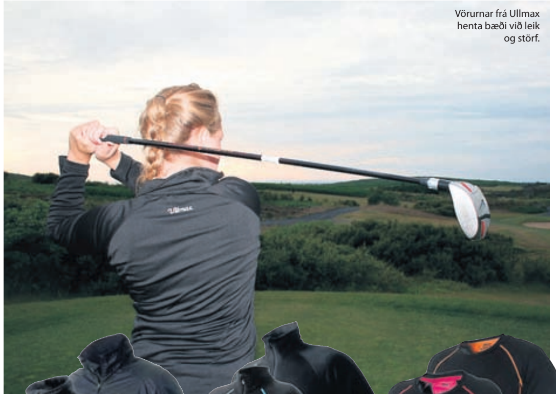
Vörurnar frá Ullmax henta bæði við leik og störf.

Nánari upplýsingar er að finna á www.ullmax.is og á Facebook. Áhugasamir geta haft samband á info@ullmax.is .