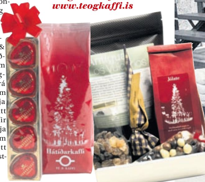
Ljúfur Hátíðarkaffi og Niederegger-marsipanhjörtu. Verð 2.399 kr.