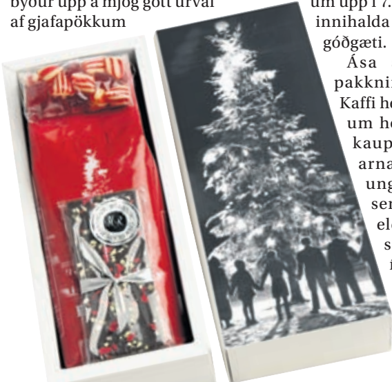
Stúfur Hátíðarkaffi, dökkt súkkulaði frá Hafliða og handgerður brjóstsykur. Verð 2.699 kr.

Nánari upplýsingar má nálgast á vefsíðunni www.teogkaffi.is