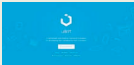
Litasamsetning verður einfaldari.