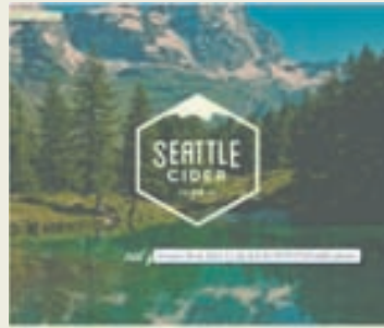
Unnar myndir koma sterkt inn.

Unnar myndir. Vinsælt verður að vinna myndir með ýmsum hætti á vefsíðum á árinu. Nota óskýrar myndir, breyta þeim með myndvinnslutækni og jafnvel nota myndir sem minna á Instagram-myndir.