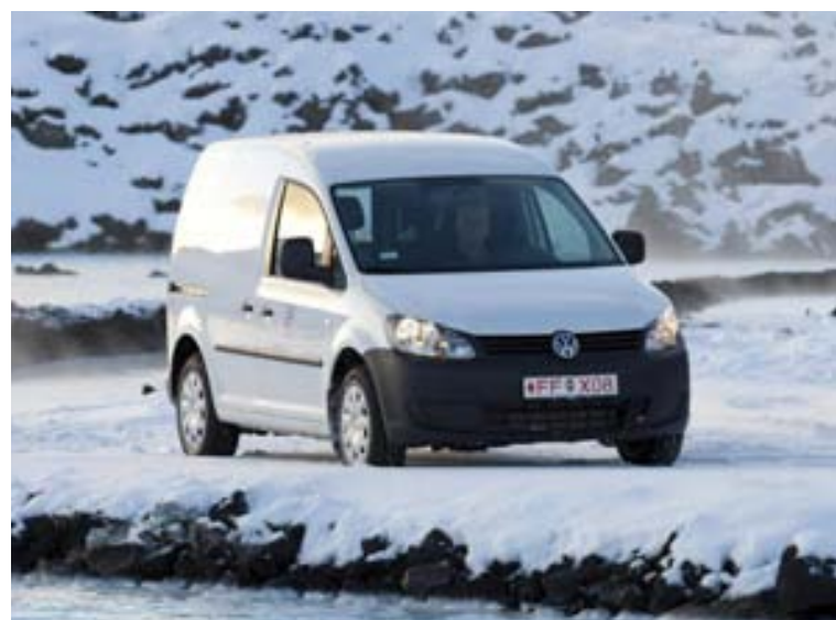
Vinsældir Volkswagen Caddy í sjö manna fólksbílaútfærslu aukast stöðugt.

voru Dacia Logan, Fiat Dobló og þeirra allra neðstur var Chrysler PT Cruiser. Í flokki átta og níu ára bíla trónir Porsche 911 efstur, en næstir honum koma Toyota Corolla Verso og Toyota RAV 4. Ekki slæmur dómur á Toyota-bíla þar, en Toyota Avensis náði einnig fimmta sætinu í þessum aldursflokki bíla. Neðstir í flokknum voru Chrysler PT Cruiser, Fiat Dobló og allra neðstur Mercedes Benz M-Klasse. Í elsta flokknum sem kannaður var, flokki tíu til ellöfu ára bíla, er Porsche 911 aftur efstur á blaði, en aftur á Toyota næstu tvo, þ.e. Toyota RAV 4 og Toyota Corolla. Neðstir í þessum flokki voru svo bílarnir Fiat Stilo, Ford Galaxy og allra neðstur Chrysler PT Cruiser.