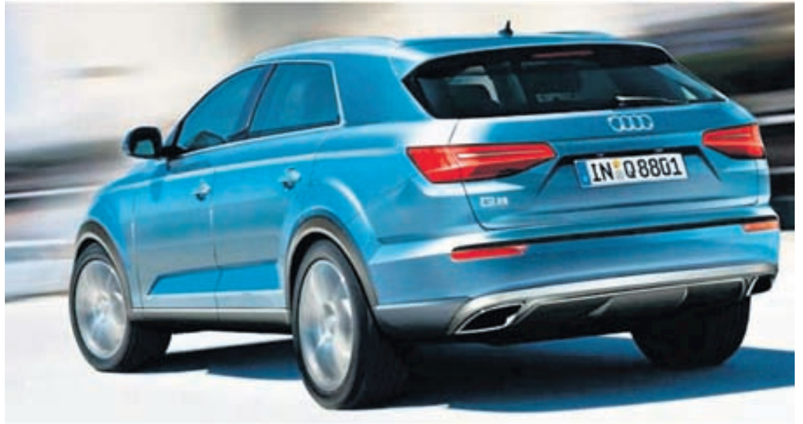
Ekki er víst að þetta sé endanleg útgáfa Q8, enda hugmyndabíll.