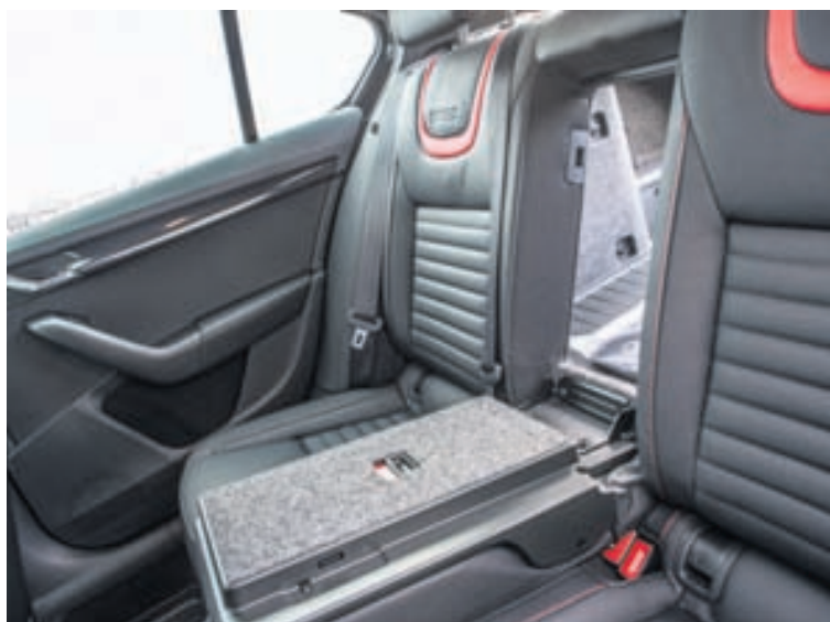
Rauðstagað svart leður ræður ríkjum inni í bílnum. Aftur í er rýmið stórbrotið.