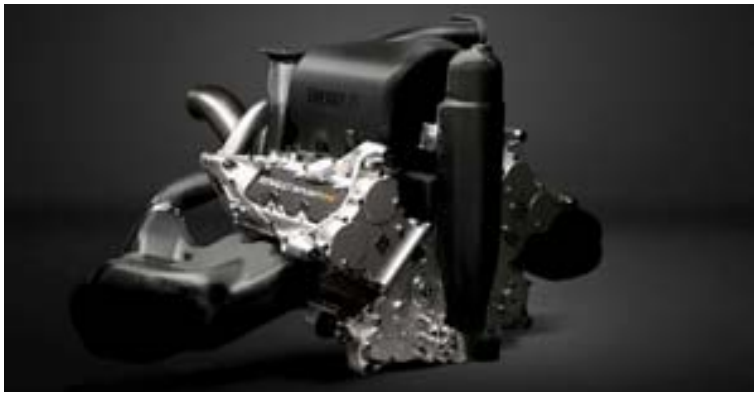
Hún er nett en afar öflug, Formúlu 1-vélin, frá Renault sem verður í þriðjungi kappakstursbíla ársins.