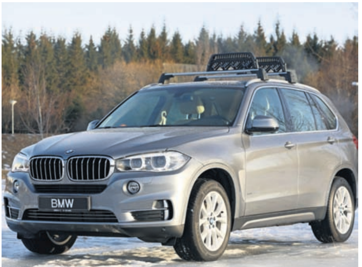
Bíllinn sem tekinn var til kostanna er með 3,0 lítra dísilvél og sannarlega góður akstursbíl.

Mengun 162 g/km CO2 Hröðun 6,9 sek. Hámarkshraði 230 km/klst. Verð 12.090.000 kr. Umboð BL