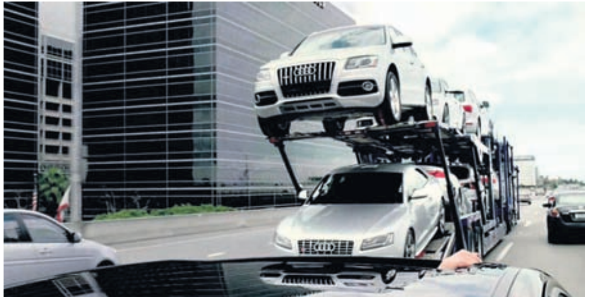
Nokkrir þessa ættu að komast í hendur nýrra eigenda í ár.

ínvél sem orkar 550 hestöflum og verður hún í S-kraftaútgáfu Q8-bílsins. Audi ætlar einnig að framleiða Audi TT e-Tron-bíl, en hann verður tvinnbíll með 2,0 lítra bensínvél og tveimur rafmótorum, en samtals skila þessar aflrásir 402 hestöflum. Sá bíll mun komast fyrstu 50 kílómetrana á rafmagninu einu saman og því mun hann ekkert menga í bæjarakstri, en hefur bæði krafta í köggjum og kemst hvert á land sem er.