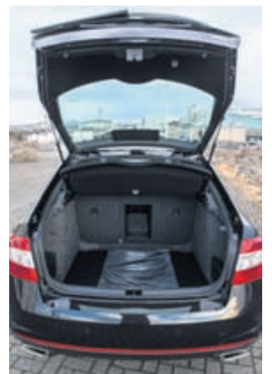
Farangursrýmið er einstaklega rúm- gott í bílnum.

í sama flokk, en eru ekki í boði sem stendur. Verð Octavia vRS er sínu lægra en á Golf GTI og því ætti smekkur og þörf fyrir pláss að ráða hvor þeirra höfðar betur til hvers og eins.