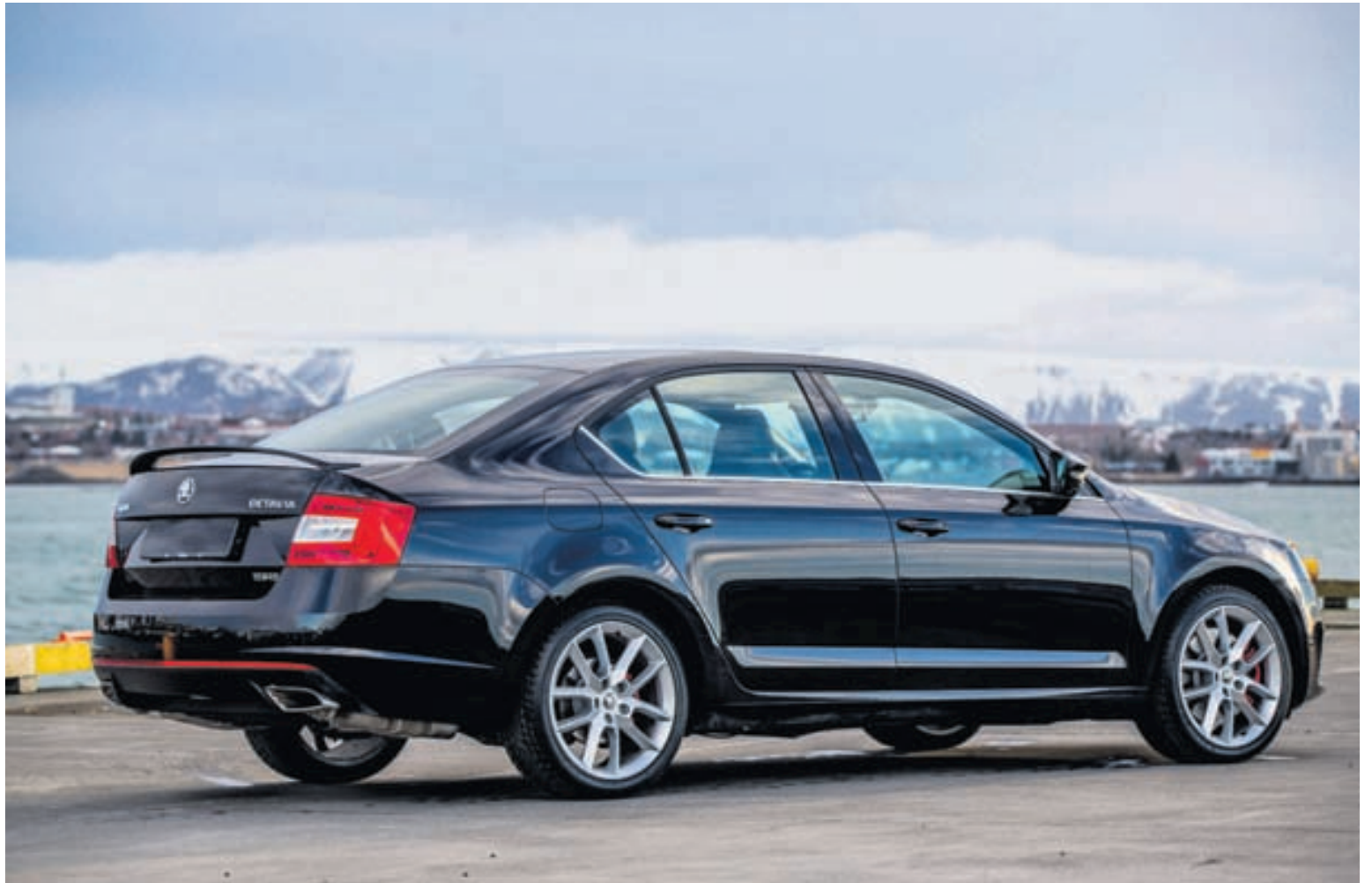
Skoda Octavia vRS er kraftaútgáfa af þessari söluhæstu bílgerð landsins og þykir sameina sportlega eiginleika, notagildi og gott verð. Bíllinn fæst bæði með bensín- og dísilvél.

Reynd var bensínútgáfa Octavia vRS og var það hinn skemmtileg- asta upplifun. Fyrir það fyrsta vakti bíllinn alls staðar mikla að- dáun og flestra augu beindust að honum á ljósum, eða í raun hvert sem hann fór. Þó sá það fólk ekki inn í bíllinn, en hann er hinn glæsilegasti er inn er komið. Rauðstagað svart leður ræður þar ríkjum, fall og sport- leg framsæti sem halda þó ekki nema miðlungsvel um ökumann og stílhreint mælaborð sem ekki er ofhlaðið en þar finnst þó hæg- lega allt það sem skiptir máli. Rými fyrir aftursætisfarþega er eiginlega stórbrotið eins og eig- endur hins nýja Octavia geta vitnað um. Bæði höfuðrými og þó sérstaklega fótarárými er eins og í stórum lúxusbílum. Ekki þarf svo að tíunda mikið hið stóra farangursrými sem í bíln- um er, 609 lítrar og skýtur þessi bíll öllum ref fyrir rass í þeim