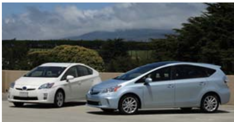
Bílar frá Toyota standa vel í samanburði við aðra þegar kemur að endursölu.

Í flokki bíla sem eru tveggja til þriggja ára stóð Opel Meriva efstur á palli, en í öðru sæti var Mazda2 og Toyota iQ í því þriðja. Þessi árangur Opel Meriva-bílsins er athyglisverður í ljósi þess að enginn annar bíll frá Opel náði á topp 10 listann í öllum 5 aldursflokkunum. Neðstu þrír bílarnir