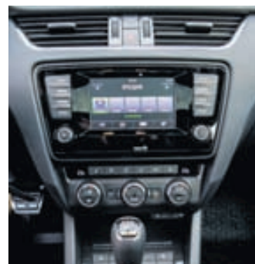
Bíllinn er allur hin glæsilegasti að innan.

grip og hallast afar lítið þó lagt sé mikið á. Ekki fékkst þó það al- besta úr bílnum þar sem hann var á grófum og frekar hörðum vetr- ardekkjum sem fyrir vikið heyrð- ist mikið í. Víst er að bíllinn væri ennþá skemmtilegri á mýkri sum- ardekkjum. Næmi í stýri er gott og tilfinning fyrir vegi til fyrir- myndar. MJÖG fannst fyrir því að um sportbíl var að ræða hvað það varðar að hann eltir rásirnar í mjög svo grófum götum borgar- innar og rétt að hafa báðar hend- ur á stýri til að missa bíllinn ekki um of í rásunum. Samanburð- ur við aðra bíla er helst í formi Volkswagen Golf GTI en önnur umboð en Hekla hafa að undan- færnu ekki boðið sportútgáfu bíla sinna. Ford Focus ST, Honda Civic Type-S, Renault Clio og Megan RS sem og Subaru Impreza WRX eru sannarlega bílar sem falla