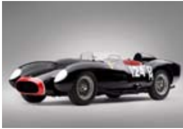
Dýrgripurinn Ferrari 250 Testa Rossa.