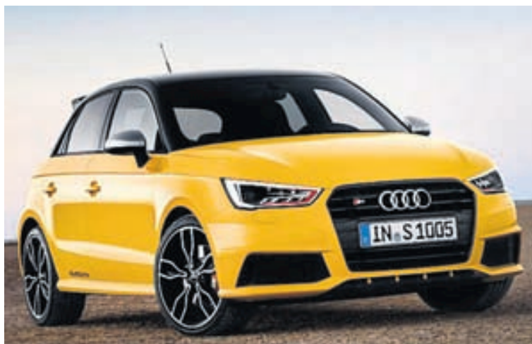
Audi S1 er hinn lögulegasti og fer bílnum ágætlega að vera svona gulur.

þykja 7 gerðir sérstaklega slæmar. Mörgum foreldrum hefur reynst erfitt að leysa festingu beltanna og mikið afl hefur þurft til. Hefur sumum þeirra verið nauðugur einn kostur, þ.e. að klippa belti stólanna í sundur og er slíkt æði tímafrekt og allsendis óvíst að fólk hafi nokkurt verkfæri til þess í neyð. Hafa bifreiðaöryggisstofnun Bandaríkjanna, NHTSA, borist 80 kvartanir yfir þessum stólum.