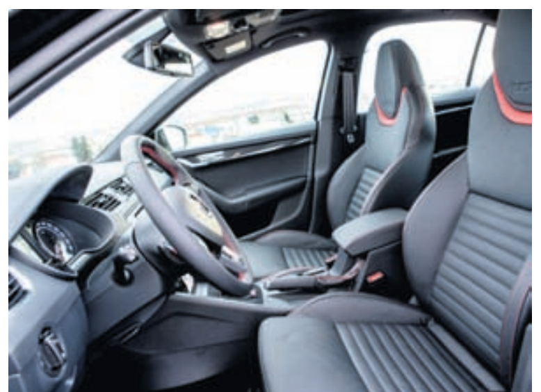
Framsæti heldur ekki nema miðlungsvel um ökumann, en mælaborðið er stílhreint.

efnum. Það er risastórt og frá- bært að búa að slíku í sportbíl, hreinlega leit að öðru eins. Upp- gefin eyðsla í þéttbýli er 8,1 lítri en í frískum reynsluakstri var hann með 9,5 lítra.