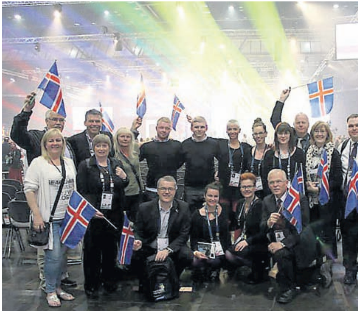
Íslenski hópurinn í Leipzig. Keppendur, dómarmar sem jafnframt eru þjálfarar keppendanna, liðstjórar og kennarar í Hársnyrtiskólanum.