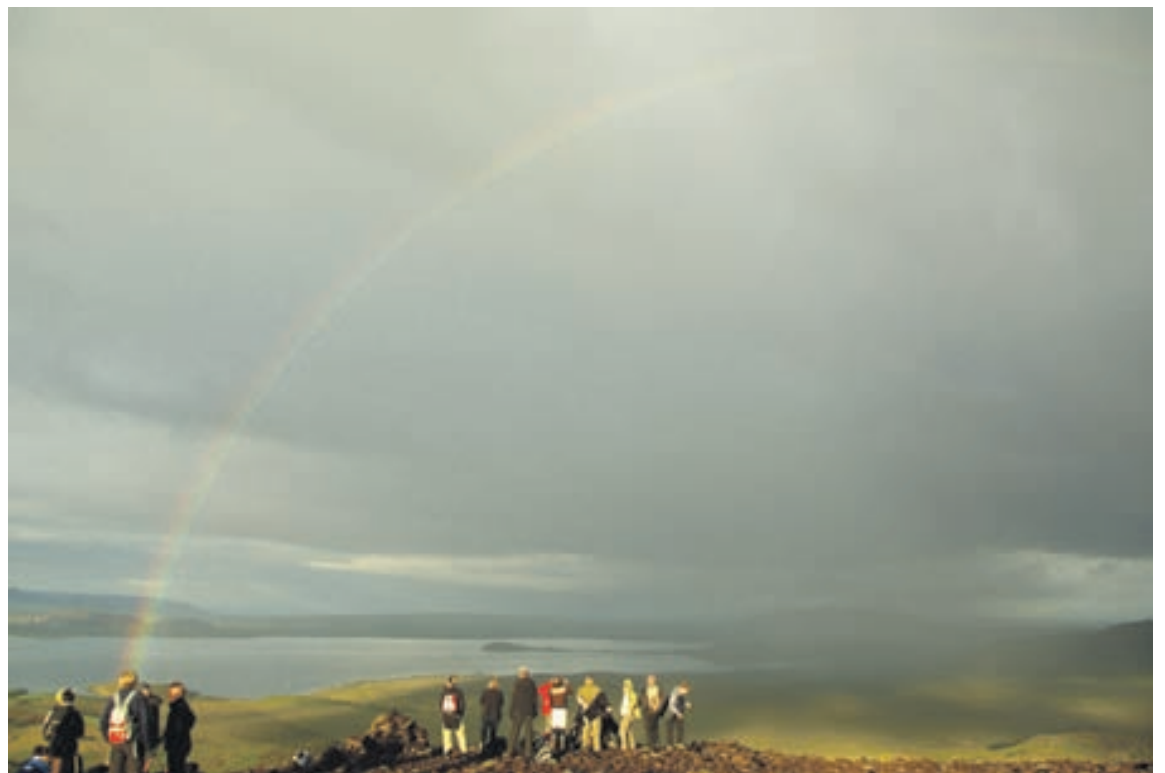
Útivistarræktin fer í styttri göngur frá höfuðborgarsvæðinu reglulega yfir sumartímann. Hér er göngufólkið á Þingvöllum.