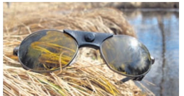
Veidigleraugun frá Gleraugnasölnunni eiga engan sinn líka.

Gildir til 1. sept. 2014. Símar: 414-1533 & 821-1311.