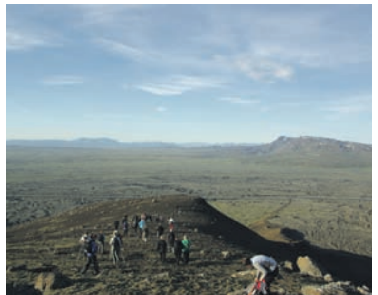
Gaman er að ganga á fjöll í góðu veðri. Hér er hópurinn á Blákollu.

segir flesta geta tekið þátt í göngum Útivistarræktarinnar og að allir séu velkomnir. „Í göngunum er fólk héðan og þaðan, bæði byrjendur og lengra komnir. Göngurnar í Elliðaárdalnum taka um klukkutíma og er þetta sami hringurinn sem er farinn. Á miðvikudögum er yfirleitt keyrt í þrjátíu til 45 mínútur út fyrir bæinn og gengið í einn og hálfan til þrjá klukkutíma. Yfir hásumarið komum við yfirleitt til baka um ellefuleytið. Það er oftast ákveðinn kjarni fólks sem mætir, á bilinu tuttugu til fjörutíu manns en