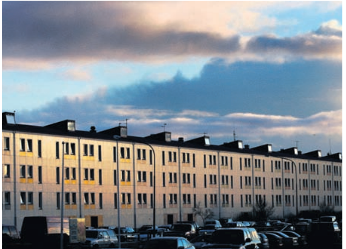
„Af blokkum og ekki“ er yfirskrift ljóðagöngunnar.

Mæting er rétt fyrir klukkan 20 annað kvöld í Gerðuberg en gangan hefst klukkan 20.