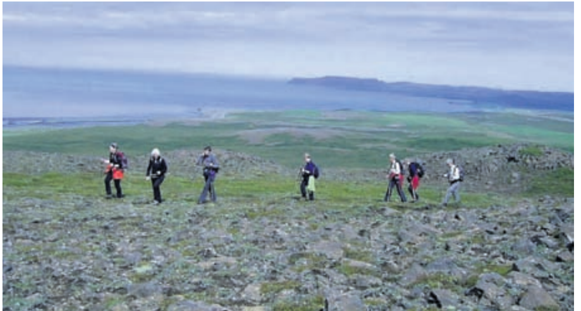
Gengið um Öxarnúp.

Í júlí er boðið upp á fjögurra daga ferð við Öxarfjörðinn. Það er bækiðstöðvarferð frá Kópaskeri þar sem