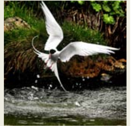
Krían í vorverkunum.

- Laugardagur 24. maí. Dagur farfiskanna. Gengið frá Gerðubergssafni kl. 14.00 þann 24. maí sem er alþjóðlegur dagur farfiska og er haldið upp á hann víða um heim. Gengið verður niður að Elliðaám og gestir fræddir um laxagöngur.