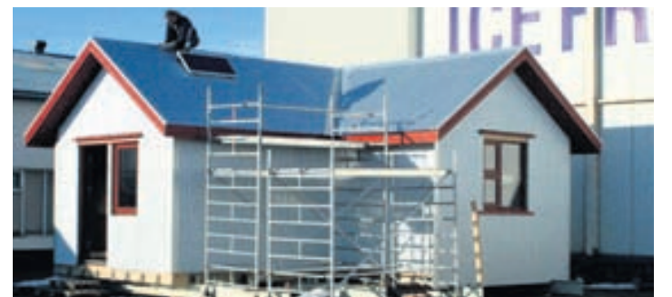
Nýr Lambi verður fluttur í Glerárdal.

Nánari upplýsingar um Motul á Íslandi má finna á heimasíðunni motul.is.