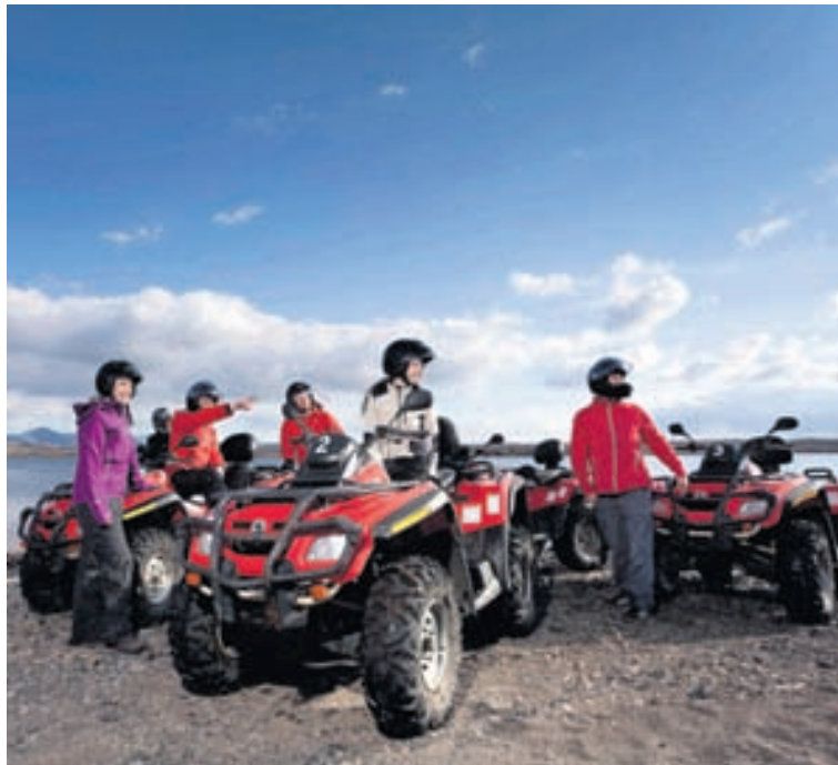
Fjór hjólaferðir eru frábær skemmtun fyrir vini og vinnufélaga.

Fyrirtækið er með 22 fjór hjól á sínum snærum en tveir geta