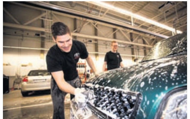
Þjónustudagur Toyota verður haldinn næstkomandi laugardag, 10. maí.

Næstkomandi laugardag, 10. maí, verður árlegur þjónustudagur hjá viðurkenndum sölu- og þjónustuaðilum Toyota víða um land. Þetta er tíunda árið í röð sem Toyotaeigendur geta komið til sölu- eða þjónustuaðila og fengið vorhreingerningu á bílnum. Allir Toyotaeigendur eru velkomnir milli kl. 11 og 15 á laugardag og verður vel tekið á móti þeim af starfsmönnum Toyota og hjálparkokkum sem sápuþvo bílana og þurrka. Þegar bíllinn hefur fengið sitt bíður grill og gos auk þess sem sumarglaðningur fylgir fyrir börn og fullorðna. Sýningarsalir verða opnir hjá söluaðilum þar sem skoða má það nýjasta frá Toyota. Toyotaeigendur geta rennt við á þjónustudeginum hjá Toyota á Akureyri, Selfossi, í Reykjanesbæ og Kaupþúni, hjá Bifreiðaverkstæði