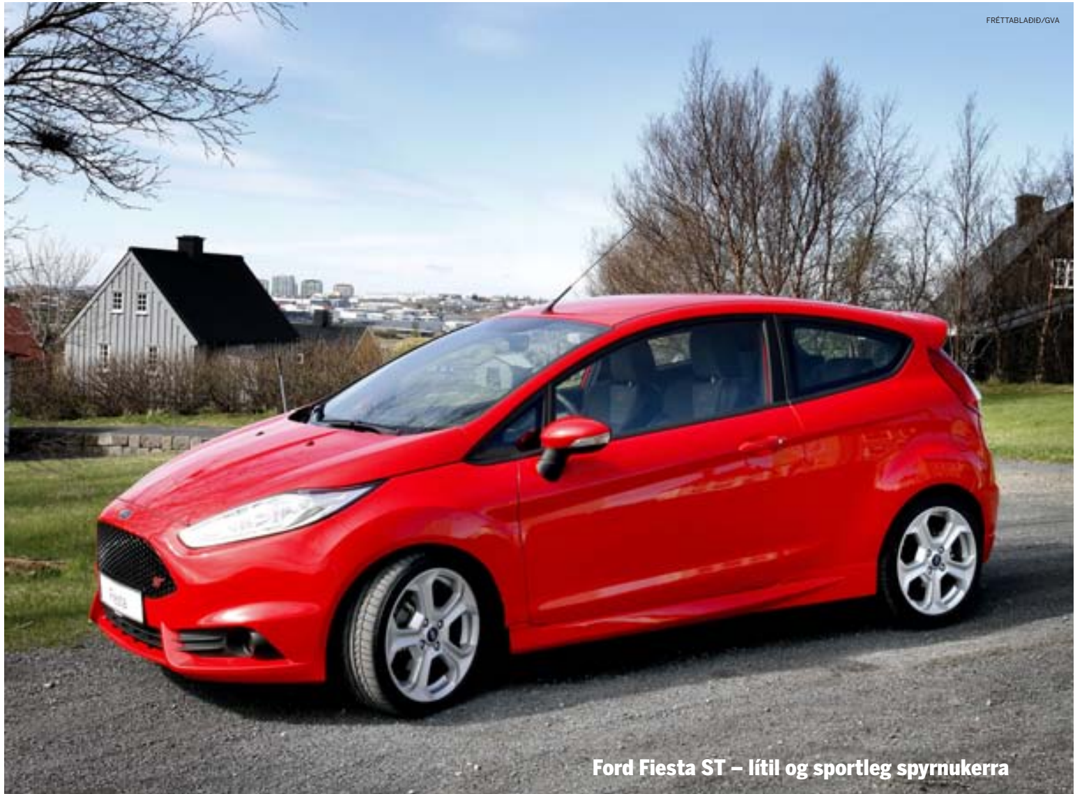
Ford Fiesta ST – lítill og sportleg spymukerra

Það fyrsta sem ökumaður finnur fyrir við akstur Ford Fiesta ST er hversu harður bíllinn er, alveg glerharður. Það á svo sem ekki að koma á óvart þegar um sportara er að ræða en hægt er að fullræða að hann sé harðari við akstur en allir keppinautarnir. Þessi harða fjöðrun hans eykur líka á aksturseiginleika hans og hann ræður ótrúlega vel við beygjurnar fyrir vikið. Hrikalega gaman er að henda honum í þær og veggþipið er undarlega mikið. Fyrir vikið er hann trúrri ætlunarverki sínu að vera hreinræktaður sportbíl sem fórnar nokkuð þægindunum fyrir aksturseiginleikana. Þetta þurfa ökumenn hans bæði að sætta sig við og í leiðinni njóta til fullnustu. Þessi bíll beinlínis hvetur ökumann til að aka rösklega og er það góður eiginleiki. Í leiðinni hvetur hann einnig ökumann til að láta hann snúast hratt í hverjum gir og hann nýtur sín best á háum snúningi. Að því leytnu minnir hann á Toyota GT86/Subaru BRZ. Beinskiptingin í Ford Fiesta ST hefur karakter bílsins vel og skiptihnúðurinn leikur í hendi. Bremsurnar eru einnig góðar, enda diskar bæði að framan og aftan, en Ford Fiesta ST er fyrsti Fiesta-bíllinn sem er