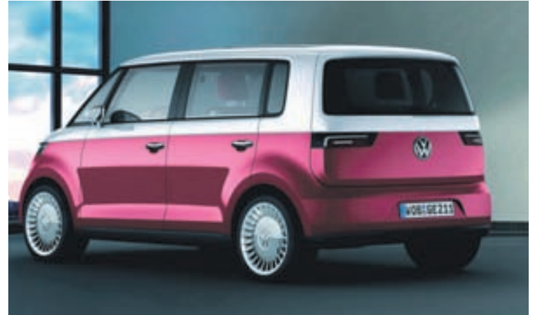
Volkswagen Bulli ber sterkan svip af Rúgbrauðinu gamla.

Næsta skref Volkswagen þar virðist líklega fólgið í endurvakningu á Rúgbrauðinu með bíl sem fengi nafnið Bulli Microbus, en bílaþaðið Autobild greinir frá þessu. Auk þess ætlar Volkswagen að kynna nýja gerð Bjöllunnar með sportlegri og lægri þaklínunni og þá væntanlega með öflugri vélum. Kemur þetta kannski ekki á óvart ef mið er tekið af vinsældum Bjöllunnar, en ást margra á Rúgbrauðinu er líkleg til að tryggja góða sölu á farartæki sem líkist þeim goðsagnakennda bíl.