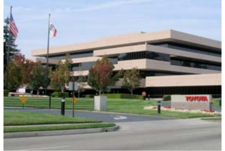
Toyota flytur höfuðstöðvar sínar til Plano í Texas.

Það er orðið mjög dýrt að reka fyrirtæki í Kaliforníu og einnig er mjög dýrt fyrir starfsfólk að lifa þar. Er Kalifornía nú, ásamt New York og New Jersey, eitt þriggja svæða Bandaríkjanna