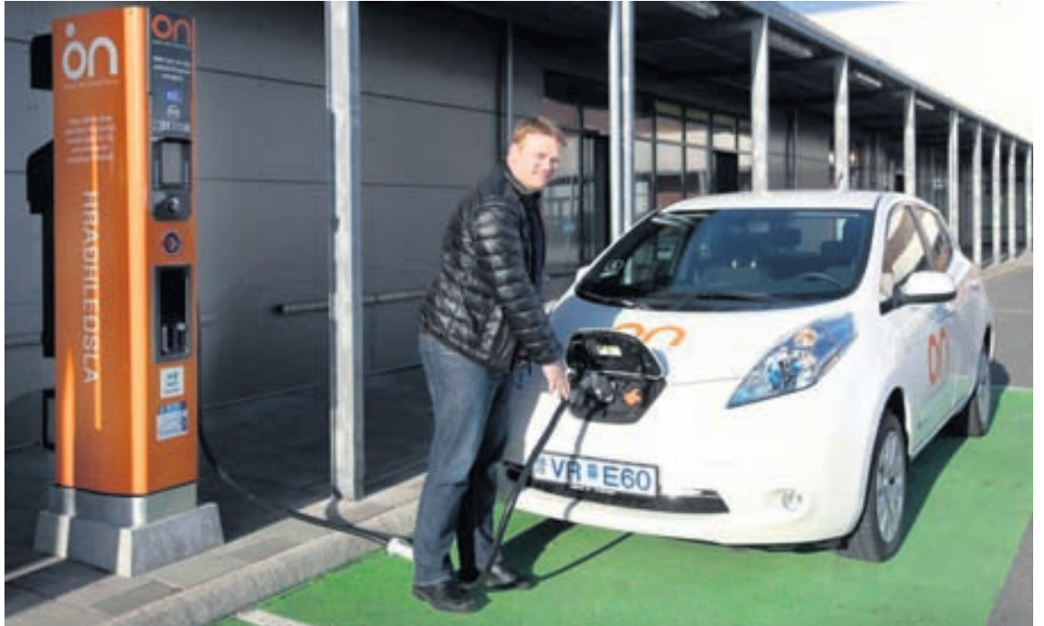
On opnar fjórðu hraðhleðslustöðina en þar er hægt að hlaða rafbíla á stuttum tíma.

Næstu tíu bílarnir á listanum voru Kia Picanto, Audi A1, Opel Adam, Ford Fiesta, Hyundai iX20, Renault Clio, Peugeot 208, Fiat Panda, Skoda Fabia og Hyundai i10. Neðstu bílarnir á listanum að neðan talið voru svo Fiat Punto, Mini Cooper, Alfa Romeo Mito, VW Polo, Fiat 500 og Kia Venga. Ekki var tekið neitt tillit til þess hvað bílarnir kosta. Athygli vekur að enn eina ferðina eru bílar frá Japan og S-Kóreu áberandi efst á listanum og af tíu bestu bílunum eru fimm þeirra frá Japan og einn frá S-Kóreu, en af næstu tíu bílum eiga Hyundai og Kia frá S-Kóreu þrjá bíla. Frakkar eiga tvo á topp tíu listanum, Þjóðverjar einn og Tékkar einn.