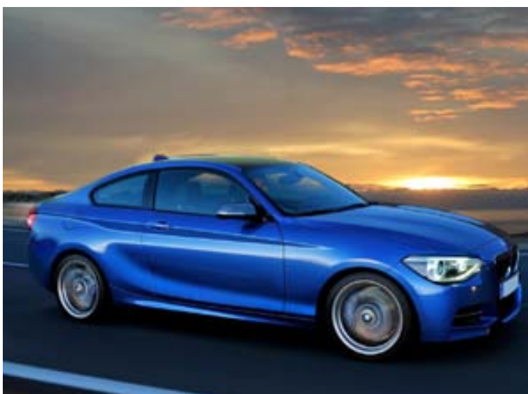
BMW jók sölu bíla sinna í Brasilíu um 90 prósent á fyrstu þremur mánuðum ársins.

hins vegar meira, auk þess sem þróun í hemlun skilar mikilli bætingu á tíma. Þá er M235i vitanlega búinn öllum nútímaþægingum og tæknibúnaði, en margt af slíku var aukabúnaður í CSL. Hröðun í 100 km/klst. tekur um fimm sekúndur og því er um alvöru kraftabíl að ræða enn eina ferðina frá BMW. Umboð fyrir BMW á Íslandi hefur BL og má reikna með að einhverjir sýni nýja M235i áhuga enda er töluvert magn M-bíla til á landinu.