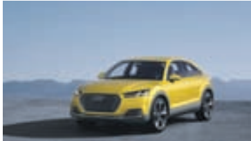
Audi TT Offroad.