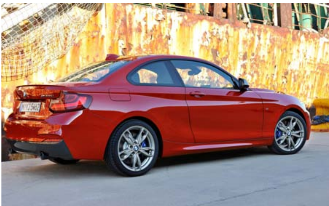
Nýr BMW M235i jafnaði tíma BMW M3 CSL á braut Auto Express á dögnum.

endur sett upp verksmiðjur þar til að sneiða hjá þessum gjöldum. Það hefur Mercedes Benz þó ekki enn gert en hyggst breyta því með opnun verksmiðju árið 2016. BMW er langt komið með uppsetningu verksmiðju í Brasilíu og verður hún opnuð á þessu ári. BMW jók söluna um 90% á fyrstu þremur mánuðum ársins í Brasilíu, en Benz aðeins um 30%. Fleiri lúxusbílaframleiðendur eru einmitt að reisa bílaverkmiðjur í Brasilíu. Jaguar/Land Rover ætla að opna eina slíka árið 2016 og það hyggst Audi einnig gera. Þetta gera öll þessi fyrirtæki þrátt fyrir bakslagið í efnahag landsins nú, en trú þeirra byggist á því að það sé aðeins tímabundið bakslag og að efnameira fólki muni áfram fjölga verulega í Brasilíu, en það eru tilvonandi kaupendur bíla þeirra.