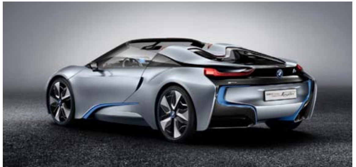
BMW i8 er afar framúrsteftnulegur og tæknivæddur.

andi lífsgæði almennt. Með þessari ákvörðun er víst að margir starfsmenn Toyota þurfa að flytjast búferlum, en þó er talið víst að Toyota muni nota þetta tækifæri til að stokka aðeins upp hjá sér í starfsmannamálum. Eftir þeim er haft að breyting verði á markaðsmálum fyrirtækisins þar sem sumir af núverandi starfsmönnum þess séu ekki endilega heppilegir til að stýra.