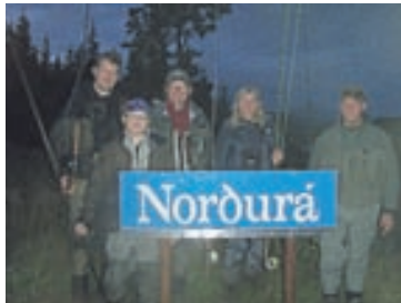
Veiðihjónin ásamt sonum sínum þremur við Norðurá.