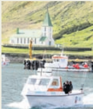
Sjóstangaveiðimenn sigla frá Suðureyri.

Frístundaveiðar er vaxandi þáttur í ferðaþjónustunni en þær hófust á Vestfjörðum árið 2006. Veiðarnar hafa gefið milljónir í ríkissjóð. Heimilt er að stunda fiskveiðar í frístundum til eigin neyslu.