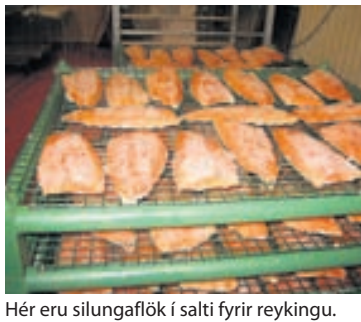
Hér eru silungaflok í salti fyrir reykingu.