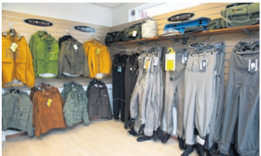
Gott úrval veiðivara fyrir bæði vana veiðimenn og byrjendur.