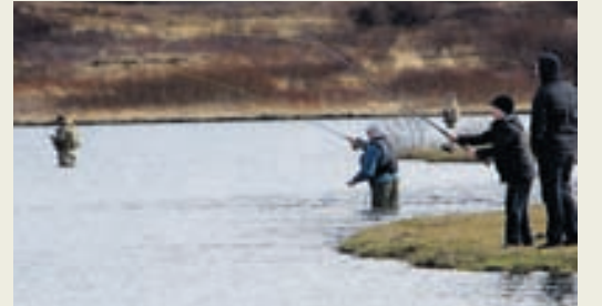
Vífilsstaðavatn er tilvalið til að æfa fluguköstin en vatnið er vinsælt á meðal veiðimanna.

Vinsælasta veiðivatn höfuðborgarsvæðisins og afar gjöfult. Í vatninu eru bleikja, urriði, lax og stöku sjóbirtingur. Bleikjan var ríkjandi í vatninu en síðasta áratug hefur urriðinn