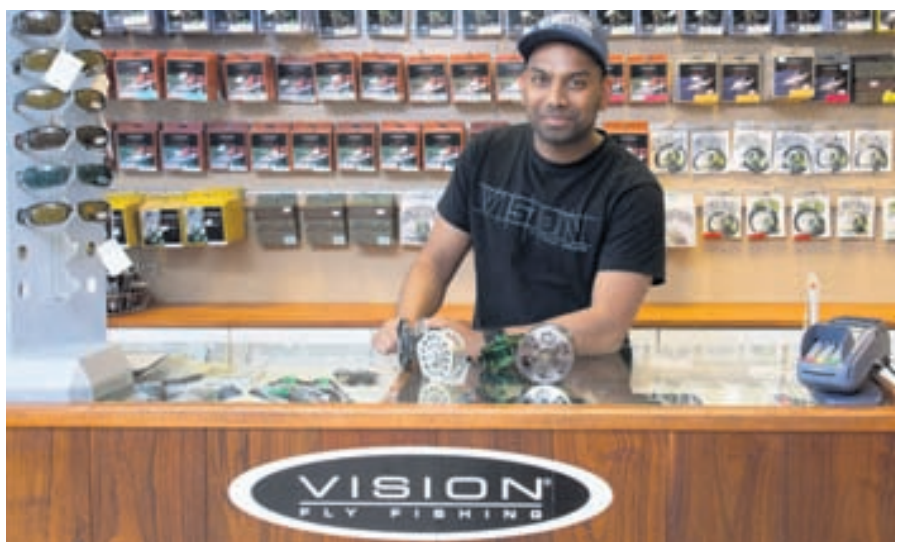
Veiðivörur bjóða upp á mikið úrval veiðivara frá finnska gæðamerkinu Vision.

Allar nánari upplýsingar um vörur verslunarinnar má finna á www.veidivorum.is .