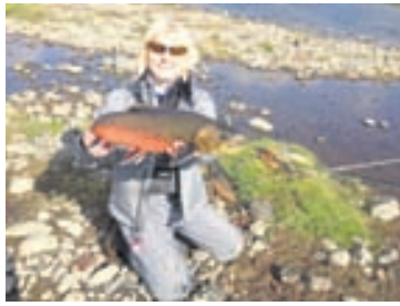
María með væna bleikju úr Vatnsdalsánni árið 2012.

Gott veiðisumar er fram undan hjá þessari miklu veiðifjölskyldu. Hún