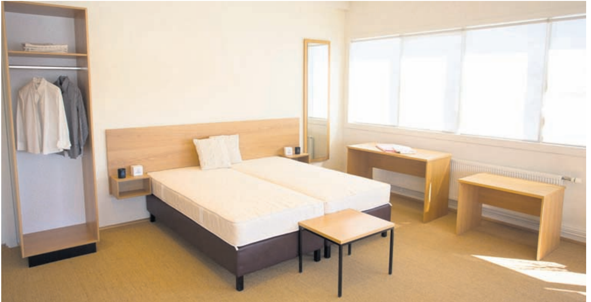
RB rúm sérsníða rúmbotna og dýnur eftir óskum viðskiptavina. Allar dýnur eru með tvöföldu fjaðrakerfi. Þá fást rúmföt og handklæði einnig í RB rúmum.