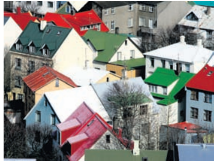
Rekstur gistingar í heimahúsi er leyfissskyld starfsemi.

Nánari upplýsingar má finna á www.lettitaekni.is .