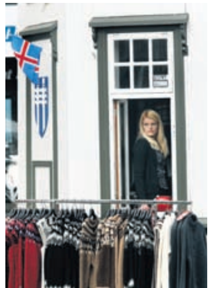
Fjölgun ferðamanna mældist mest í nóvember 2012 eða um 60 prósent.

Ferðamenn frá Mið- og Suður-Evrópu voru áberandi yfir sumar-mánuðina í fyrra en Norðurlandabúar, Bandaríkjamenn og ferðamenn frá löndum sem flokkast undir annað dreifdust talsvert jafnar yfir árið. Bretar skera sig hins vegar úr, en helmingur þeirra kom yfir vetrarmánuðina.