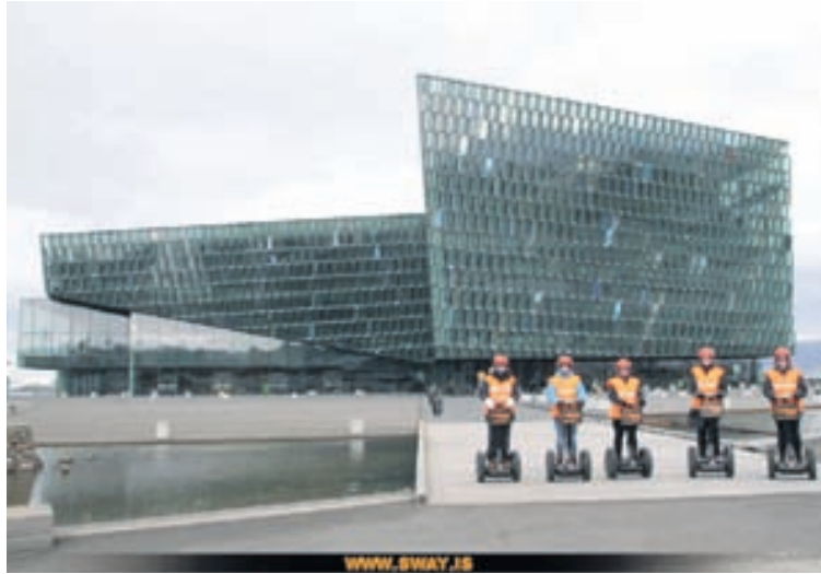
Segway er öruggur, skemmtilegur og þægilegur ferðamáti fyrir ferðamenn.