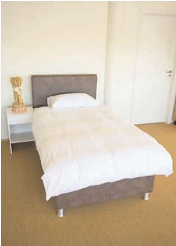
Einnig sérsníða RB rúm höfðagafla og náttborð.