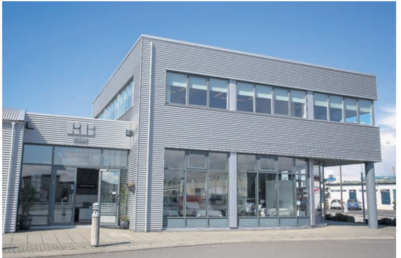
RB rúm eru til húsa að Dalshrauni 8, Hafnarfirði. Nánari upplýsingar er að finna á www.rbrum.is .