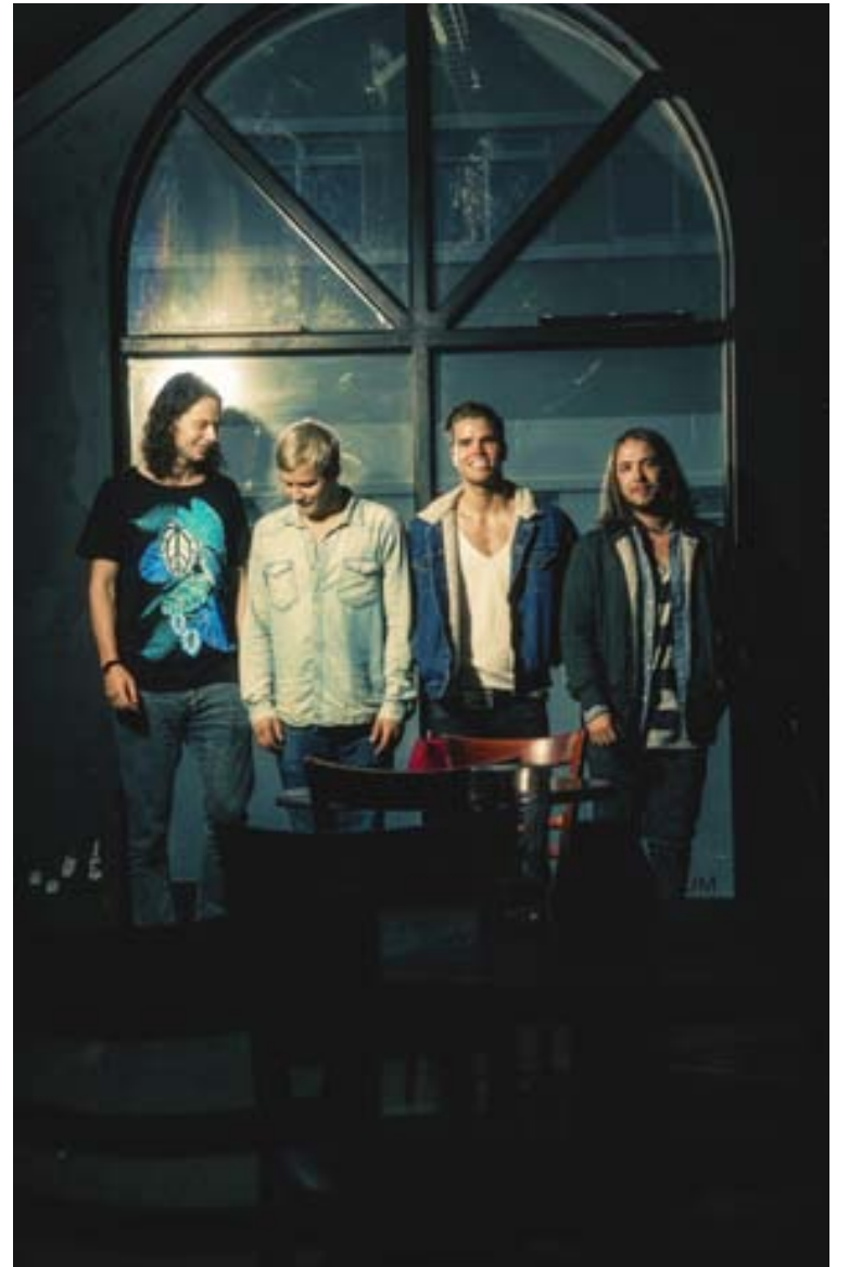
Kaleo hlaut gullplötu á dögnum þegar 5.000 eintök höfðu selst af fyrstu plötu hljómsveitarinnar.