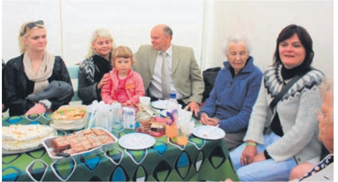
Í tjaldinu Laufási kemur stórfjölskyldan saman yfir kræsingum.