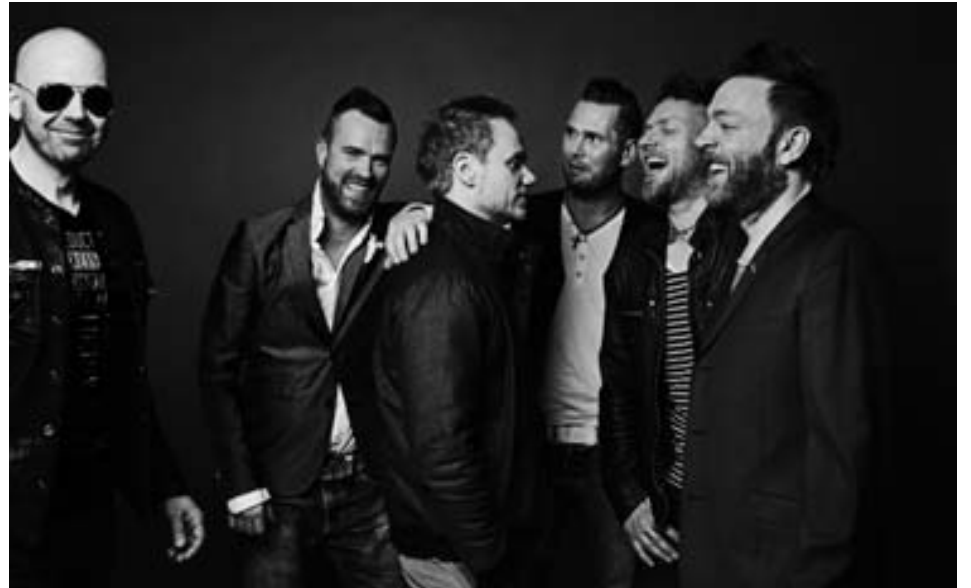
Það er alltaf mikið fjör þegar strákarnir í Skítamóral koma saman.

Skítamóral hefur annars margt á þróunum. „Það kemur nýtt lag frá okkur í haust og svo