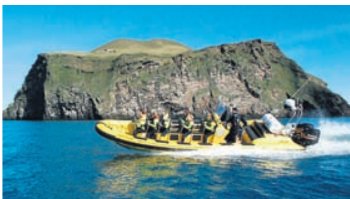
Meðal þeirra sem bjóða upp á bátsferðir frá Eyjum er ribsafari.is.