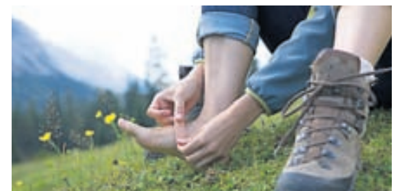
Góðir gönguskór margborga sig.

Flestir mæla með leðurgönguskóm en þeir laga sig vel að fætinum og endast vel. Gott er að hafa þá gúmmívarða á tá og jafnvel allan hringinn. Goretex-skór þykja líka góðir og margir mæla með Vibram-sóla, sem þekkest á