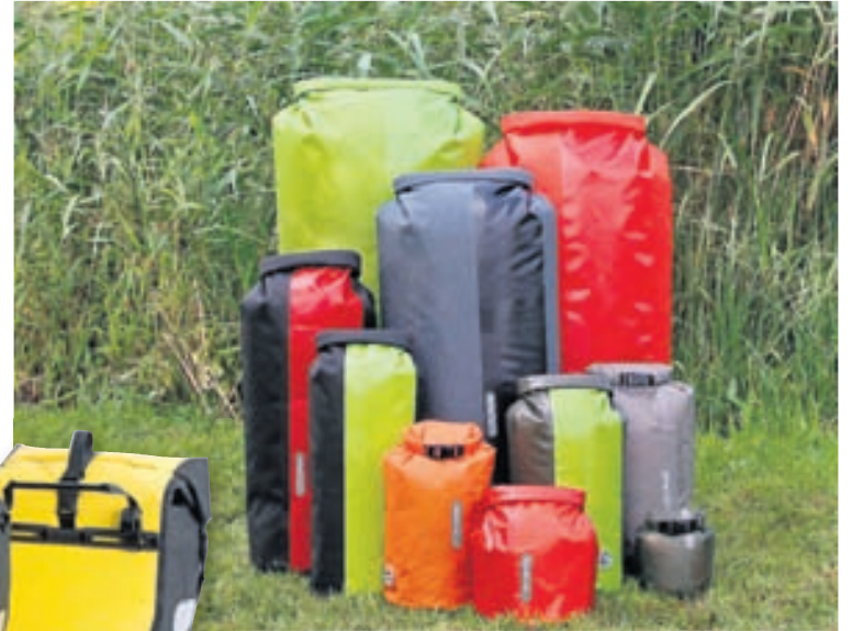
Vörurnar frá Ortlieb eru hundrað prósent vatnsheldar og hafa rokið út að undanförmu.

Fjalli.is býður líka upp á gott úrval skófatnaðar frá breska framleiðandanum Grubs. „Þetta eru vatnsheldir skór, stígvél