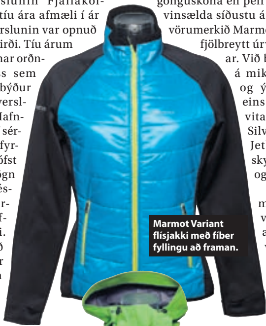
Marmot Variant flísjakki með fiber fyllingu að framan.

Mikil sprengja hefur orðið í þátttöku landsmanna í ýmiss