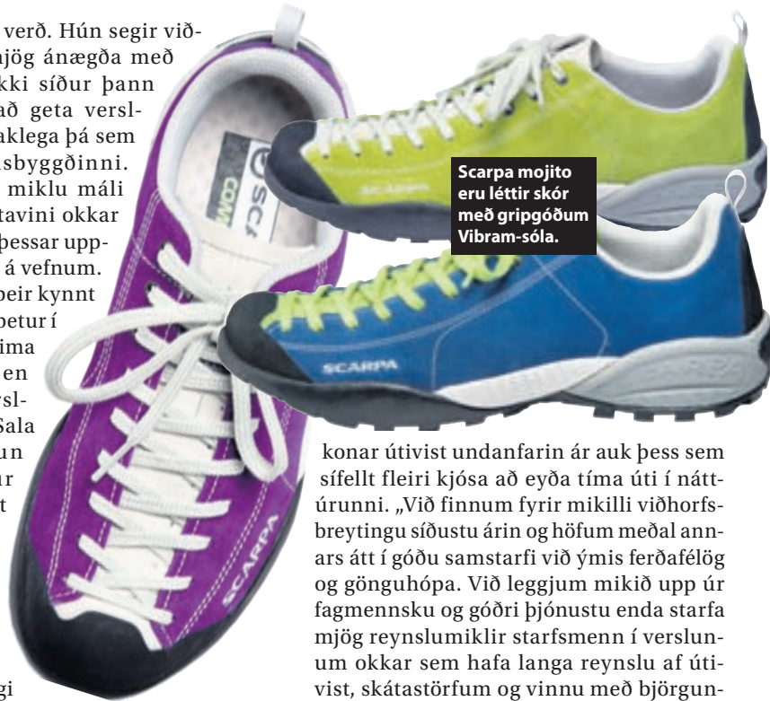
Scarpa mojito eru léttir skór með grippgóðum Vibram-sóla.