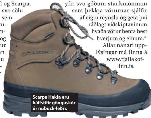
Scarpa Hekla eru hálfstífir gönguskór úr nubuck-leðri.

konar útivist undanfarin ár auk þess sem sífellt fleiri kjósa að eyða tíma úti í náttúrunni. „Við finnum fyrir mikilli viðhorfsbreytingu síðustu árin og höfum meðal annars átt í góðu samstarfi við ýmis ferðafélög og gönguhópa. Við leggjum mikið upp úr fagmennsku og góðri þjónustu enda starfa mjög reynslumiklir starfsmenn í verslunum okkar sem hafa langa reynslu af útivist, skátastörfum og vinnu með björgunarsveitum. Það skiptir miklu máli að búa yfir svo góðum starfsmönnum sem þekkja vörurnar sjálfir af eigin reynslu og geta því ráðlagt viðskiptavinum hvaða vörur henta best hverjum og einum.“ Allar nánari upplýsingar má finna á www.fjallakofinn.is .