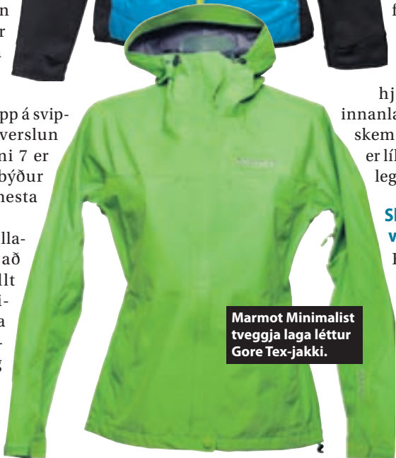
Marmot Minimalist tveggja laga léttur Gore Tex-jakki.