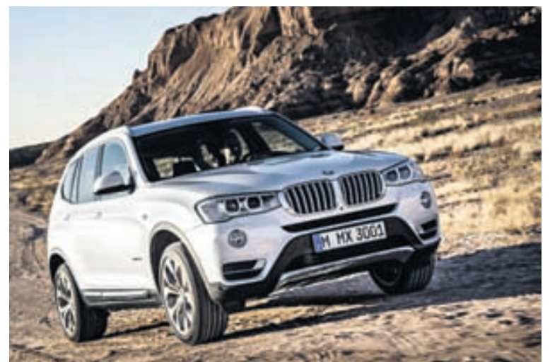
BMW X3-jeppingurinn fær rafmótor og verður 252 hestöfl.

BMW ætlar að bjóða 2017 árgerð X3 með tvíntækni auk þess sem stefnt er að því að léttu bíllinn um 90 kíló með því að nota 3-línu undirvagn undir bíllinn. Hann verður áfram í boði með 2,0 lítra og fjögurra strokka dísilvélum sem fá aukið afl og 3,0 lítra og 6 strokka dísilvél, auk bensínvéla. Aflaukning þeirra mun nema um 15 hestöflum en eyðslan á engu að síður að fara niður um 10 prósent. BMW ætlar að bjóða X3 einnig í kraftaútfærslu, BMW X3 M40i með 360 hestöfl og 422 hestafla BMW X3 M. Tvíntútgáfa bílsins sem hægt verður að hlaða með heimilisrafmagn verður með 240 hestafla bensínvél auk 95 hestafla rafmótors, svo þar fer enginn aumingi. Honum á að vera hægt að