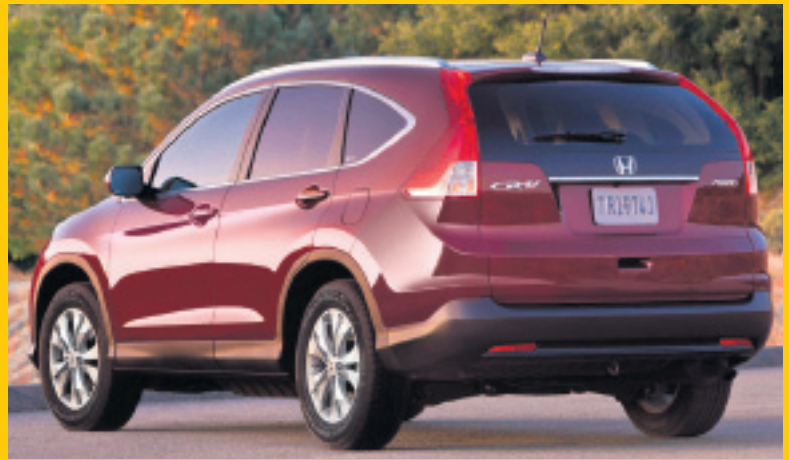
Honda CR-V Hefur ávallt selst eins og heitar lummur vestanhafs og engin lát eru á vinsældunum.

Hún er jöfn keppnin milli jepplinganna Honda CR-V og Ford Escape um hylli kaupenda í Bandaríkjunum. Á fyrstu sex mánuðum ársins hafa selst 154.692 Honda CR-V en 152.890 Ford Escape. Í júní munaði einnig litlu á sölu bílanna, en 26.129 Honda CR-V seldust á móti 25.110 Ford Escape. Í þriðja sætinu í þessum flokki er svo Chevrolet Equinox en af honum seldust 21.748 bílar. Toyota RAV4 vermir fjórða sætið með 21.589 bíla og Nissan Qashqai kom svo næstur með 15.066 selda bíla í júní. Þar á eftir var svo Jeep Cherokee, sem flokkast hefði líklega sem jeppe hirlendis, en af honum seldust 13.337 bílar, rétt ofar en Subaru Forester sem 13.317 bílar seldust af. Þá kemur GMC Terrain langt á eftir með 8.743 bíla og Mazda CX-5 með 8.000 bíla. Til að klára listann yfir tíu efstu þá vermdi Jeep Patriot síðasta sætið með 6.873 bíla.