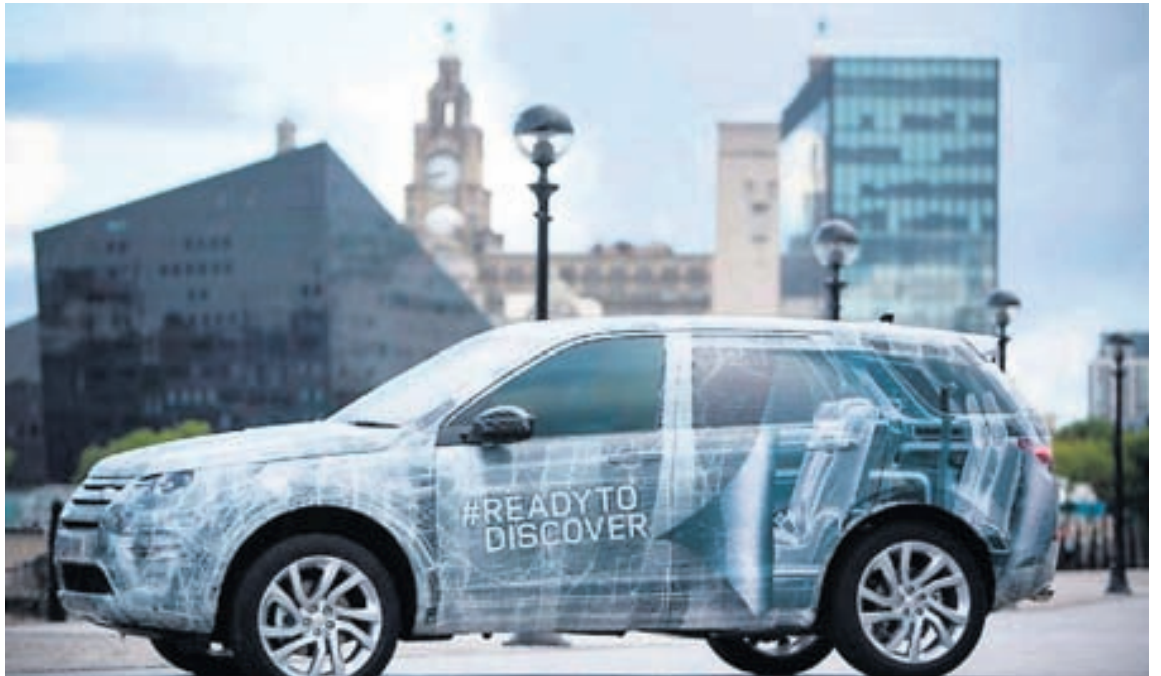
Nýi bíllinn í felubúningi. Land Rover Discovery Sport verður með þremur sætaröðum og rúmar sjö manns.

Bíllinn er 1957 árgerð og keypti Elvis hann notaðan í Þýskalandi. Upprunalega var bíllinn víst hvítur en Elvis var orðinn svo leiður á því að konur skrifuðu símanúmerin sín á bíllinn með rauðum varalit að eina lausnir var að mála bíllinn hreinlega rauðan. Hvað sem öðru líður þá verður þessi frækni bíll nú gerður upp hjá BMW-safninu í München.