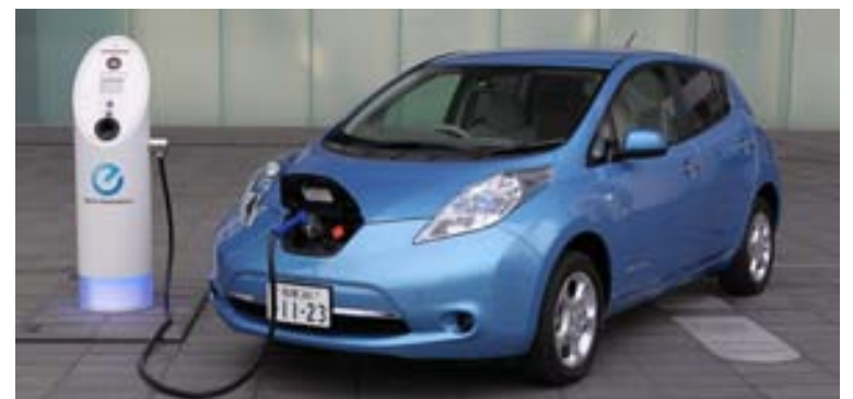
Nissan Leaf hlaðinn á hraðhleðslustöð.

3. Framljós bílsins gera hann hljóðlátari. Ein aukaverkun rafbíls er sú að