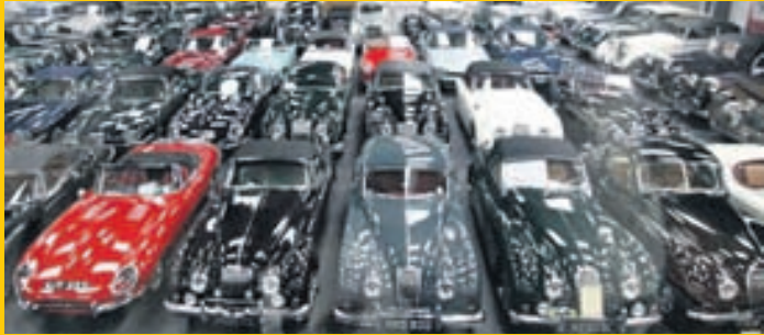
Hluti af safni James Hull sem Jaguar keypti í heilu lagi.