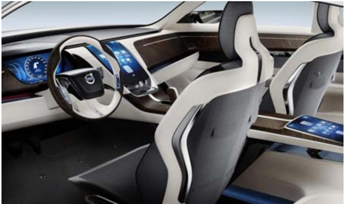
Viður og mjúkt leður samtvinnast handunnum smáatriðum eins og sjálfskiptihnúð úr kristal frá Orrefors.