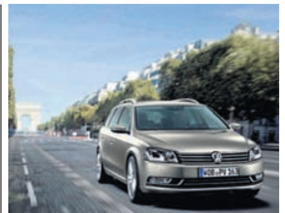
Volkswagen Passat er söluhæsta bílgerðin í flokknum.

Sala á bílnum sem eru í 2. og 3. sæti listans hefur aukist en frönsku bílarnir á listanum hafa minnkað verulega í sölu og Toyota Avensis og Hyundai i40 einnig. Mazda6 er þó í góðum málum. Toyota er þessa dagana að velta fyrir sér hvort nauðsynlegt sé að hanna sérstakan bíl í þessum flokki fyrir Evrópumarkað eða sérútgáfu af Avensis. Honda gæti tekið Accord-bíl sinn af markaði í Evrópu strax á næsta ári, en sala hans minnkaði um 26% á þessum fyrstu fjórum mánuðum ársins