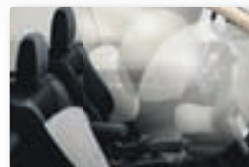
Sjö SRS loftþúðar vernda ökumann og farþega.

Búnaður í Outlander Intense: 18" álfelgur, aðgerðastýri, upplýsingaskjár í mælaborði með bakkmyndavél, USB tengi og handfrjáls símabúnaður, hraðastillir, tvískipt tölustýrð miðstöð, upphituð framsæti, upphituð framrúða, AM/FM útvarp, CD/MP3 spilari, rafdrifnir og upphitaðir útispeglar með stefnuljósum, vindskeið að aftan með LED lýsingu, þokuljós að framan, regnskynjari á rúðupurrkum, sjö öryggisþúðar, skyggt gler í hliðar- og afturrúðu, langbogar á þaki, þvottasprautur á aðalljósum, dagljósabúnaður.