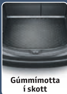
Gúmmimotta í skott

að verðmæti 430.000 kr. fylgir nýjum RAV4* í haust í takmarkaðan tíma.