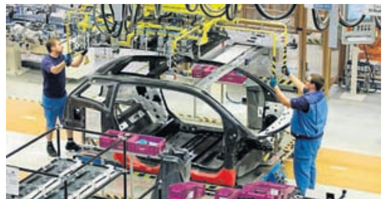
BMW i3-rafmagnsbíllinn settur saman.

F-150-pallbílsins sem nú er að mestu smíðaður úr áli er notað þrisvar sinnum meira af límeftum en í fyrri gerð bílsins. BMW hefur sagt að viðgerðir á nýjum i3-rafmagnsbíl sínum séu nú auðveldari og ódýrari vegna samánlimdra koltrefjaeinginga sem bíllinn er nú smíðaður úr. Yfirbygging bílsins