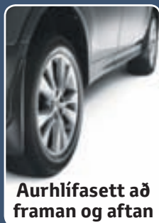
Aurhlífasett að framan og aftan