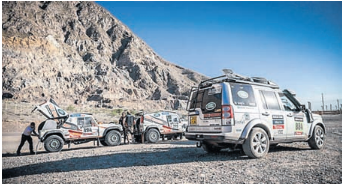
Bílar frá Land Rover í Dakar-rallinu en Land Rover vann einmitt fyrstu keppnina í þessum fræga þolakstri.

*Prentmiðlökunum Capacent október-december 2012 - höfuðborgarsvæði 25-54 ára