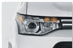
Xenon aðalljós með sérstaklega víðu birtusviði.