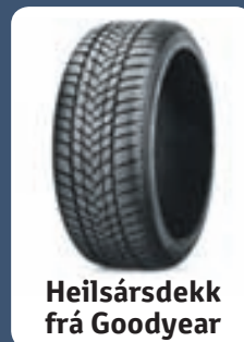
Heilsársdekk frá Goodyear

Uppgötvaðu ævintýrin í lífi þínu á ný. Það er innblásturinn að baki endurhönnun á RAV4, ökutæki sem er fullkominn félagi fyrir skemmtun með vinum og fjölskyldu. RAV4 hefur burði til að koma þér hvert sem þú vilt fara og það er nóg rými fyrir farþega og farangur. Hann er hljóðlátur, öruggur og með framúrskarandi aksturseiginleika. Fáðu þér suddalega flottan RAV4 í haust hjá viðurkenndum söluaðilum Toyota meðan tilboðið varir.