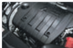
Sparneytin 2.0 lítra vél skilar lágum útblæstri kolefnis.