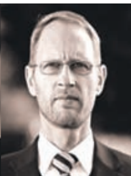
Frímarr Andrússon útfararþjónusta