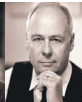
Ellert Ingason útfararþjónusta