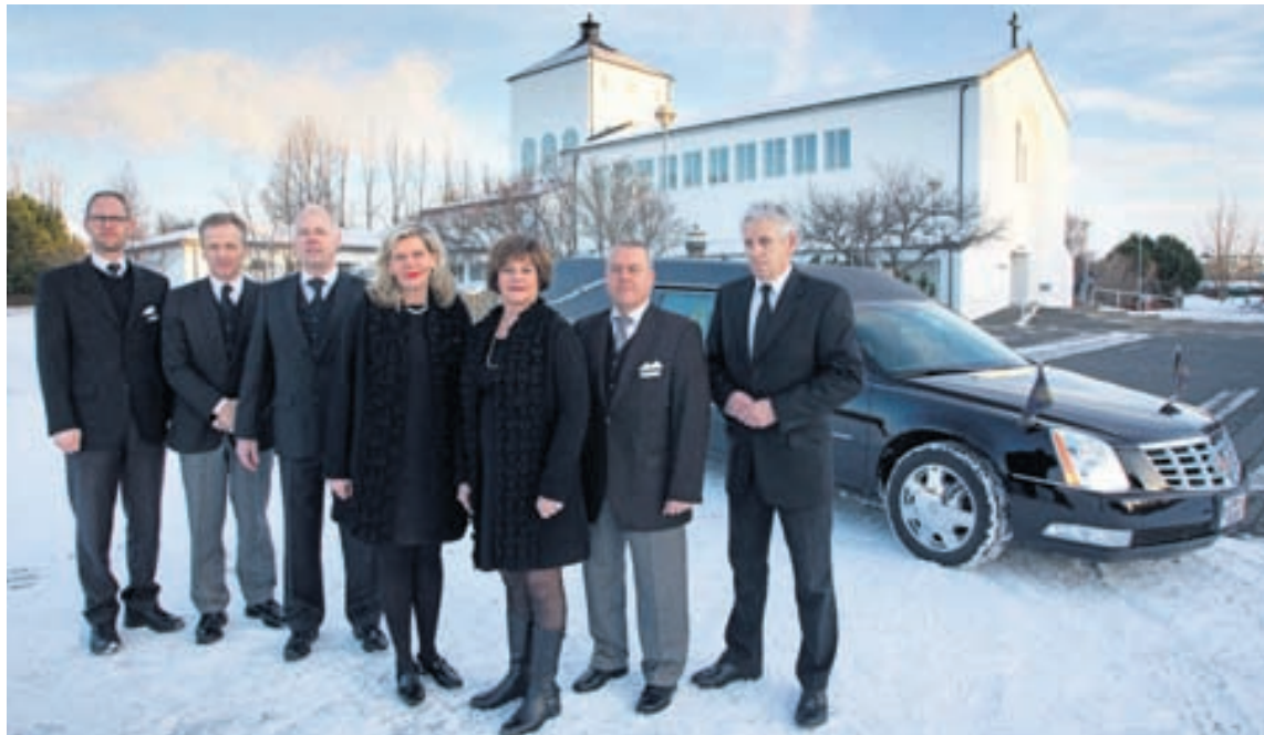
Hluti starfsfólks Útfararstofu Kirkjugarðanna hefur þjónað við útfarir í meira en 20 ár. „Starfsmenn okkar eru þekktir fyrir fagmennsku og fágun.“

„Útfararstofa kirkjugarðanna er fulltrúi Íslands í Nordisk Forum, samtökum útfararstofa á Norðurlöndum. Það samstarf hefur gefið útfararstofunni mikið. Við höldum áfram að innleiða það besta sem útfararþjónusturnar á Norðurlönd-