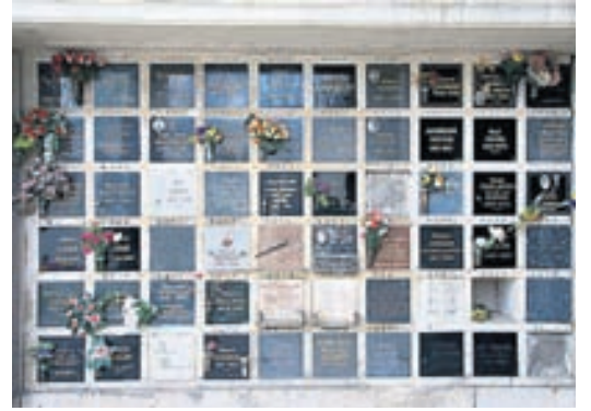
Hillurnar eru gjarnan skreyttar fallegum blómum.

ar á leigu af aðstandendum og þær gjarnan skreyttar með myndum af þeim látna, blómum og jafnvel öðrum persónulegum munum. Þegar leigutíminn er liðinn er öskunni jafnan dreift yfir þar til gert svæði innan kirkjugarðsins. Byggingarnar eru stundum hluti af grafhýsum en geta líka staðið einar og sér. Fyrr á öldum voru margar þeirra að öllu leyti neðanjarðar eða að minnsta kosti stór hluti þeirra. Meðal frægra Columbarium-bygginga má nefna Columbarium of Pomponius Hylas í Róm á Ítalíu, Père Lachaise Cemeteryn í París og Golders Green Crematorium sem er í London.