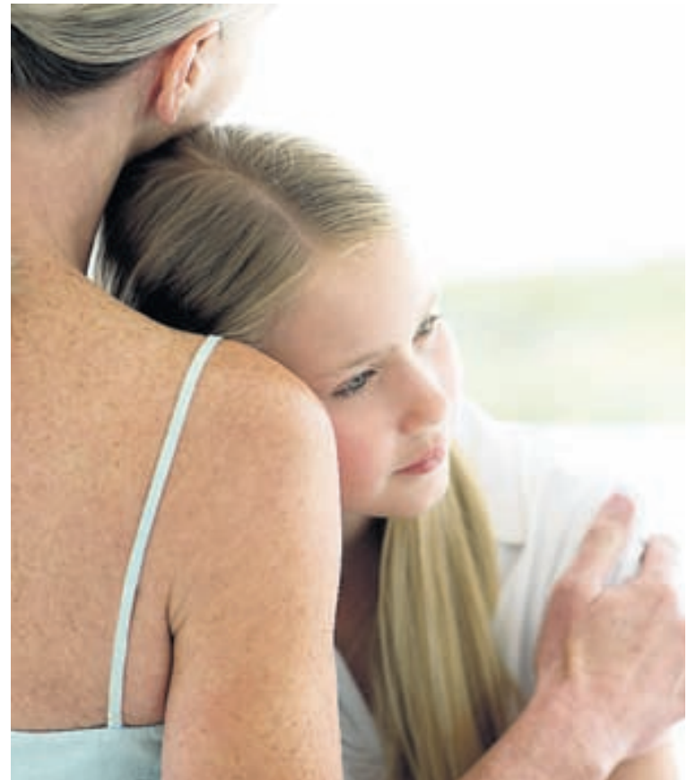
Markmið samtakanna er að styðja við bakið á ungu fólki eftir makamissi og vera vettvangur þar sem fólk getur hjálpað hvert öðru í sorg.

Þeir sem vilja kynna sér málið nánar geta farið á vefsíðuna www.litlirenglar.is en samtökin má einnig finna á Facebook.