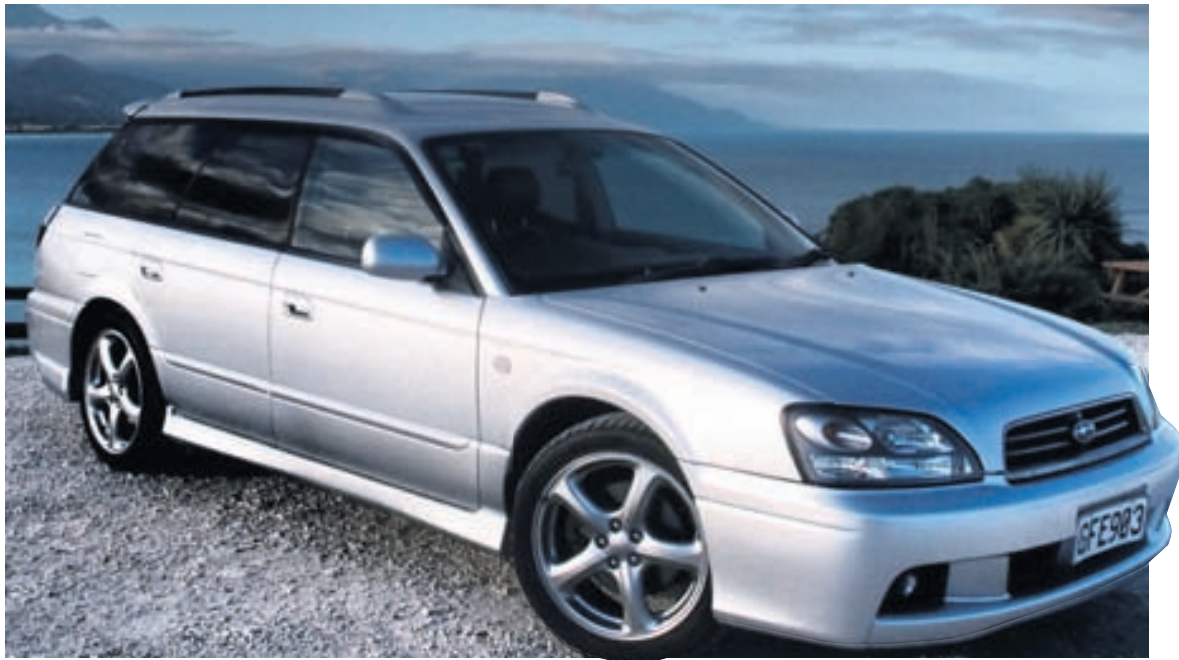
Subaru Legacy er einn þeirra níu bíla sem þykja öruggastir, samkvæmt rannsókn IIHS.

Afar mjótt var á mununum hjá þýsku lúxusbílaframleiðendum BMW og Benz hvað fjölda seldra bíla varðar í Bandaríkjunum á nýliðnu ári. BMW seldi 339.738 bíla þar en Mercedes Benz 330.391 bíl. Allt síðasta ár var óljóst hvort fyrirtækið myndi selja fleiri bíla á árinu, en það var svo afar góð sala BMW í desember sem skar á milli. Mercedes Benz varð söluhærra en BMW vestra árið 2013, en BMW var söluhærra árið 2012. Það var svo 9,8% söluaukning BMW í fyrra samanborið við 5,7% aukningu hjá Benz, sem færði BMW aftur toppsætið. Einn annar lúxusbílaframleiðandi er þó að nálgast þá tvo þýsku, þ.e. Lexus, og það frekar hratt. Söluaukning Lexus í fyrra nam 13,7% og heildarsalan var 311.389 bílar. Audi var þó með meiri söluaukningu en áður nefndir þeir framleiðendur, en aukning Audi nam 15,2% og seldust 182.011 bílar í fyrra. Með þeirri sölu komst Audi upp fyrir Cadillac í sölu meðal lúxusbílaframleiðenda. Cadillac seldi 170.750 bíla, Acura (í eigu Honda) 167.843 bíla, Infinity (í eigu Nissan) 117.300 bíla og Lincoln 94.474 bíla.