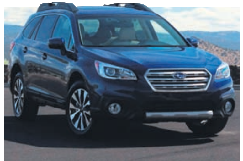
Með Subaru Outback af árgerð 2015 er horfið aftur til fortíðar í útliti bílsins.

Þessi bíll sameinar nefnilega svo margt. Fyrir það fyrsta er hann frábær er kemur að erfiðari aðstæðum og þar sem hann er bæði háfættur og búinn rómuðu fjórhjóladrifi Subaru er hann afar hentugur bíll þar sem snjór og erfiðari vegir mæta ökumönnum. Hann er mjög rúmgóður bíll sem fer létt með vísitölufjölskylduna á ferðalagi og með mikið flutningsrými. Hann er einn öruggasti bíll sem hægt er að eignast, en Subaru