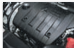
Sparneytin 2.0 lítra vél skilar lágum útblæstri kolefnis.