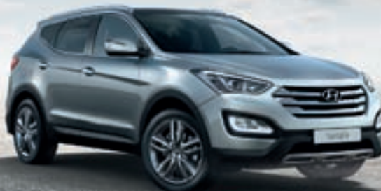
Hyundai Santa Fe

Fjór hjóladrif / Dísil sjálfsk. Verð frá 7.050.000 kr. Eyðsla 6,7 l/100 km*