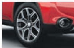
18" sportlegar álfelgur eru staðalbúnaður.