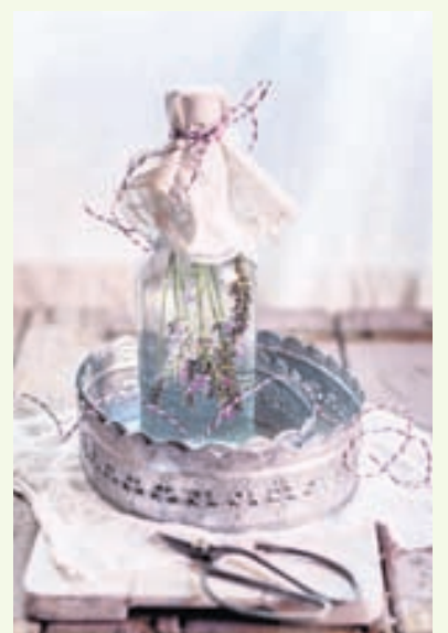
Edik er bæði hægt að nota sem snyrtivöru og í heimilisþrifin.

Settu 200 ml á móti hverjum lítra af vatni í fótabaðið til að losna við óæskilega táfýlu. Njóttu baðsins í 15 mínútur og gættu þess að þerra tærnar vel áður en þú ferð aftur í sokkana.