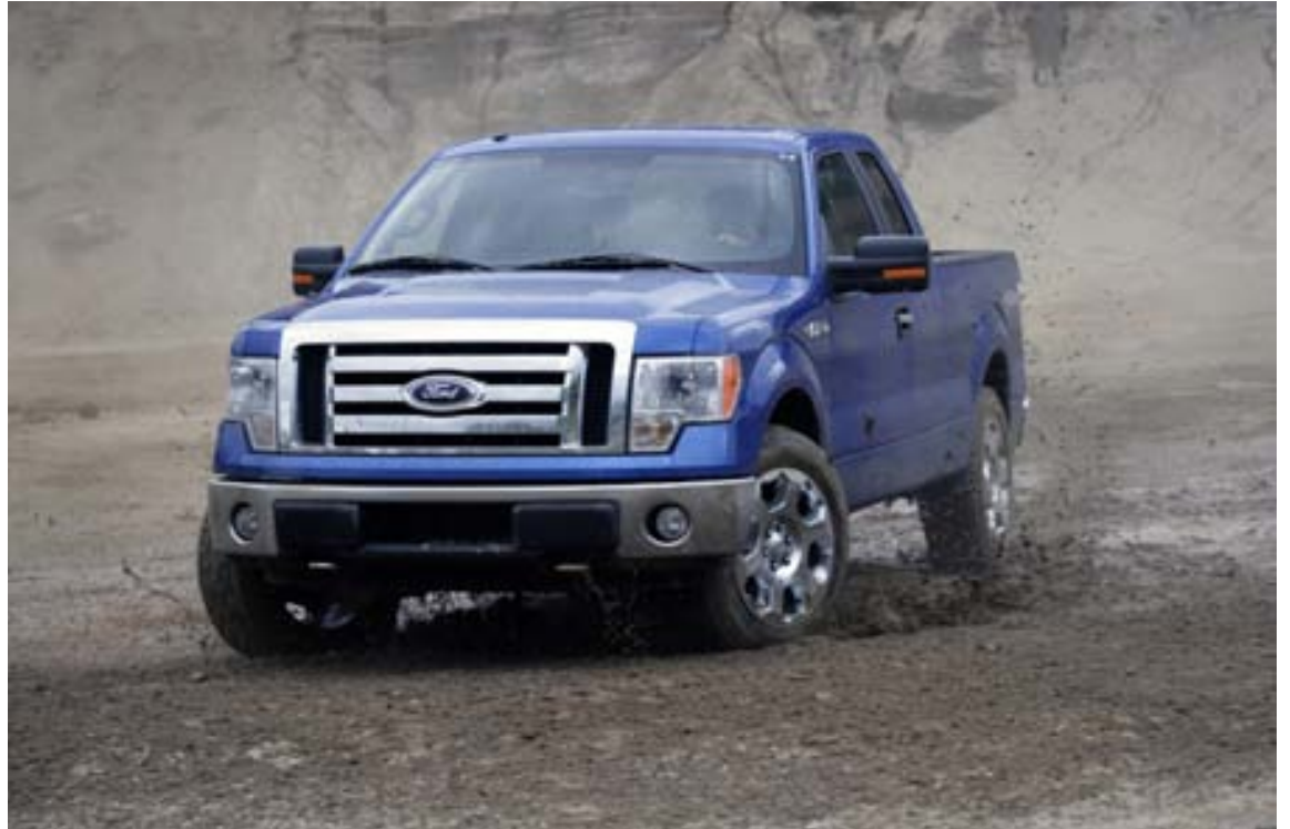
Ford F-150 er vinsælasti bíllinn í 14 ríkjum Bandaríkjanna.