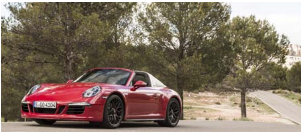
Porsche 911 GTE Targa var fararskjóttinn frá hóteli að kappakstursbrautinni.

Hver einasti þessara GTE-bíla Porsche var frábær. Það sem kom kannski mest á óvart var að Porsche Cayman GTE var skemmtilegastur í akstri þó svo að hann búi yfir talsvert minna afli en 911 GTE. Einnig var magnað að keyra Panamera GTE, svona stóran sleða og finna allt það geggjada veggrip sem hann hafði og hve hratt var hægt að fara brautina á honum. Þá var forvitnilegt að prófa Cayenne-jeppan í þessari útfærslu en erfiðast var að halda honum á brautinni, finna rétta línu fyrir hann og ná góðum tíma. En ári var hann samt öflugur. Porsche 911 GTE er 430 hestöfl, Boxter GTE 330 hestöfl, Cayman 340 hestöfl og Panamera GTE og Cayenne GTE báðir 440 hestöfl. Bestum tíma í hundraðið nær 911 GTE, 4,1 sekúnda. Næstbest gerir Panamera á 4,4, Cayman á 4,9, Boxter á 5,0 og Cayenne á 5,2 sekúndum. Þrátt fyrir betri tíma 911 en Cayman var eins og jafn hratt væri hægt að aka brautina á þeim síðarnefnda þar sem léttleiki og liðleiki bílsins til brautaraksturs er svo mikill. Þessi dagur og sú reynsla sem þarna náðist verður undirrituðum ógleymanleg, en í leiðinni nota-drjúg.