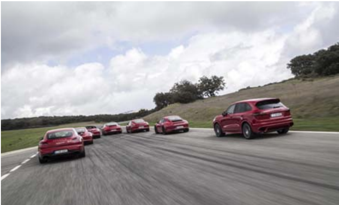
Porsche GTE-fjölskyldan á fullri ferð í brautinni.

Peugeot 308 R Hybrid er með 270 hestafla bensínsvél og rafmótora sem skila 115 hestöflum að jafnaði, en með „Hot Lap“-stillingu má kreista meira afl útúr þeim og er þá heildarhestaflafjöldinn orðinn 500. Það dugar til að koma bílnum í 100 km hraða á 4 sekúndum. Peugeot hefur ekki enn gefið upp hvort af fjöldaframleiðslu á þessum bíl verður, né heldur á hvaða verði hann yrði þá seldur. Þeir sem fjallað hafa um bílinn hafi giskað á að verð hans yrði á bilinu 50 til 60 þúsund dollarar, eða 6,8-8,1 milljónir króna. Það er nokkru viðráðanlega verð en á ofantöldu bílunum.