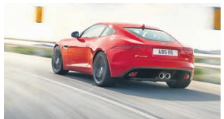
Jaguar F-Type S Coupé er sannkallaður kraftaköggull.

Bílaumboðið BL er nú að hefja sölu á Jaguar-bílum en eins og kunnugt er koma Jaguar-bílar frá sama framleiðanda og Land Rover, þ.e. Jaguar/Land Rover. Það fyrirtæki er í eigu Tata frá Indlandi, þó að bæði bílamerkin séu bresk. Fyrsti bíllinn sem BL flytur inn af Jaguar-gerð er þessi F-Type S Coupé-bíll og verður hann forsýndur á komandi bílasýningu í Fífunni. Bíllinn er fjórhjóladrifinn og með 380 hestafla 3,0 lítra V6 bensínvél sem kemur honum í 100 km hraða á aðeins 4,9 sekúndum. Þessi gullfallegi bíll er hlaðinn lúxus og allra handa góðgæti, þar á meðal 770 vatta hljóðkerfi með 12 hátölurum, glæsilegu, stöguðu leðri í sætum og rauðum öryggisbeltum, leðurklæddu sportstýri, póleruðum