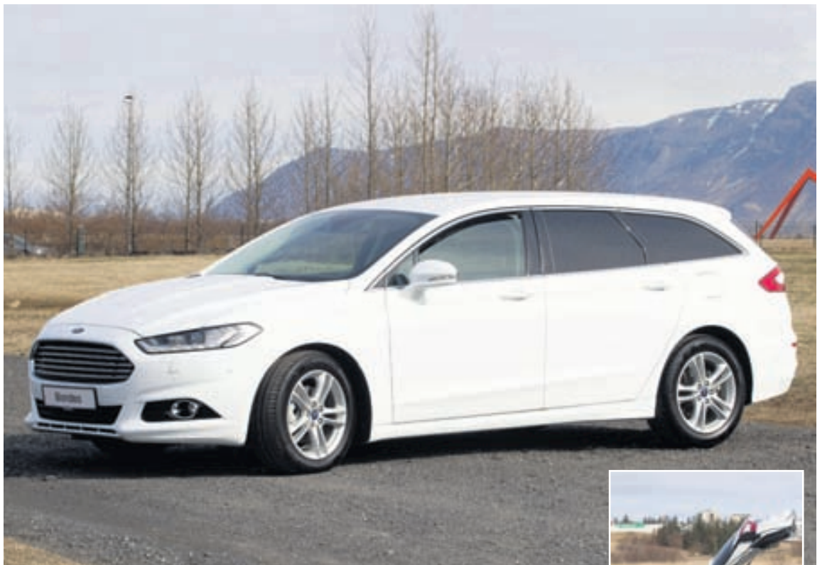
Ford Mondeo er stór fjölskyldubíll, afar hentugur í ferðalögin.