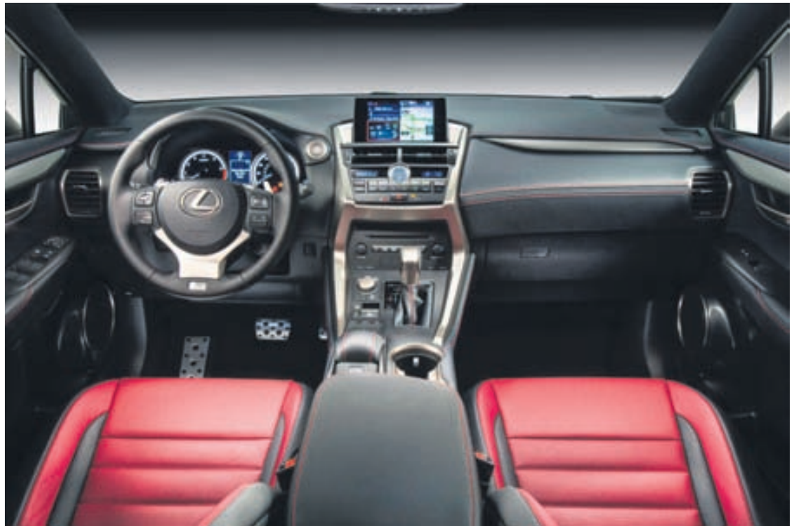
Ógnarfalleg innrétting í Lexus NX200t.

Fyrir ríkisþinginu í Washington-ríki í Bandaríkjunum liggur nú frumvarp sem gefur lögreglunni í ríkinu rýmri heimildir til að sekta ökumenn sem aka of hægt á vinstri akrein á fjölfarnari vegum. Þessum lögum er ætlað að stöðva hættulegan og hægan akstur ökumanna sem ekki taka tillit til annarra í umferðinni. Í lögum eru tilgreindar þær sektir sem ökumenn mega eiga von á ef þeir aka á vinstri akrein undir leyfilegum hámarkshraða. Ökumenn sem aka 2-8 km/klst. undir hámarkshraða á vinstri akrein fá 27 dollara sekt. Þeir sem aka á 9-16 km/klst. undir hámarkshraða fá 37 dollara sekt, 52 dollara fyrir 17-25 km/klst., og 67 dollara fyrir 26-32 km/klst. undir hámarkshraða. Í Washington-ríki er mikil hefð fyrir því að kenna ökumönnum góða síði í umferðinni og þar hafa mörg lög orðið fyrst að veruleika sem snúa að því, svo sem að sekta fyrir að vera staðinn að símskilaboðasendingum í akstri og að leggja í stæði sem ætluð eru fyrir rafmagnsbíla.