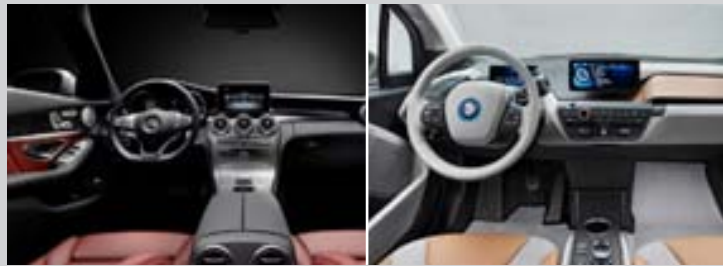
Innréttingin í Mercedes Benz C-Class. Innréttingin í BMW i3.