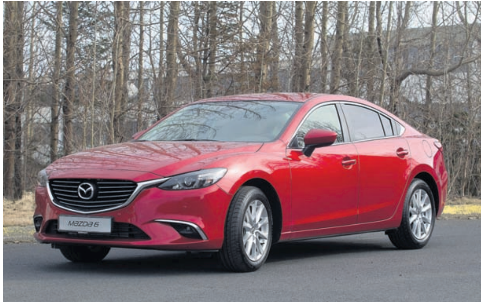
Mazda6 í Sedan-útfærslu er fallettri bíll en ennþá fallettri í langbaksgerð.

Eins og fyrr segir er Mazda6 einkar laglegur bíll að ytra útliti en það á einnig við að innan. Það er ekki hægt að tala um neinn íburð, en fremur smekklegheit og góða uppröðun stjórnr-