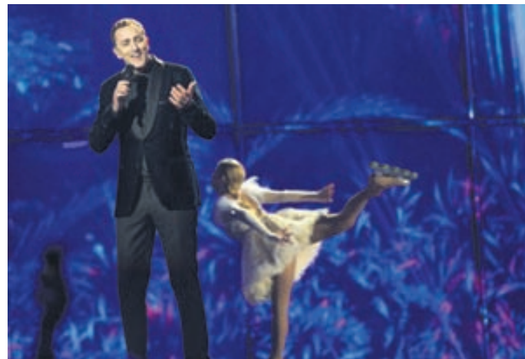
Svartfellingar hafa ekki fengið eitt einasta stig frá Íslandi þrátt fyrir að hafa fimm sinnum keppt á sama tíma og við.

Svipað er uppi á teningnum hjá Bretum. Þeir hafa gefið okkur 99