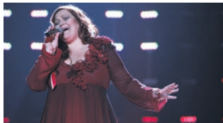
Íslendingar geta yfirleitt treyst á Dani þegar kemur að stigagjöfinni í Eurovision.

stig, að jafnaði þrjú stig á ári, en við þeim aðeins 37 stig, eða eitt stig á ári. Þeir hafa gefið okkur 62 stigum meira en við þeim.