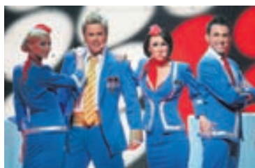
Í átján skipti hafa Bretar gefið sigurlagi keppninnar það árið 12 stig.