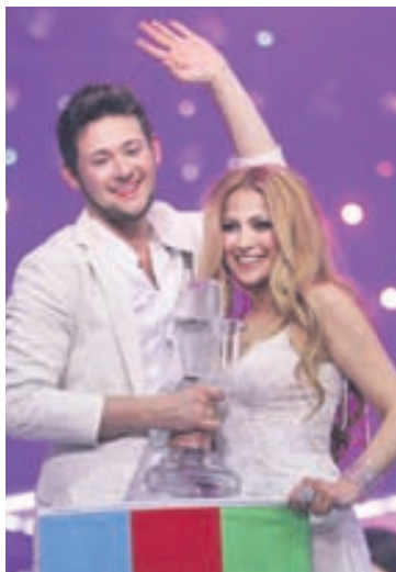
Aserbaidsjan hefur ekki sent okkur eitt einasta stig.

Stigaskipti Íslands og Svíþjóðar eru í mun meira jafnvægi. Við