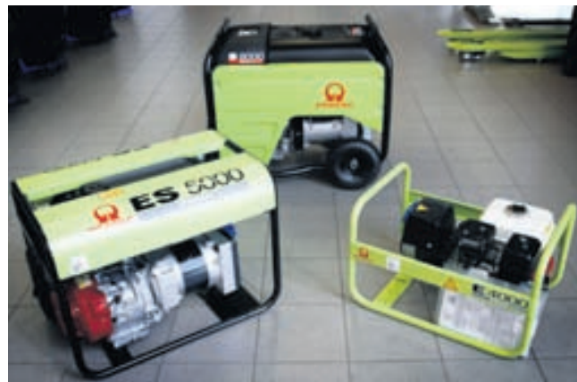
Klettur fer með umboð Pramac-rafstöðva. Rafstöðvarnar eru til á lager frá 2 kílóvöttum og upp úr.