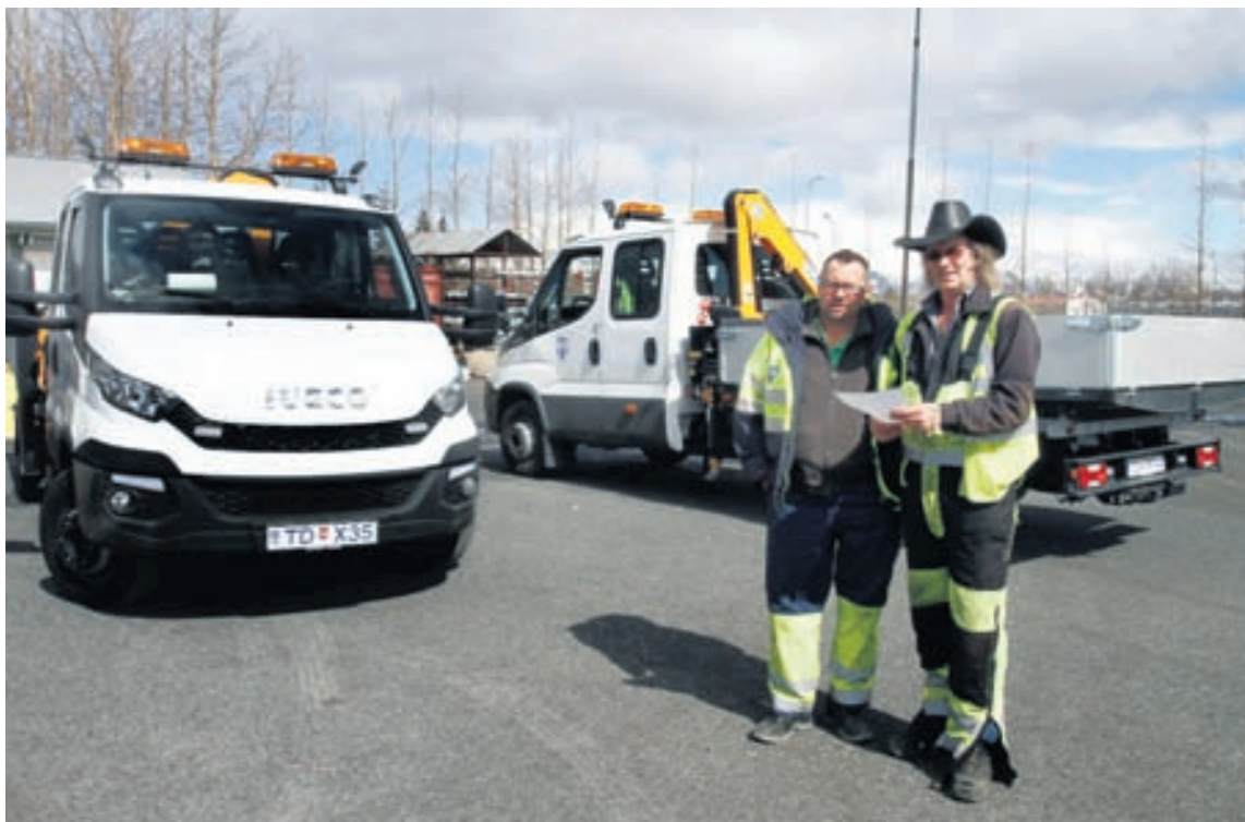
Starfsmenn umhverfis- og skipulagssviðs Reykjavíkur gegna hinum ýmsu verkum í borgarlandinu. Þeir fengu nýlega afhenta nýja flokkabíla sem auðvelda þeim störfin.

Eins og áður segir munu nýju bílarnir verða til þess að vinnu- ástanda starfsmanna batnar til