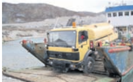
Ólafur fór í ævintýrlega ferð til Upernavik að sækja landgöngupramma sem síðan var í stöðugum flutningum með efni og tæki til virkjanagerðar í Sisimiut og Ilulissat.