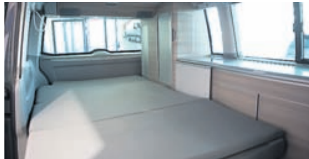
Í bílnum er svefnpláss fyrir fjóra.