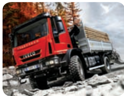
Iveco 4x4 Eurocargo

Öflugur verktakabíll sem hefur sannað sig við íslenskar aðstæður