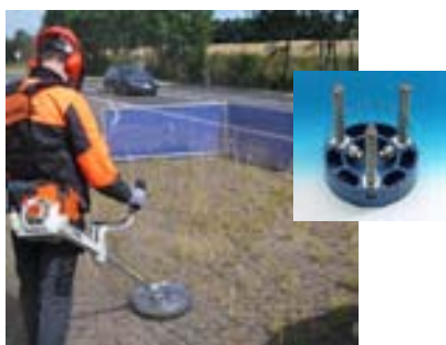
Hreinsiburstar fyrir illgresi á sláttuorf

Allar nánari upplýsingar má finna á www.aflvelar.is .