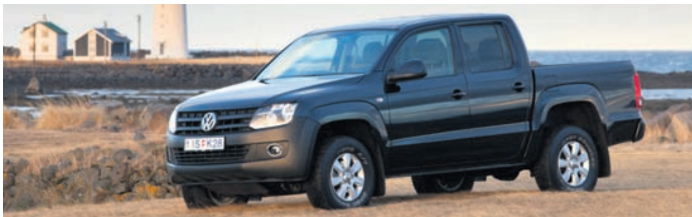
VW Amarok-pallbíllinn sameinar kosti lúxusjeppe og pallbíls.

Í höfuðstöðvunum er sömuleiðis hægt að skoða VW Amarok-pallbíllinn sem er í sama flokki og Toyota Highlux. „Hann er á milli evrópsku og japönsku bílanna að stærð og mjög öflugur. Hann sameinar kosti lúxusjeppe og pallbíls og hefur upp á að bjóða mikla notkunarmöguleika fyrir fólk með fjölbreyttan lífsstíl. Ég myndi segja að þetta væri fágaður pallbíll. Þetta er lúxusbíll að keyra. Hann er