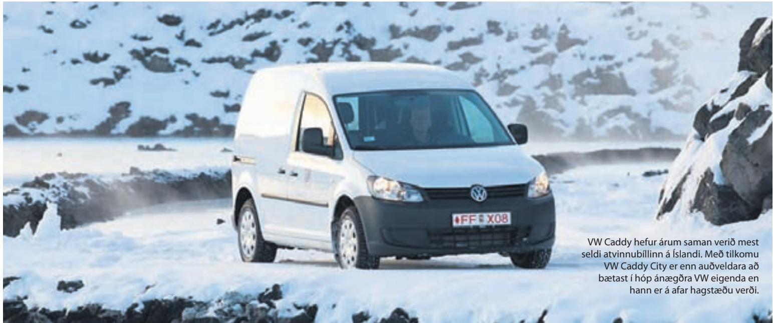
VW Caddy hefur árum saman verið mest seldi atvinnubíllinn á Íslandi. Með tilkomu VW Caddy City er enn auðveldara að bættast í hóp ánægðra VW eigenda en hann er á afar hagstæðu verði.