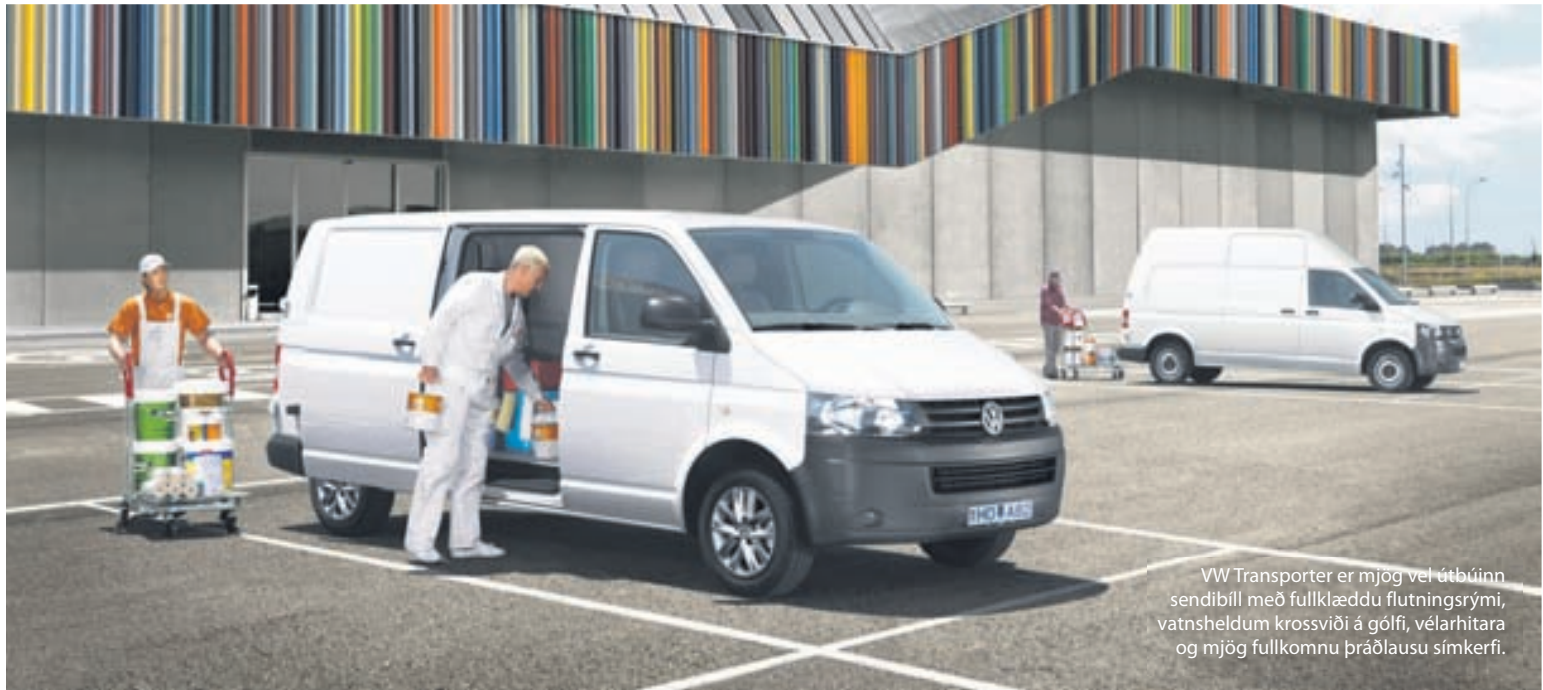
VW Transporter er mjög vel útbúinn sendibíll með fullklæddu flutningsrými, vatnsheldum krossviði á gólfi, vélarhitara og mjög fullkomnu þráðlausu símkerfi.