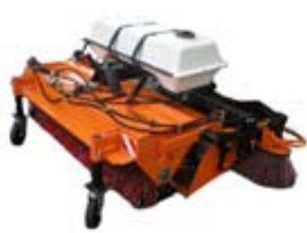
Sópar á dráttarvélar.