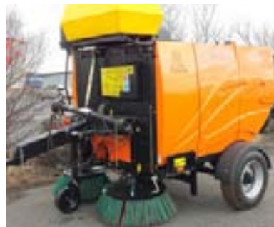
Pronar ZMC 2.0 2 rúmmetra dreginn sópur af dráttarvél, hægt að losa uppsóp í vagn eða gám. Til á lager.