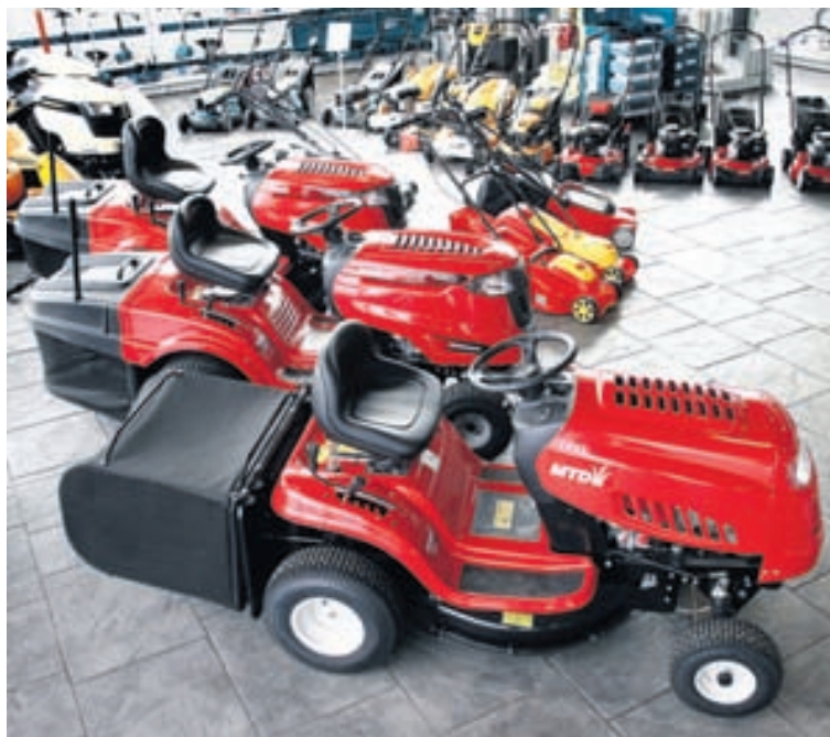
„Meðal viðskiptavina okkar eru bæjarfélög, fyrirtæki í atvinnuslætti og kirkjugarðar víðs vegar um landið.“