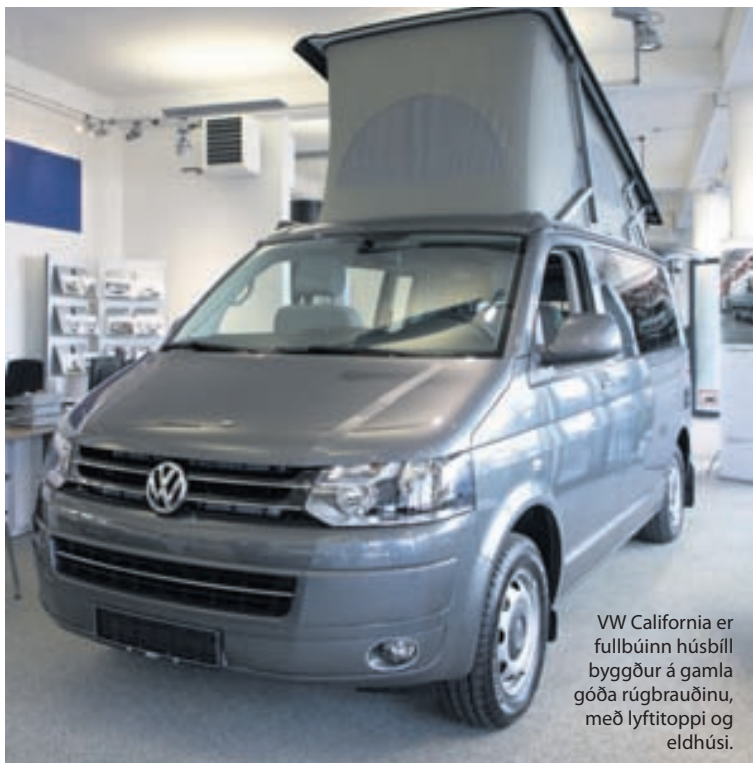
VW California er fullbúinn húsbíll byggður á gamla góða rúgbrauðinu, með lyftitoppi og eldhúsi.