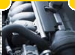
Minna vélar slit