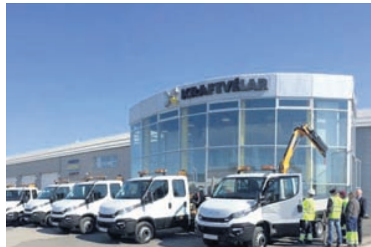
Umhverfis- og skipulagssvið Reykjavíkurborgar hefur fengið afhenta fimm nýja Iveco-flokkabíla til reksturs og umhirðu borgarlandsins. Nýju bílarnir leysa af hólmi gömlu appelsínugulu Benz-flokkabílana sem hefur verið ekið um götur borgarinnar í mörg ár. Nýju bílarnir eru öflugri og tæknilega betur búnir en fyrirrennarar þeirra. Allir eru þeir með krana og pall sem hægt er að sturta af á þrjá vegu. Sæti eru fyrir sjö manna öflugan vinnuflokk í hverjum bíl.