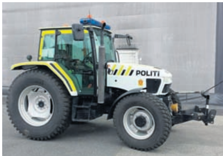
Lögglutraktorinn er vígalegur.