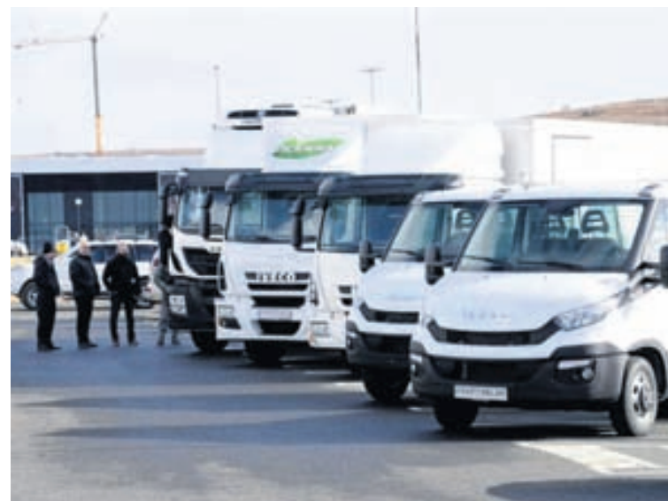
Í lok mars héldu Kraftvélar og Toyota í Kaupþúni sameiginlega atvinnubílasýningu þar sem kynntar voru Iveco- og Toyota-atvinnubifreiðar. Sýningin heppnaðist einstaklega vel og gerðu hátt í tvö þúsund gestir sér ferð í Kaupþúnið til þess að skoða bílana sem voru á sýningunni.