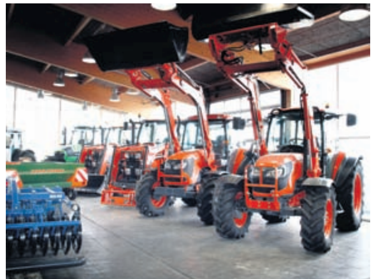
Meðal þeirra merkja sem Þór hf. selur má nefna Makita, Flex, Kubota, Prebena og Demag. Þá er Wacker Neuson vel þekkt merki innan verktakageirans.