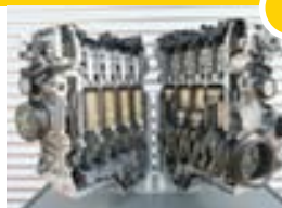
Hreinsandi fyrir vélna