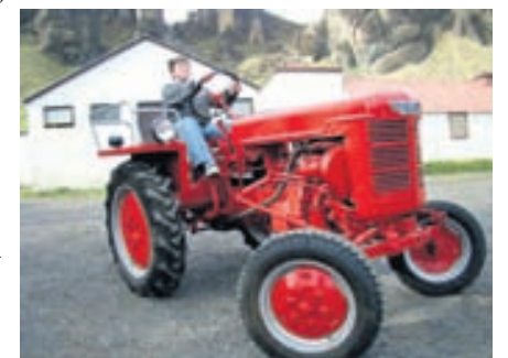
Hér er dæmi um upperðan traktor sem finna má á síðunni. Davíð Smári Hlynsson deildi myndinni.