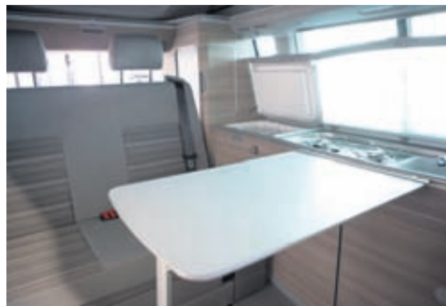
Húsbíllinn er með innbyggðum vaski, eldunaraðstöðu og ísskáp.