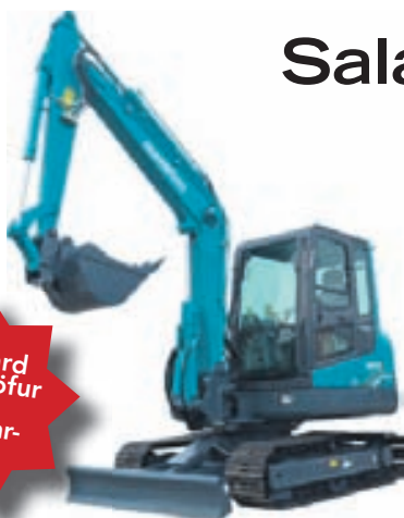
Sunward Beltagröfur á kyningarverði