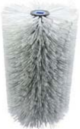
Allar tegundir og stærðir af burstum