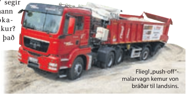
Fliegl „push-off“-malarvagn kemur von bráðar til landsins.

þessu fólki sem ég hef unnið fyrir í gegnum árin, hvort sem það hafa verið bændur, verktakar eða einstaklingar.“