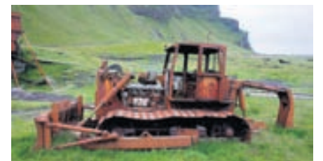
Á síðunni má finna skemmtilegar myndir af gömlum vinnuvélum.