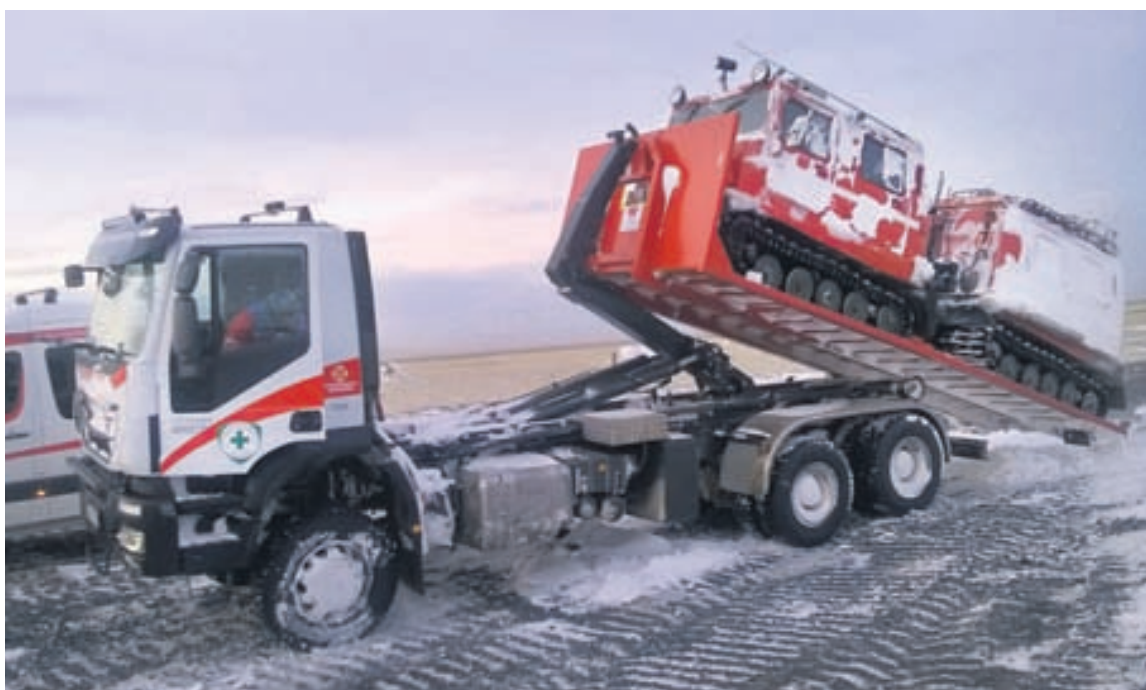
Bíllinn er með krókheisi sem þýðir að hægt er að hífa alls konar einingar upp á hann.