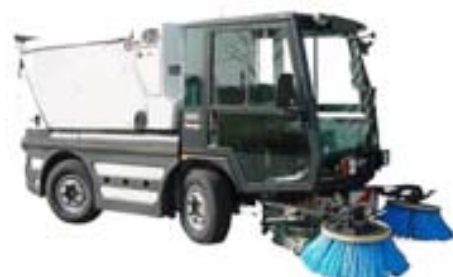
Schmidt sambyggðir sópar