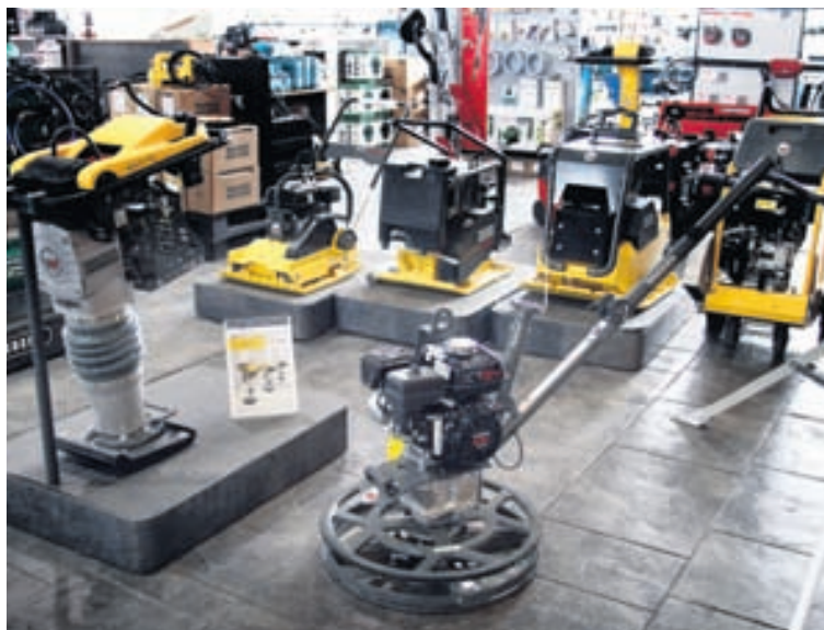
Úrval vinnuvéla í rúmgóðri verslun Þórs hf. að Krókhálsi 16.