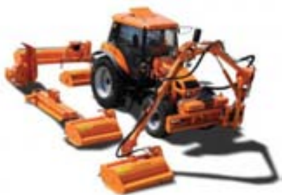
Sláttuvélar fyrir aflúrtak eða með armi