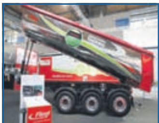
Fliegl Thermo í malbikið