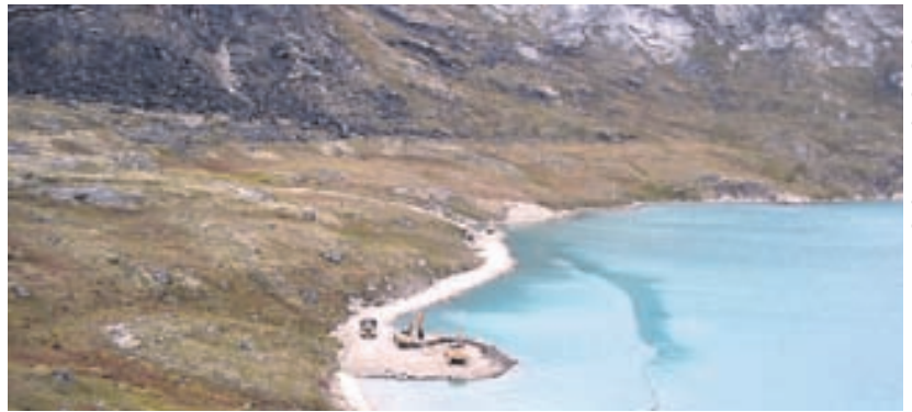
Einangrunin er víða mikil á Grænlandi og erfið að afla allra aðfanga. Hér eru starfsmenn Ístak að störfum í eyðifirði nærri Ilulissat.