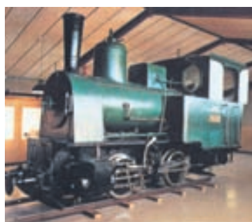
Saga jarnbrautarlesta á Íslandi er ekki löng. Árbæjarsafn geymir aðra af tveimur eimreiðum sem notaðar voru við gerð Reykjavíkurbæjar árið 1913-17.

„Árið 1917 voru lagðar undirstöður fyrir lestarteina á atvinnu-