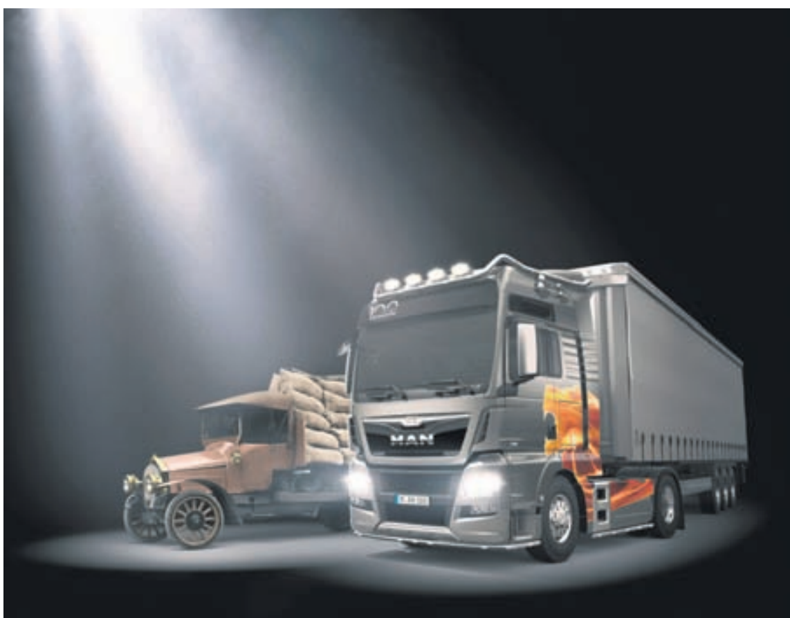
MAN hefur haft veruleg áhrif á þróun vörubíla og rúta með byltingarkenndum nýjungum sínum á undanföllum 100 árum.

Árið 2010 hóf MAN fjöldaframleiðslu á „Hybrid“-strætisvögnum, eða Lion's City Hybrid. Lion's