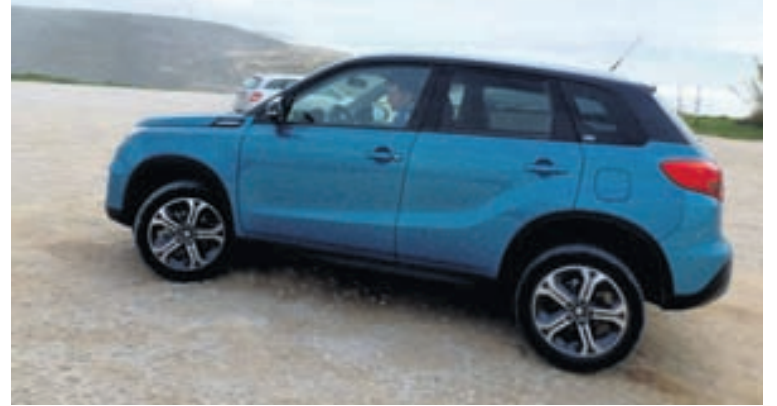
Suzuki Vitara tekinn til kostanna og spólað í hringi í Portugal.

Kaupendur Vitara hafa úr miklu að velja þegar kemur að innréttingu og litum bílsins. Hann býðst nú í fjórtán litum og velja má að hafa þak hans í öðrum lit og margar þannig fallegar útfærslur hans sáust í fríðum flokki þeirra bíla sem buðust til reynsluakstursins. Þá má fá bíllinn með litafötum í innréttingunni sem eru samlitir ytra byrði bílsins. Þannig verður hann mjög sportlegur og flottur. Velja má um ýmsar útfærslur innréttingarinnar og eftir því sem þær eru dýrari, þeim mun flottari og með fleiri tækninýjungum sem of langt mál er að fara í hér. Framsætin eru ferlega þægileg og gefa mikinn stuðning. Aftursætin teljast ekki í flokki lúxusbíla en vel fer um tvo fullorðna þar og eins þrjú börn, en millistokkur fyrir miðju er ekki til hægðarauka fyrir þriðja fullorðna farþegann. Skottrýmið er merkilega gott fyrir ekki stærri bíl og sýnir hve vel bíllinn er hannaður. Í innréttingunni er notað mikið af plasti og það ekki af dýrari gerðinni, en allt er vel smíðað og lítur mjög vel út og það góða við hana er að líklega mun hún líta jafn vel út eftir tíu ár en Suzuki er þekkt fyrir góða smíði sína og endingu. Suzuki Vitara mun bjóðast á verði frá 4.480.000 krónum og ekki getur það talist hátt verð fyrir heilmikinn bíl.