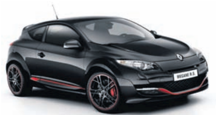
Renault Megane RS

Greinarritari fékk að reyna þennan kostagrip á dögnum og því lík hamingja. Þetta er algjör raketta sem límd er á veginn og þótt reynt hafi verið að fara svo hratt í beygjur að búist hafi verið við griplosi var því ekki til að dreifa og enn er velt fyrir sér hversu hratt sé hægt að fara á honum gegnum krappar beygjur og hringtorg áður en bílur er ofboðið. Þar ræður bara þor ökumannsins. Þessi bíll stendur nú í sýningarsal BL ef einhver heppinn kaupandi hefur ekki tryggt sér hann. Afl bílsins kemur frá aðeins 2,0 lítra vél en forþjappa og frábær vélartækni Renault, sem þekkt er úr Formúlu 1, nær öllu því afli sem sent er eingöngu til framhjóla bílsins. Með allt þetta afl er bíllinn eðlilega togstýrður og því er rétt að ökuþurfinn sé með báðar hendur á stýri þegar honum er gefið hressilega inn. Ef svo er gert úr kyrrstöðu spólar hann ógurlega og það