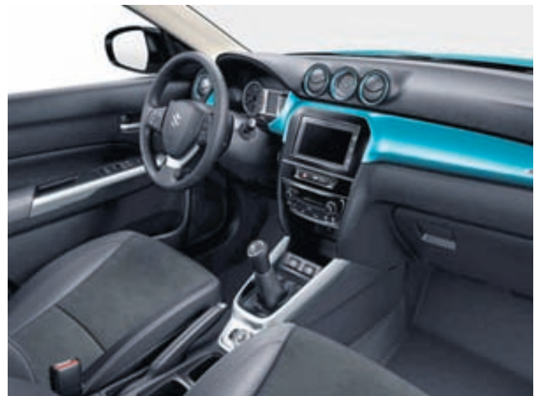
Lagleg en fremur látlus innrétting í Vitara og talsverð notkun á plasti.