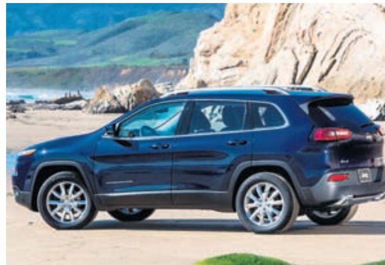
Jeep Cherokee og aðrir Jeep-bílar seljast mjög vel.

Ríflega helmingur hagnaðar Fiat Chrysler varð til í Bandaríkjunum á fyrri helmingi ársins og hann meira en tvöfaldadist á milli ára. Hagnaður af sölu náði nú 7,9% en var 4,9%