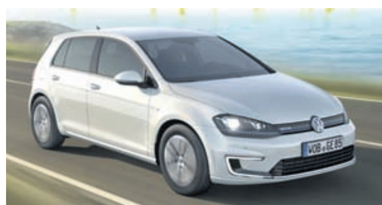
Volkswagen Golf GTE.

Frá Volkswagen eru þetta rafmagnsbílar E-up og E-Golf, Golf GTE sem er tvíorkubíll og notar rafmagn og brunavél og einnig Golf TGI og Golf Variant TGI sem nota metan og bensín. Frá Audi kemur A3 e-tron rafmagnsbíllinn, A3 g-tron sem gengur fyrir metani og bensíni og svo er að koma Q7 e-tron sem gengur fyrir rafmagni og dísilolíu. Frá Mitsubishi koma svo i-MiEV rafmagnsbíllinn og Outlander PHEV sem gengur fyrir rafmagni og bensíni. Fyrir skömmu greindi forstjóri Volkswagen frá því að fyrirtækið býði nú mesta úrval rafmagnsbíla nokkurs bílaframleiðanda og ekki tók það þetta stóra og sveigjanlega fyrirtæki langan tíma að komast í þá stöðu. Undir Volkswagen-fjölskylduna heyrja einnig