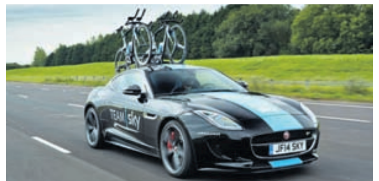
Aldreí fyrr hafa sést Jaguar-bílar til aðstoðar í Tour de France.

„Þetta er mikið umfang, liðið var með sex Jaguar-bíla af mismunandi gerðum, m.a. F-Pace sem kemur ekki á markað fyrir en seint í haust og svo Land Rover Discovery jeppa. Þeir fylgdu liðinu eftir og sáu keppendum fyrir hjólum til skiptanna. Svo var svefnrúta með í för, eld-