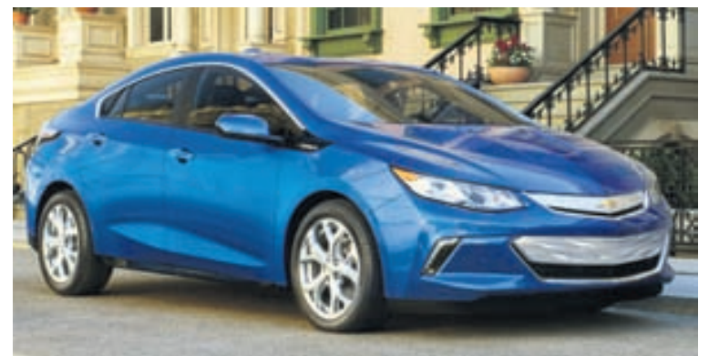
Ný kynslóð Chevrolet Volt á að komast 85 km á hverri hleðslu.

S tutt er í að Chevrolet kynni nýja kynslóð tvíorkubílsins Volt og hann á að komast 85 kílómetra á rafmagninu eingöngu, eða 40% lengra en fyrri gerð. Eftir að rafmagnið klárast á Volt fer eins konar ljósavél í gang sem brennir bensíni og framleiðir rafmagn og gengur hann því alltaf á rafmagn. Uppgefin eyðsla bílsins er 2,2 lítrar á hverja 100 kílómetra. Eins og með marga aðra tvíorkubíla komast eigendur þeirra svo til allra sinna ferða á rafmagninu eingöngu og með nýrri og langdrægari gerð bílsins ættu þeir að hræðast minna að aka á bensíni. Í tilviki Volt er svo til ekkert að hræðast því ef rafmagnið klárast tekur ljósavélin við og því er enginn munur á honum og hefðbundnum bíl og drægnin svipuð og í venjulegum bílum. Annað á við í tilfelli hreinna raforkubíla, en þegar