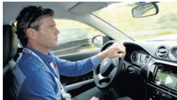
Vitara stóð sig frábærlega sem fyrir við erfiðar aðstæður í reynsluakstrinum.

Vegna lítillar þyngdar hefur Vitara ávallt verið fremur eyðslugrannur bíll og það telst fátítt að jeppi eyði jafnlitlu og 4,0 lítrum eins og