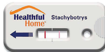
Niðurstöður á IAQ-myglusveppaprófi. Ein lína þýðir neikvætt svar, tvær línur jákvætt.

urnar á því að raki þéttist innan húss er alltaf gott að hafa rifu á gluggum þó vetur sé fram-