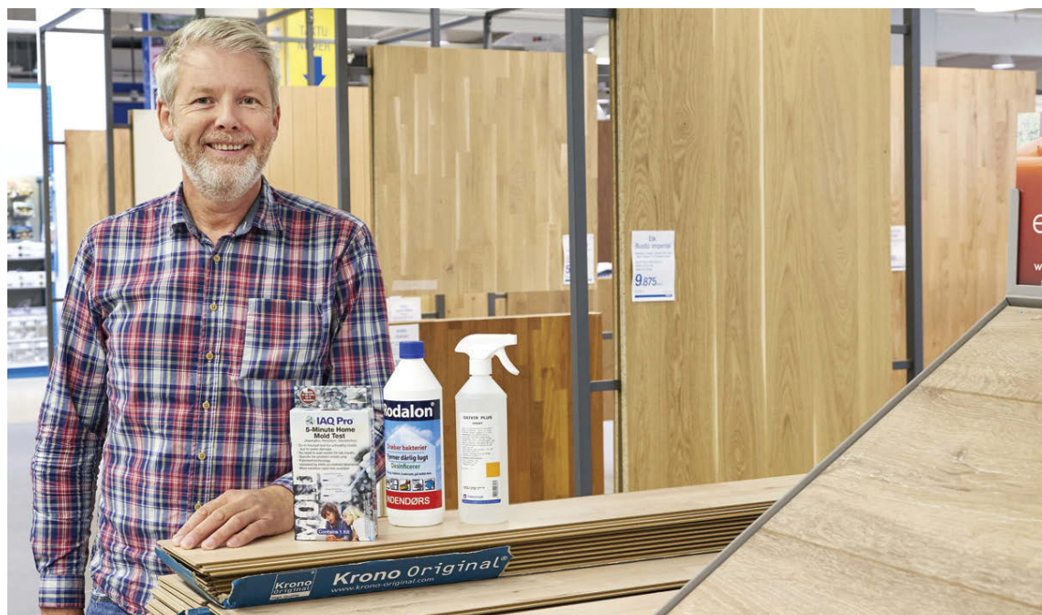
Örn segir ýmislegt hægt að gera til að sporna við raka- og myglumyndun í húsum. En ef komið er í óefni býður BYKO upp á ýmsar lausnir.

Þó ýmsar leiðir séu færar til að losna við myglu er mun farsæla að koma í veg fyrir að hún myndist. „Til að minnka lík-