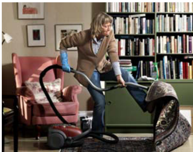
Vissa tækni þarf til að ryksuga mottu.