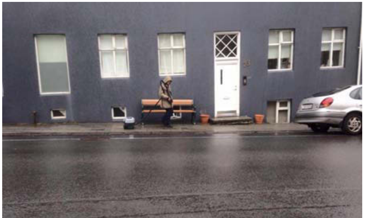
Fyrsta ryksugumyndin var tekin á Bergþórugötu á drungalegum rigningardegi í apríl fyrr á árinu.

Hann segir ólíklegt að lattésugurnar viti af myndatökum hans. „Ég verð því að biðja þær fyrirfram afsökunar á myndbirtingunum. Myndirnar eru oftast illa teknar og með lélegum instagrafilter. En það skiptir ekki öllu, aðalmálið er ryksugan sjálf. Ég mun halda þessu áfram í haust en á nú frekar von á að þeim fækki þegar vetur skellur á með tilheyrandi snjó og kulda.“