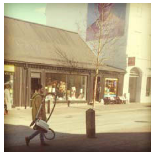
Hippster viðrar ryksuguna sína á fallegum sumardeg.