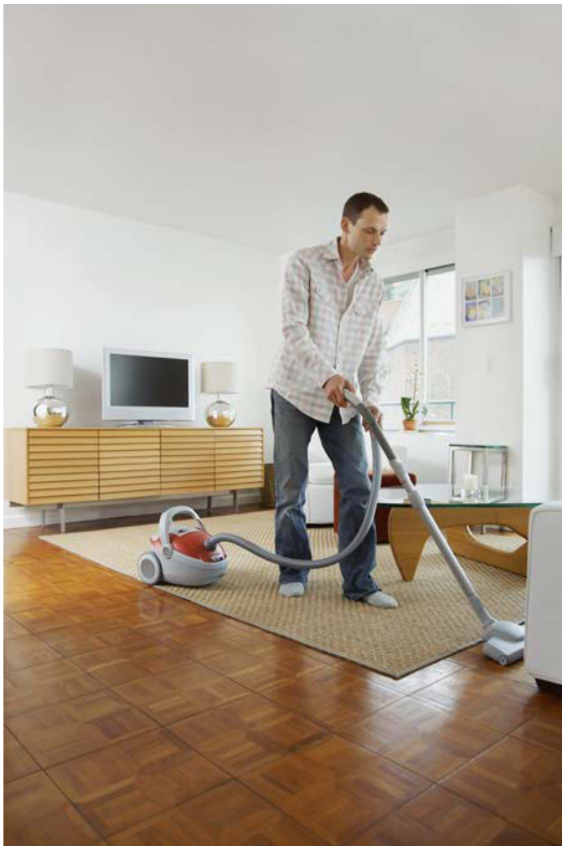
Parket rispast auðveldlega. Því þarf að vera vel vakandi fyrir því að hjólin á ryksugunni séu í lagi.