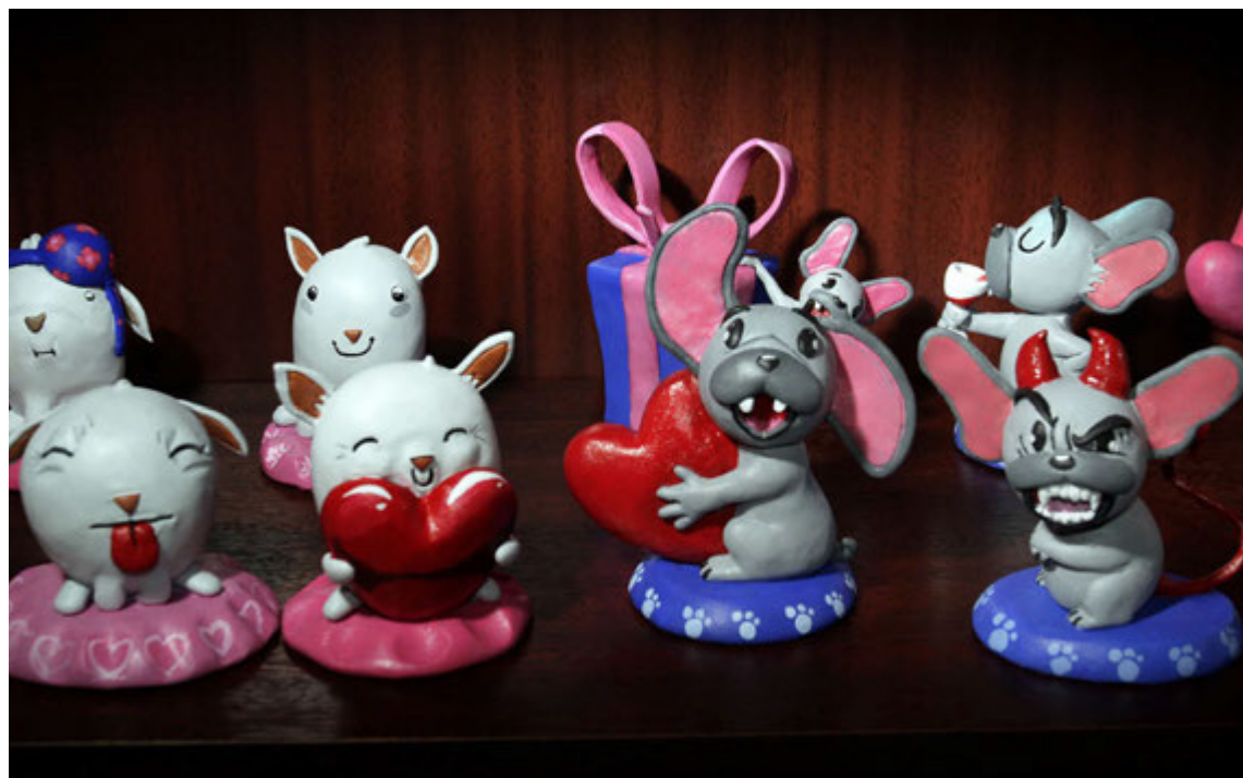
Teiknimynda- og myndasögufígúror eru sérsvið Fannars og koma í mörgum útfærslum.