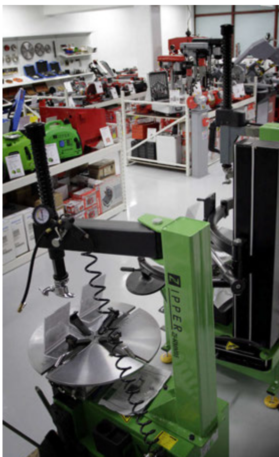
Nánari upplýsingar má finna á www.idnvelar.is .

Þeir sem þurfa að kaupa jólagjafir fyrir starfsfólk fyrirtækja, laghenta vini, ættingja eða bara sjálfa sig ættu að leggja leið sína á Smiðjuveginn eða á vefsíðuna www.idnvelar.is þar sem meðal annars er hægt að skoða jólagjafabækling Iðnvéla.