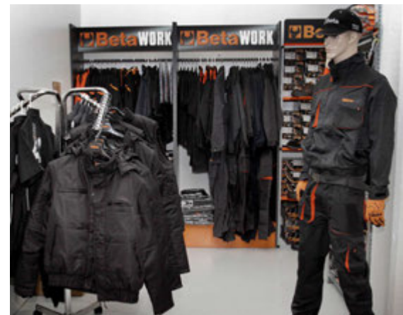
Beta framleiðir ekki eingöngu verkfæri, eins og sjá má í verslun Iðnvéla, því vinnufatnaður og -skór eru áberandi líka.