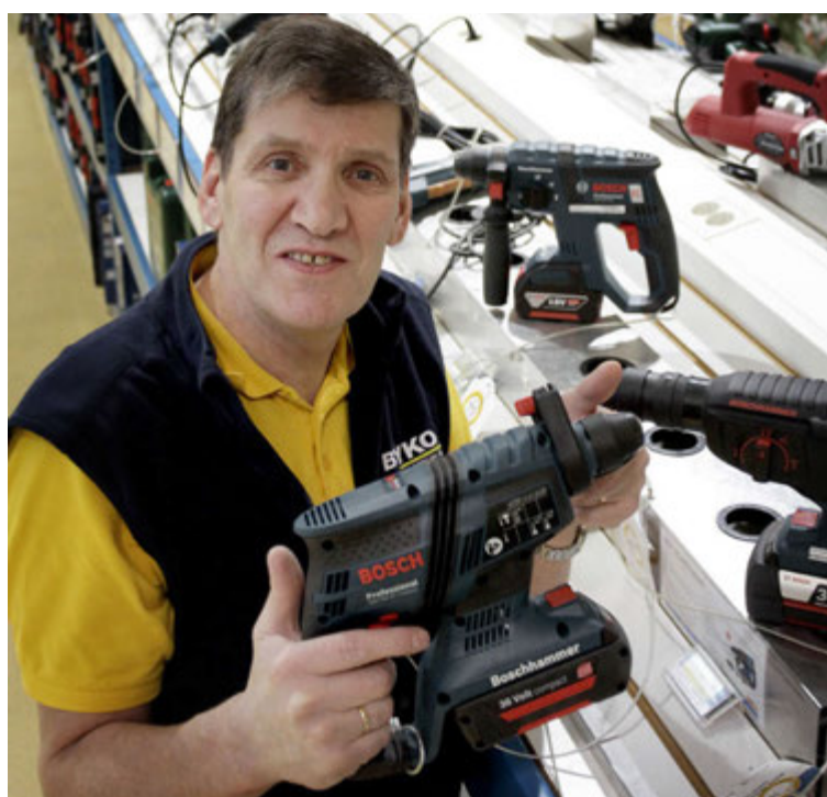
BYKO leggur mikla áherslu á gæðaverkfæri frá Bosch.