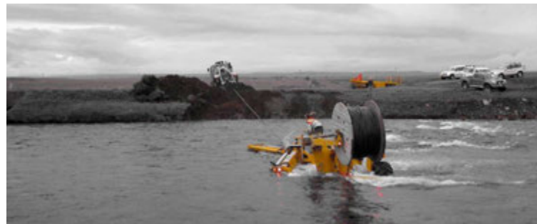
Köngulóin fer yfir Brúará og plægir í móbergsbotn. Verkefnið var unnið fyrir RARIK en engir aðrir plógar eða vinnuvélar gátu unnið verkið.

Ingileifur segir helsta kost plógsins vera þann að jarðrask eftir hann sé lítið. Því henti hann til dæmis mjög vel þegar fara þurfi yfir viðkvæmt land. „Það er alltaf gott að nota umhverfisvænar vinnuaðferðir þegar verið er að leggja hvort heldur sem er ljósleiðara eða háspennustrengi í jörðu,“ segir hann. solveig@365.is