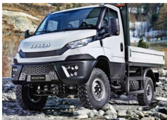
Iveco Daily 4x4. Þetta er frábær verktakabíll.