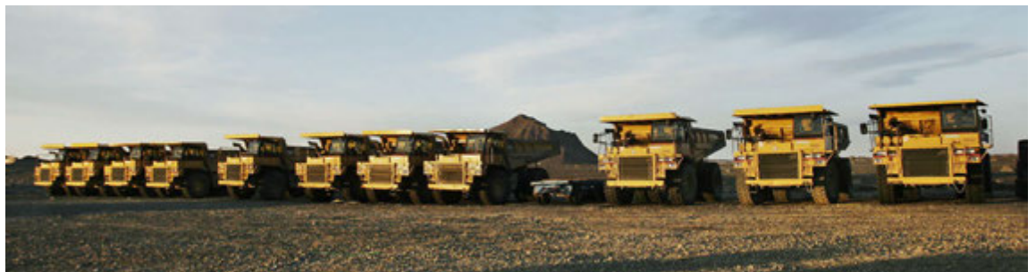
Mikill fjöldi stórvirkra vinnuvéla var á staðnum.