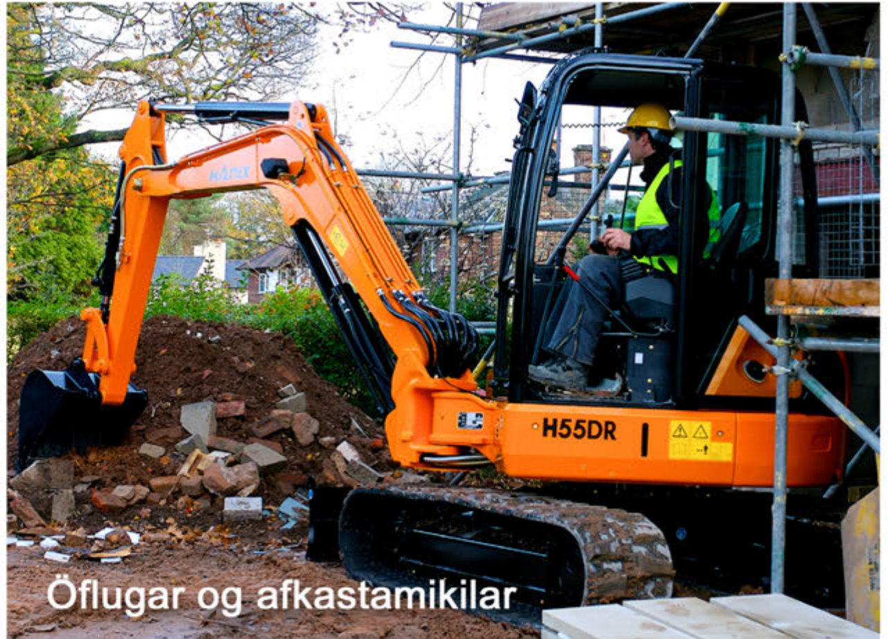
Öflugar og afkastamikilar