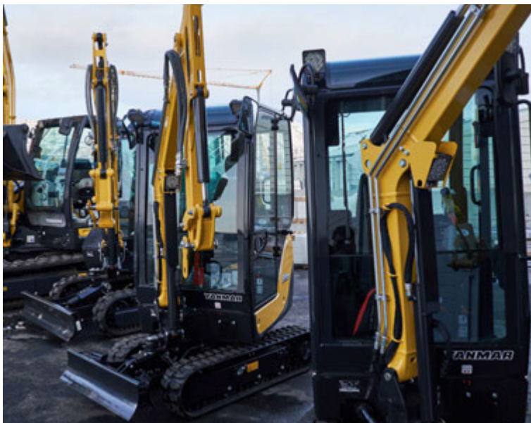
Langflestar smágröfur sem seldar voru á Íslandi í fyrra voru af gerðinni Yanmar.

„Framleiðslulína Yanmar samanstendur af sautján gerðum af smágröfum, átta gerðum af beltavögnum og tveimur gerðum af hjóla-skóflum en auk þess framleiða þeir einnig ljósamöstur,“ segir Kristófer. Vinsælasta smágrafan hjá Merkúr