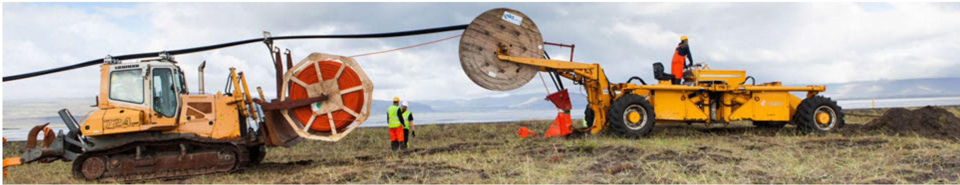
Á þessari mynd sést hvernig allir strengirnir renna yfir jarðýtuna í jöfnu átaki og ofan í rennuna aftan á köngulóinni en fjarskiptarörið er þarna framan á ýtunni og fer sömu leið og strengirnir.