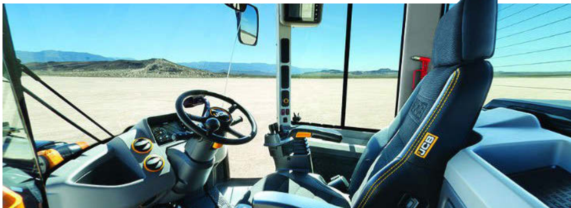
Hjólaskóflur frá JCB sem eru 10 tonn eða stærri koma nú gjörbreyttar með stórglæsilegu húsi og frábæru vinnuumhverfi fyrir stjórnandann.