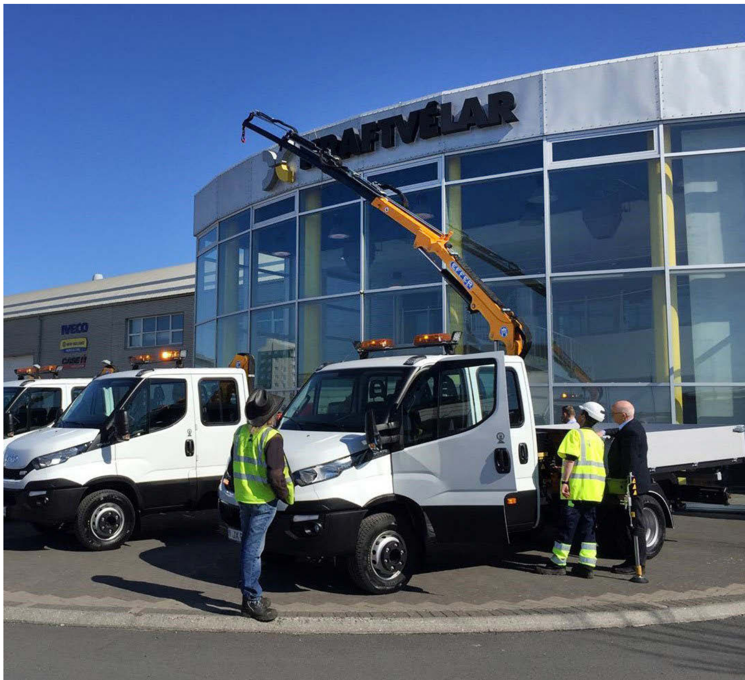
Iveco flokkabíll frá Kraftvélum. Þetta eru mjög hentugir bílar fyrir vinnuflokka, þeir eru sjö manna og fánlegir í öllum lengdum og gerðum.