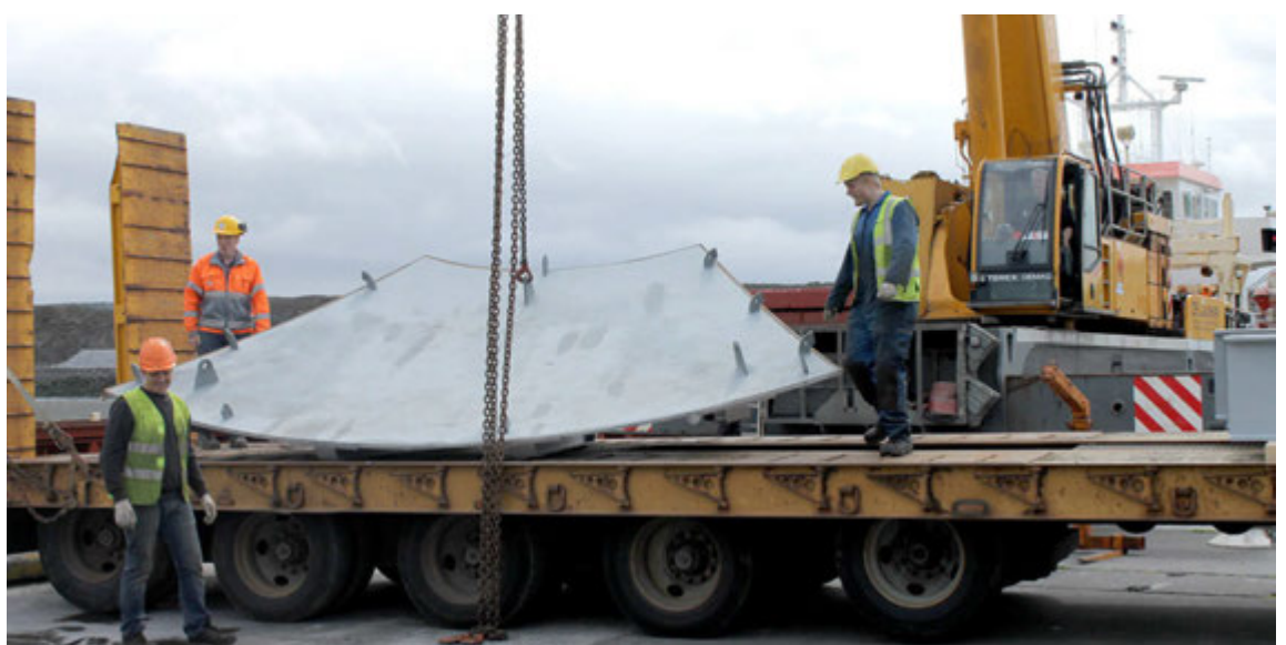
Flest tækin sem nýtt voru við framkvæmdina fóru úr landi eftir að henni lauk.