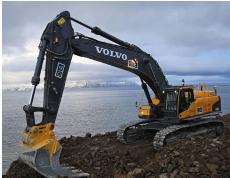
Volvo EC700C L beltgröfa afhent LNS Saga.