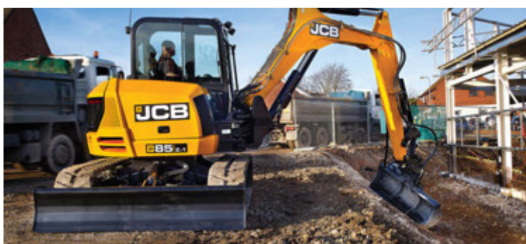
Nýjar mini/midi gröfur koma endurhannaðar frá grunni, eru til dæmis með vökvaskökkjanlegum tönnum, mun rýmra húsi, nýjum dísilvélum úr samstarfi JCB og Kohler í Austurríki.