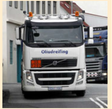
Umferð oliubíla frá Örfirisey um Granda er mikil.