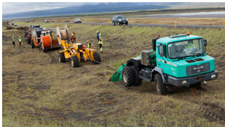
Þarna er unnið við verkið „Selfosslínu 3“ síðastliðið sumar. Þarna má sjá hvar spilbillinn dregur köngulóna en hún dregur alla strengina og fjarskiptarörið ásamt viðvörunarborðum niður í jörð. Aftan við hana er jarðýta sem dregur þrjá keflavagna sem hver um sig ber kefli með einleiðarastreng en hvert kefli vegur um 8-8,5 tonn.