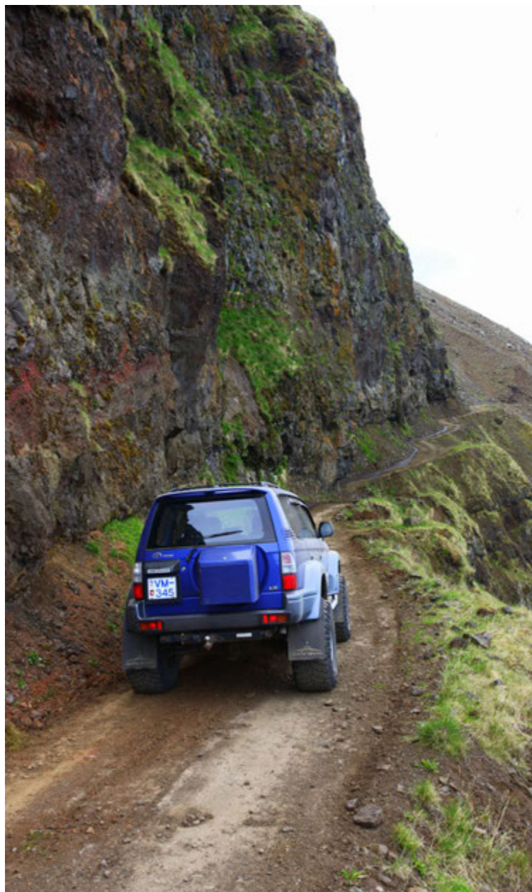
Leiðin er ansi hrikaleg á köflum þar sem feðgarnir nöguðu sig áfram á Teskeiðinni.

„Kallinn var uppi á fjallsbrúnni að jafna fyrir slóða, hafði farið of langt og gat ekki bakkað upp aftur. Þá var ekki annað að gera en fara áfram, rúmlega 60 gráðu halla niður kletta og skriðu. Hann sagði að það hefði aðeins farið um hann þegar dótið aftur í ýtunni fór út um framrúðuna. En niður komst hann.“ heida@365.is