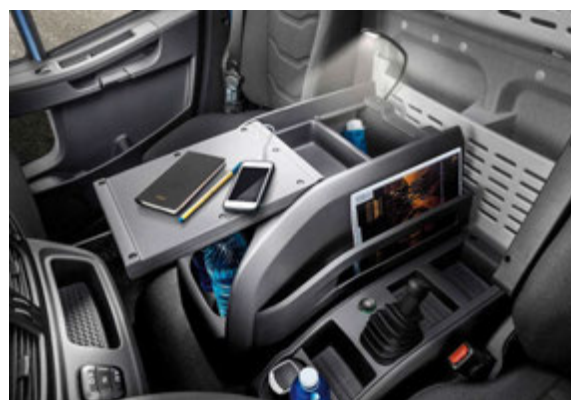
Iveco Eurocargo að innan. Mikil þægindi fyrir bílstjóran.

„Bíllinn er einstaklega lipur í akstri og með þéttan beygjuhring. Síðan er hægt að sérútbúa bílinn hvað varðar lengd og fleira eftir þörfum viðskiptavinarins.“