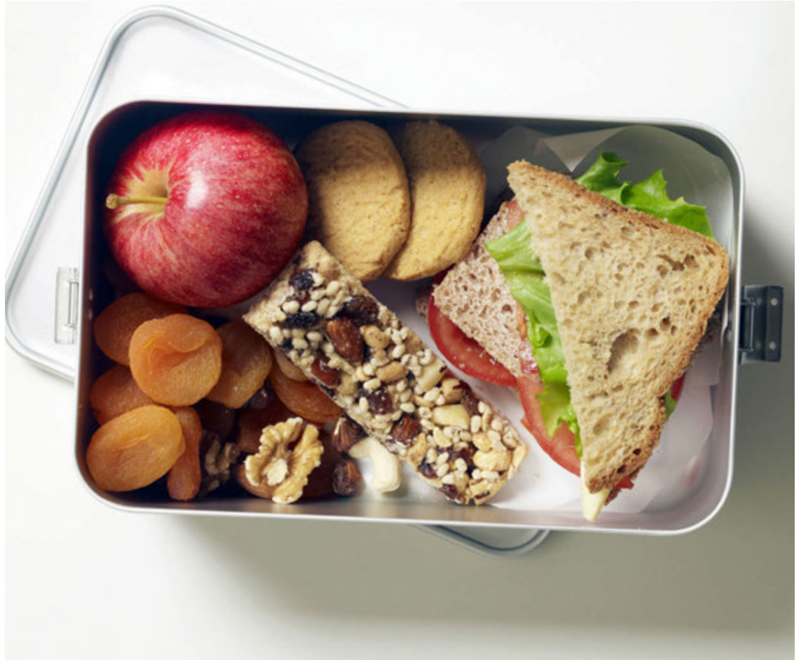
Þetta er ekki dónalegt nesti. Það er uppfyllt af orku og næringu.

Sérta með afgang frá kvöldinu áður er upplagt að vefja honum inn í tortillakökur en þær fara vel í hendi á ferðinni.