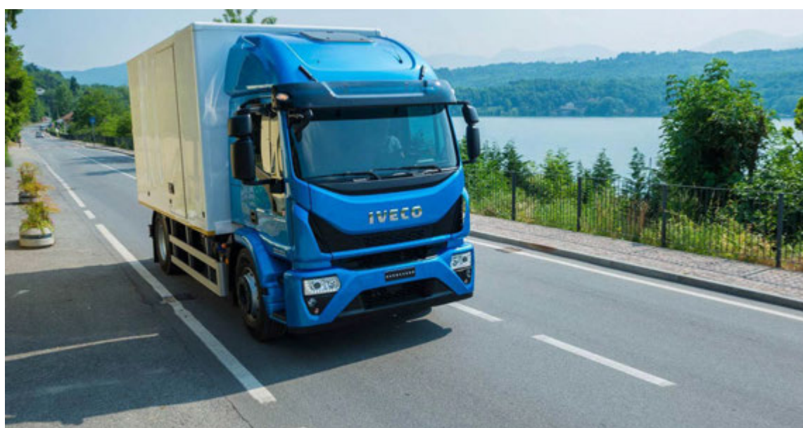
Iveco Eurocargo. Þessi bíll hefur nýan mótora með allt að 10% eldsneytissparnaði miðað við eldri gerðir.