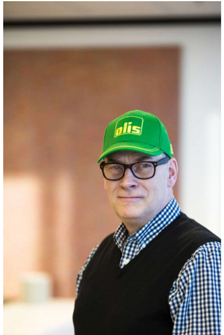
Að sögn Kjartans stóla stór og smá fyrirtæki um allan heim á Trojan rafgeyma.