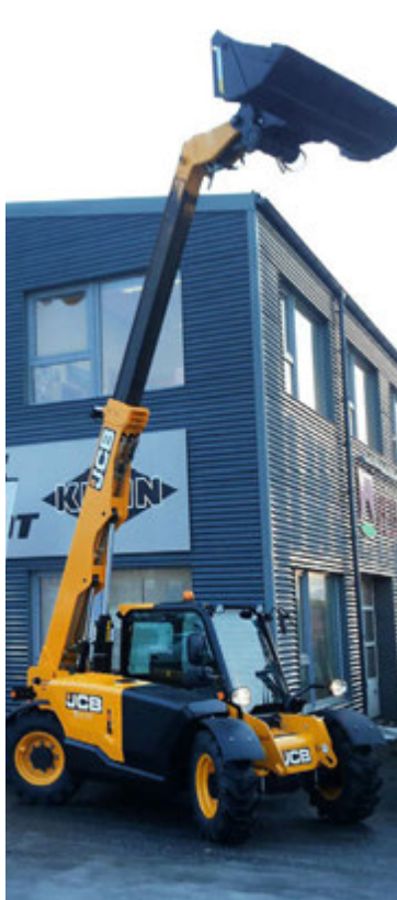
Vélfang kynnrir nýjan skotbómulyftara til leiks á þessu ári. Hér er um að ræða smáan en knáan lyftara sem er bara rúmlega 1,8 metrar á hæð og breidd og fer auðveldlega inn í gáma og getur lyft 2,5 tonnum í 6 metra hæð. Hann nær 40 kílómetra ökuhraða og er með fjaðrandi lyftigálga.

Vélfang hefur jafnt og þétt byggt upp tengslanet við eigendur og rekstraraðila JCB véla um allt land og átt góðu samstarfi að fagna við nýja og eldri eigendur þessara véla.