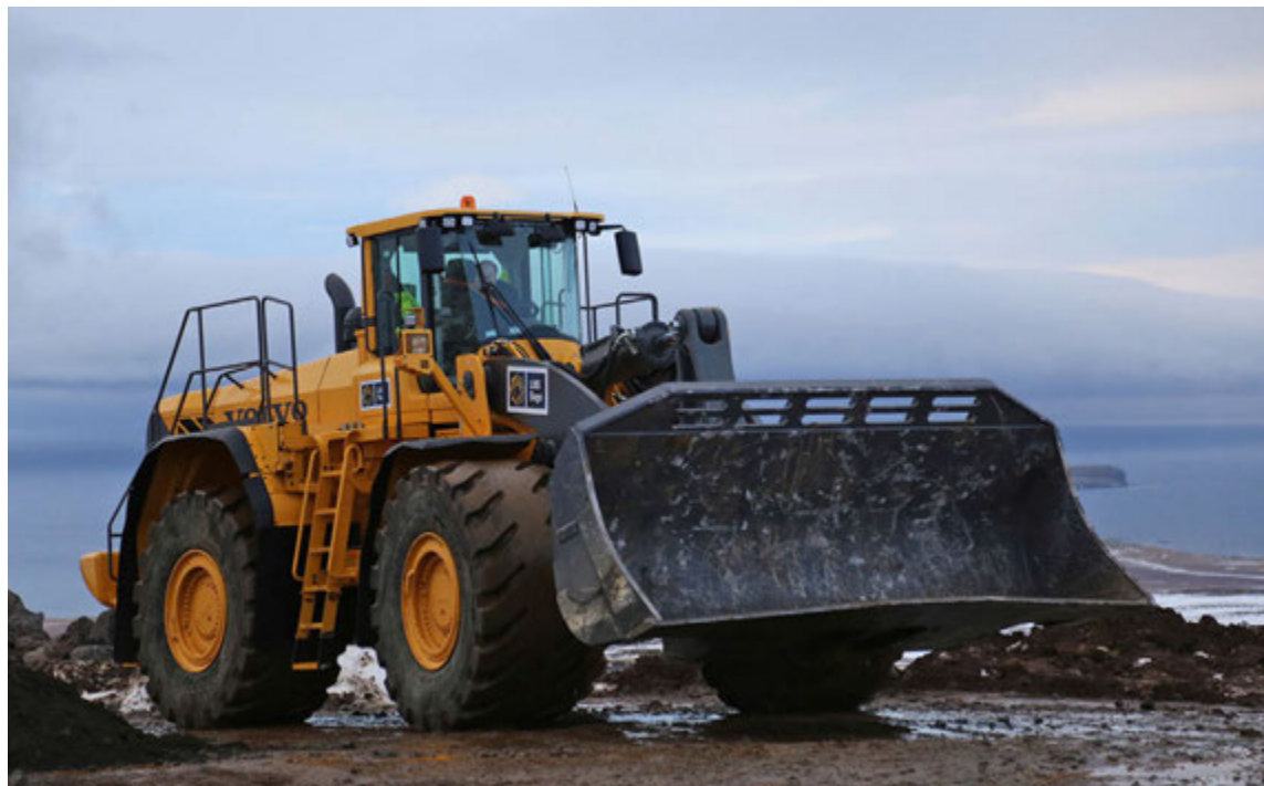
Volvo L350F hjólaskófla afhent LNS Saga.