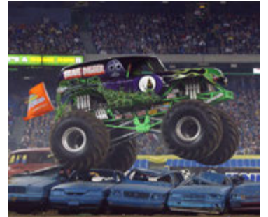
Grave Digger var smíðaður 1981.

ARGO.IS sími 8610000 Til sýnis og sölu að Sólbakka 2 Borgarnesi