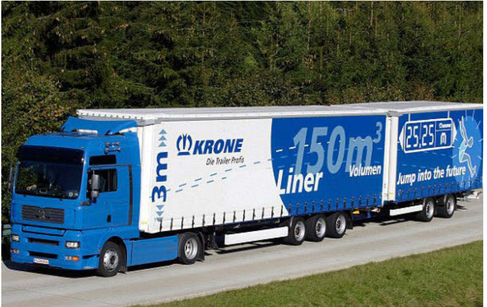
Stórir og langir flutningabílar geta skapa mikla hættu á hraðbrautum í Evrópu.

Afar misjafnar reglur eru á milli landa í Evrópu um hve þungir flutningabílar mega vera og hve langir. Í lok síðasta árs gáfu spænsk yfirvöld leyfi fyrir heildarvigt allt að 60 tonnum á sínum vegum og að lengd þeirra megi vera allt að 25 metrum. Þessi aukna heimild á þó ekki við alla vegi á Spáni þar sem þeir eru misjafnlega útfærðir til að þola svo þunga bíla. Í Hollandi var þessi heimild einnig aukin fyrir nokkrum árum úr 50 tonnum í 60. Í Finnlandi er leyfi fyrir 76 tonna heildarþyngd og hefur verið svo frá árinu 2013 og í Svíþjóð er leyfi fyrir 90 tonna þunga í tilraunaskyni. Það er eitt land í Evrópu sem sker sig nokkuð úr í reglum um þyngd flutningabíla, Þýskaland, en þar er hvergi heimild fyrir þyngri bíla en 40 tonn. Þar í landi segja yfirvöld að heimild fyrir þyngri flutningabílum myndi krefjast mikils kostnaðar hins opinbera til að byggja vegi, brýr, veggöng og varnarveggi vegna árekstra myndi kosta milljarða evra og sá kostnaður myndi falla á almenning sem ekki er til í slíkan kostnað auk þess sem svo stórir og langir flutningabílar skapi mikla hættu á þýskum vegum. Það er ef til vill skiljanlegt að reglurnar séu fremur strangar í Þýskalandi þar sem ógrynni flutningabíla frá öðrum löndum Evrópu fer í gegnum landið og eru þeir í alltof mörgum tilfellum ekki að þjóna þýskum neytendum heldur nota bara vegi þeirra án greiðslu fyrir notkun.