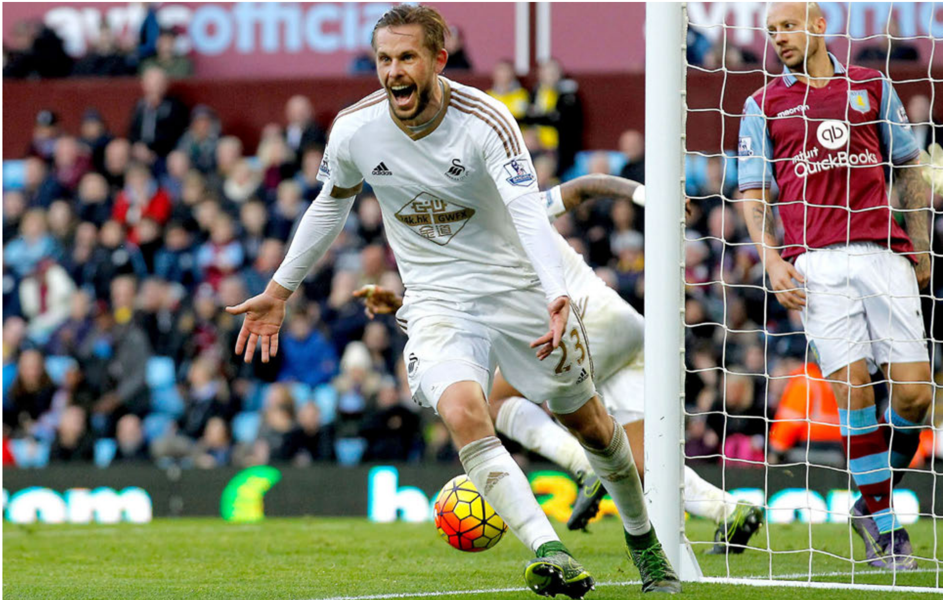
Gylfi Þór Sigurðsson fagnar einu af fimm mörkum sínum í ensku úrvalsdeildinni á tímabilinu. Hann er þriðji markahæsti leikmaður Swansea í úrvalsdeildinni frá upphafi.