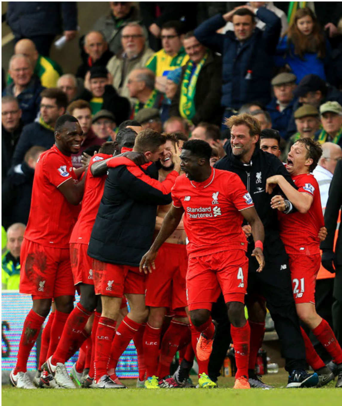
Jürgen Klopp fagnaði af mikilli innlifun með leikmönnum Liverpool eftir að Adam Lallana skoraði sigurmark liðsins í 4-5 sigri á Norwich í uppþóttartíma. Gleraugun hans Klopps brotnuðu í fagnaðarlátunum.