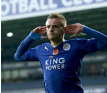
16 mörk hjá Vardy.