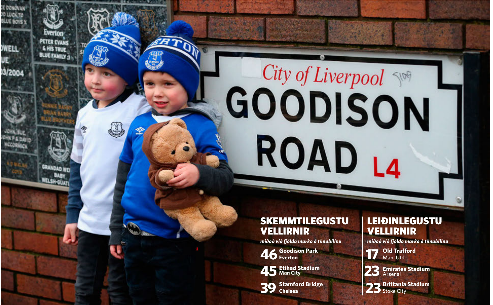
Þessir ungu stuðningsmenn Everton hafa séð nóg af mörkum á Goodison Park í vetur. Alls hafa 46 mörk verið skoruð í Guttagarði á tímabilinu.