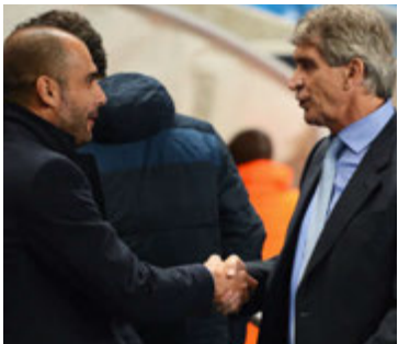
Til hamingju með nýja starfið.

Harry Kane hjá Tottenham og Leicester-maðurinn Riyad Mahrez koma næstir en þeir hafa báðir skorað 13 mörk. Sergio Agüero, markakóngur síðasta tímabils, er í 6.-7. sæti markalistans ásamt Olivier Giroud, framherja Arsenal, en þeir hafa skorað 12 mörk hvor.