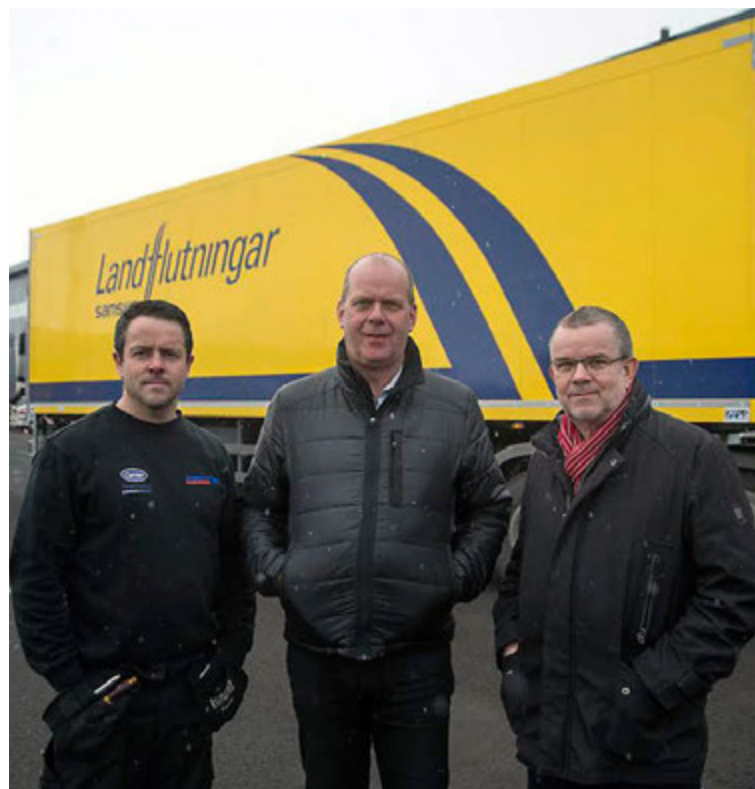
Vagnarnir góðu afhentir.

Miðhraun 2 | 210 Garðabær | Sími 587 1300 | optimar@optimar.is | www.optimar.is