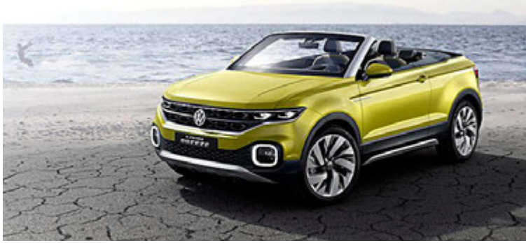
VW T-Cross mun komast 800 km á tankfylli.