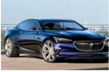
Buick Avista er augnakonfekt.