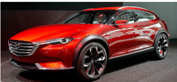
Mazda Koeru tilraunabíllinn verður fyrirmynd Mazda CX-4.

að sala bíla í Bandaríkjunum gæti haft úrslitaáhrif á framtíð fyrirtækisins, góður árangur þar gæti fært því nýtt líf en fjarvera á þeim markaði gæti riðið fyrirtækinu að fullu. Ssangyong er nú í eigu bílaframleiðandans Mahindra á Indlandi og bjargaði Mahindra Ssangyong frá gjaldþroti árið 2011 með kaupum á félaginu. Forstjóri Mahindra hefur ekki úttalað sig um áhugann á Bandaríkjamarkaði og fremur talað um Kína sem lykilmarkað, en þar hefur þó hægst mjög á bílasölu á meðan vöxturinn hefur verið mikill í Bandaríkjunum.