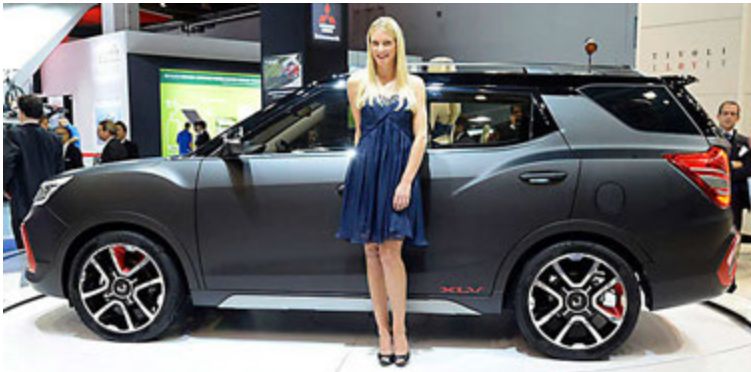
Ssangyong XLV á bílasýningu.

Lítil 1,0 lítra forþjöppudrifin bensínvél er í bílnum, 110 hestöfl með 175 Nm tog. Sjö gíra sjálfskipting er tengd við vélina og er hún með tveimur kúplingum. Bíllinn eyðir 5 lítrum og mengunin er 115 g/km. Með 40 lítra eldsneytistanki er hægt að aka T-Cross 800 kílómetra á tankfylli. T-Cross vegur aðeins 1.250 kíló, er 10,3 sekúndur í 100 og með hámarkshraðann 188 km/klst. Volkswagen ætlar einnig að koma með jeppling á markað sem verður í sama stærðarflokki og VW Golf og verða þá smáir jeppingar fyrirtækisins orðnir þrír. Verður sá bíll byggður á hugmyndabílnum T-Roc concept.