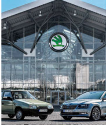
Mikil breyting á 25 árum.