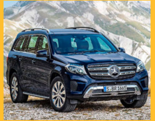
Maybach-jeppi yrði smíðaður upp úr Benz GLS.

stór stökk síðan Mercedes Benz kynnti M-jeppa sína til leiks árið 1997 og hefur sala jeppa aldrei verið meiri í heiminum en nú. Greinilega er þörf á að bjóða afar vandaða og dýra jeppa því kaupendur þeirra má finna víða og eru móttökur Bentayga-jeppans frá Bentley skýrt dæmi um það. Líklega verður lúxusjeppi Benz sem bærir Maybach-merkið smíðaður uppúr GLS-jeppa Mercedes Benz. BMW er einnig með X7 jeppa á teikniborðinu og verður hann bæði stærri og meiri lúxusbíll en X5 jeppinn og mun kosta minnst 100.000 dollara.