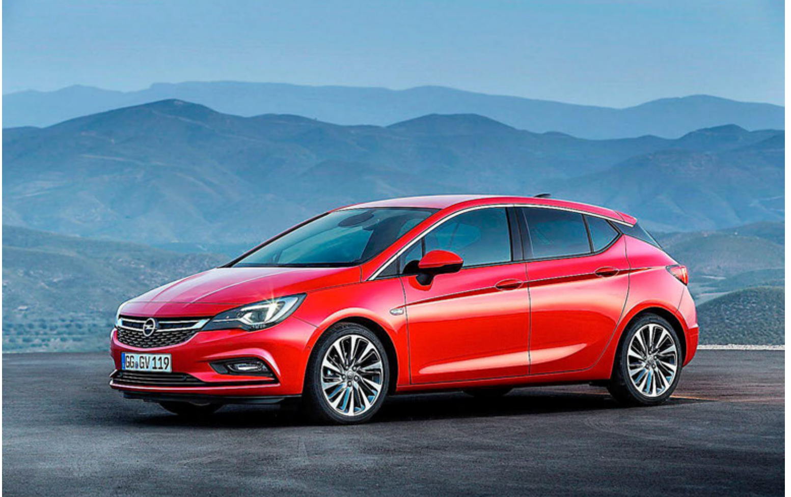
Áttunda kynslóð Opel Astra verður kynnt í mánuðinum.

Rekstur Skoda bjó til 4,5% af þjóðartekjum Tékklands árið 2014 og stóð fyrir 8% útflutnings- tekna landsins. Það hefur aðeins vaxið síðan. Skoda-merkið hefur á þessum tíma breyst úr því að vera staðbundið bílamerki sem þjónaði aðeins heimamarkaði og nálægum löndum í það að vera alþjóðlegt bílamerki sem selt er á flestum stærri mörkuðum. Skoda-bílar hafa þó aldrei verið seldir í Bandaríkjunum. Rekstur Skoda er mjög arðbær og skilar móðurfélaginu Volkswagen ávallt fínum hagnaði.