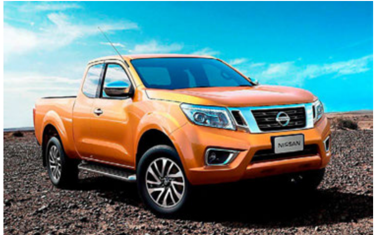
Nissan Navara hefur ekki verið í boði héraðs um nokkurt skeið.

Þetta ætlar Ford einmitt að gera með fimm bílgerðir sínar, en hefur ekki látið uppi hvaða gerðir það eru. Þetta telur Ford vænlegra en að smíða nýja jepplinga. Helsta ástæðan er líklega sú að það sparar mikið í þróunarkostnaði. Aðeins þarf með þessu að útfæra fyrri bíla fyrirtækisins á örlítið annan og grófari hátt og koma þeim fyrir vikið fyrir á markað. Líklegt er að Ford Mondeo og Focus muni fá svona meðferð. Þó það hafi ekki farið hátt þá gerði Ford-verksmiðja í Hollandi einmitt svona breytingu á 300 bílum af langbaksgerð Ford Focus árið 2009 og kallaði hann „X Road“.