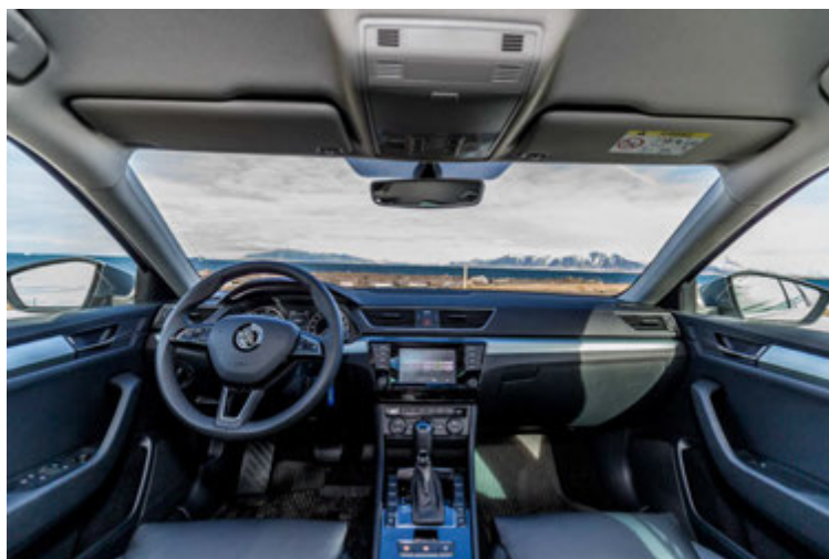
Stílhrein en tiltölulega látláus innrétting.

og ekki veitir af á okkar blautlandi. Velja má á milli þriggja útfærslna í innréttingunni, Active er þeirra ódýrust, þá Ambition og dýrust er Style, en staðalbúnað-