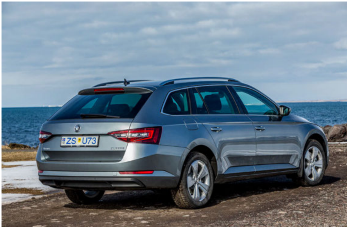
Skoda Superb er mjög stór fjölskyldubíll með mikið farangursrými.

opna afturhlerann. Samt er fótarymi aftursætisfarþega yfrið og sá íverustaður með allra besta móti. Þessi stóri bíll stækkaði nefnilega um 3 cm og breikkaði um 5 cm á milli kynslóða og inn-anrýmið stækkaði enn meira hlutfallslega.