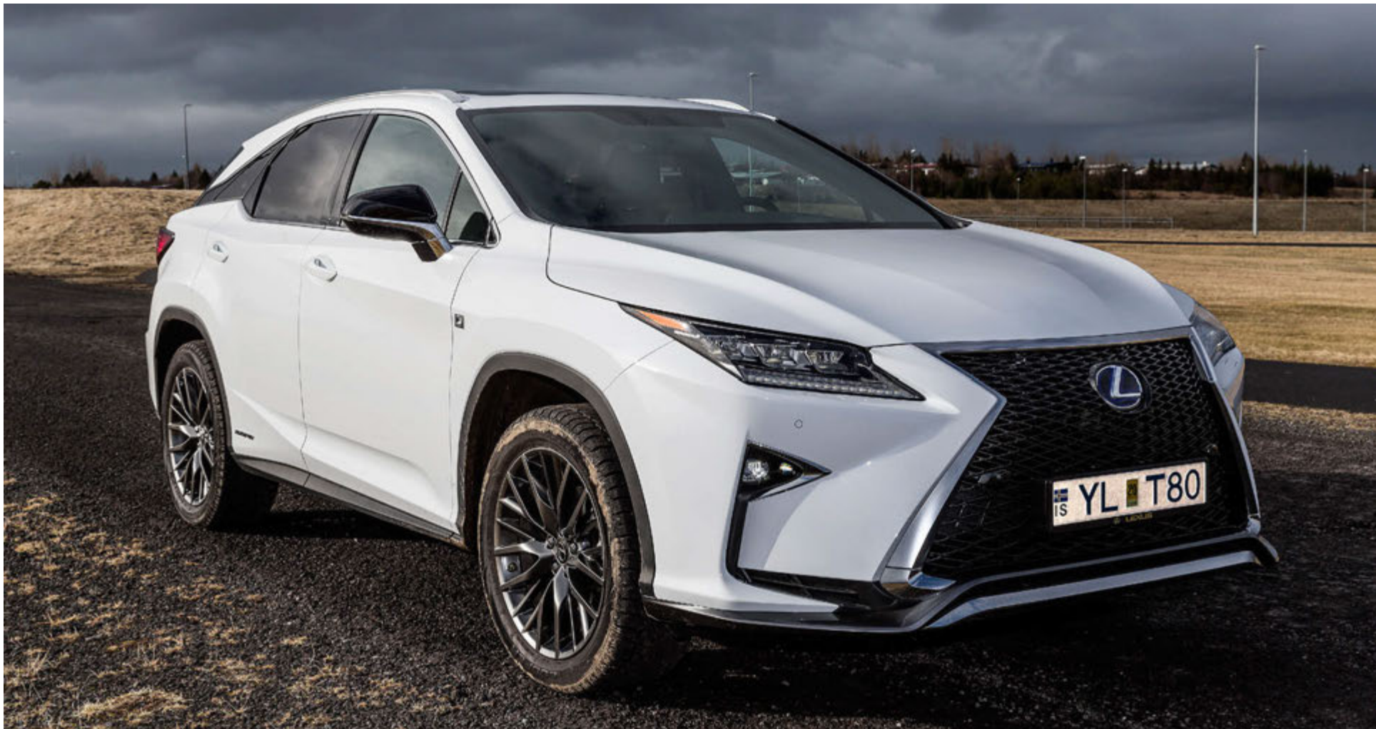
Lexus RX450h er kominn með einkar svipsterkar og hvassar línur.