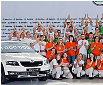
Skoda Octavia nr. 1.000.000.

Bandaríkjamönnum er mjög lagið að framleiða ljóta bíla, en stundum kemur þó fyrir að fallegir tilraunabílar líta dagsins ljós þar í landi, en þá er um að gera að framleiða þá ekki. Gott dæmi um það er þessi gullfallegi Buick Avista sportbíll, en Buick hefur látið uppi að engar áætlanir séu uppi um framleiðslu hans og að hann gefi ekki heldur tóninn fyrir framtíðarútlit Buick-bíla. Þessi bíll var sýndur á síðustu bílasýningu í Detroit og þar var hann sannarlega senuþjófur, enda ótrúlega laglegur bíll þar á ferð frá bandarískum bílaframleiðanda. Aðstoðarforstjóri Buick sagði nýlega að þessi Buick Avista hefði eingöngu verið smíðaður til að grípa stundarathygli og að Buick Avenir bíllinn væri sá bíll sem gæfi tóninn fyrir framtíðarútlit Buick-bíla. Þar fer svo sem ekki ljótur bíll en samt langt frá því að vera eins fallegur og Avista. Næsti LaCrosse-bíll Buick mun fá framendann frá Avenir og fleiri línur og fleiri bílar Buick munu erfa útlit hans.