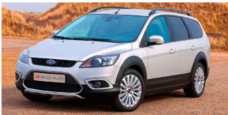
Ford Focus X Road var framleiddur í 300 eintökum og ekki söguna meir.