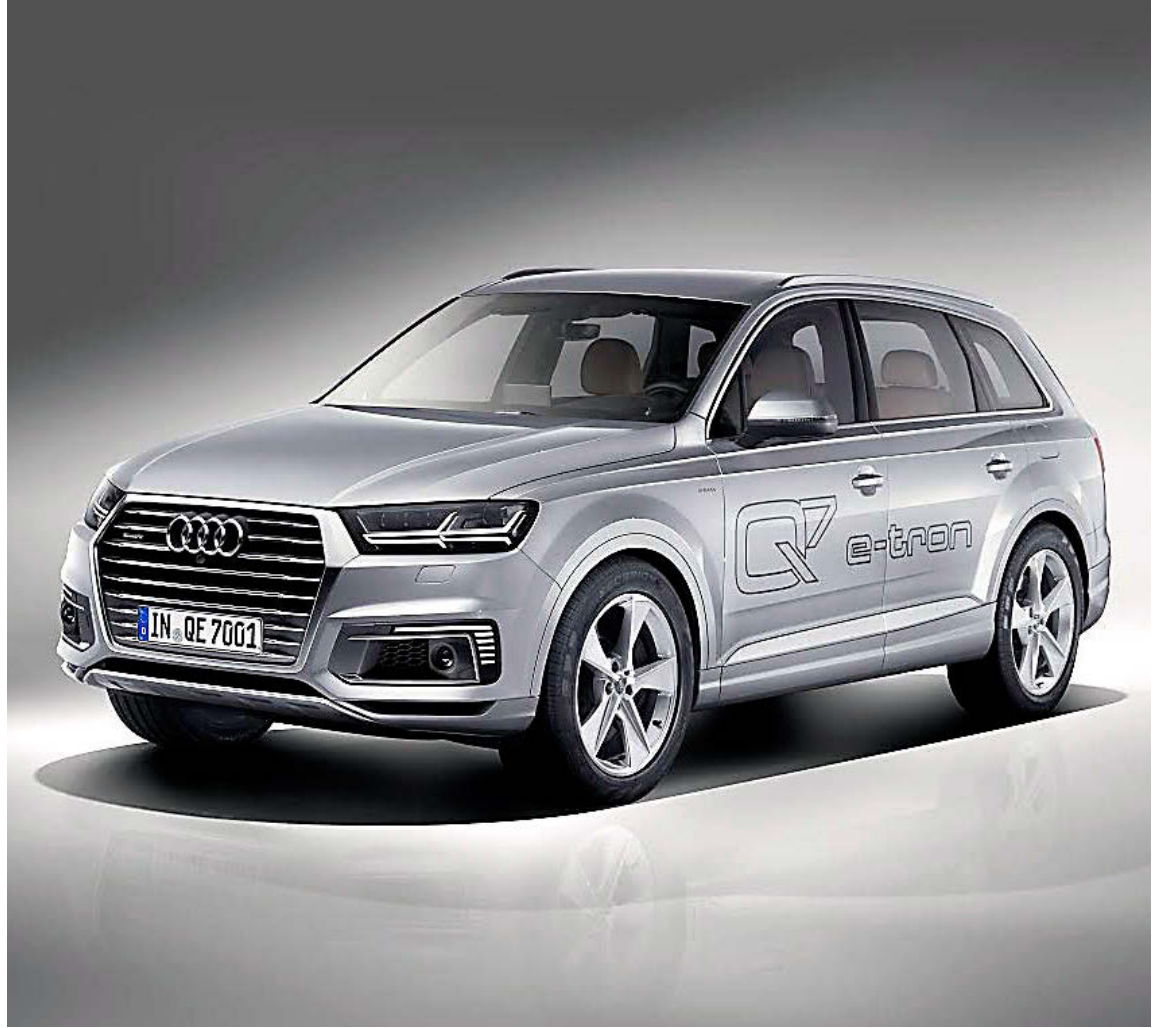
Audi Q7 e-tron tengiltvinnjeppinn er á leiðinni.

1,9 metra m breiður og 1,5 metra hár og það eru 2,7 metrar á milli öxla. Hann er talsvert frábrugðinn öðrum jepplingum Mazda í útliti en ef hann heldur að mestu línunum frá Koeru-tilraunabílnum er hér á ferðinni afar fallegur bíll. Að sjálfsgöðu fær þessi jepplingur skyactive-vél, sem er nú í flestum bílum Mazda. CX-4 fær að mestu sama undirvagn og CX-5 jepplingurinn en á að verða enn betri akstursbíll og þarf þó nokkuð til að slá við CX-5 í jeppingaflokknum.