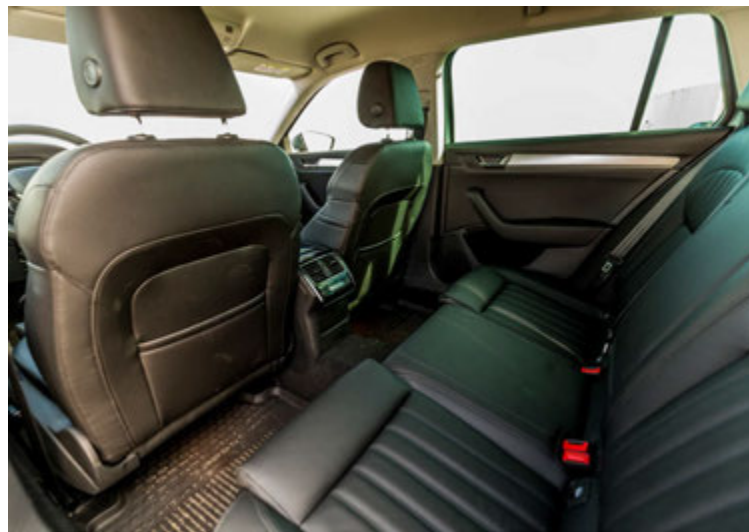
Risastórt fótarymi fyrir aftursætisfarþega.

Svo eru líka alltaf einhverjar skemmtilegar og óvæntar lausnir sem gleðja mann við hvern nýjan Skoda, enda er kjörorð þeirra „Simply clever“. Til dæmis má finna regnhlífar sem smeygt er inn í báðar framhurðirnar og því eru þær alltaf til taks