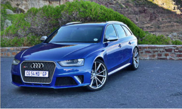
Audi RS4 fær minni vél en aukio afl.