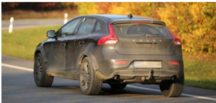
Volvo XC40 náðist á mynd við prufanir á dögnum.

Auk þessara 9 Nissan Skyline bíla brunnu þrjú japanskir sportbílar og 12 aðrir bílar. Nissan Skyline er forveri eins athlygiverðasta sportbils dagsins í dag, Nissan GT-R, bíls sem er handsmíðaður og getur att kappi við flesta ofurbíla heims, enda fer hann Nürburgring-brautina á 7 mínútum og 19 sekúndum og tekur sprettinn í hundrað á 2,8 sekúndum. Reyndar fer Nismo Nissan GT-R útgáfan þann sprett á 2,1 sekúndu.