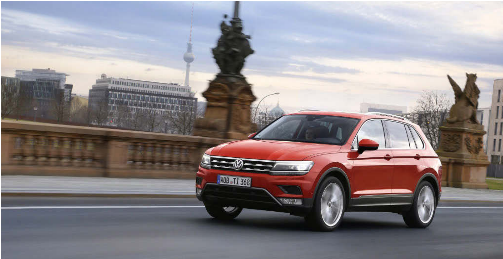
VOLKSWAGEN TIGUAN Finnur Thorlacius reynsluekur