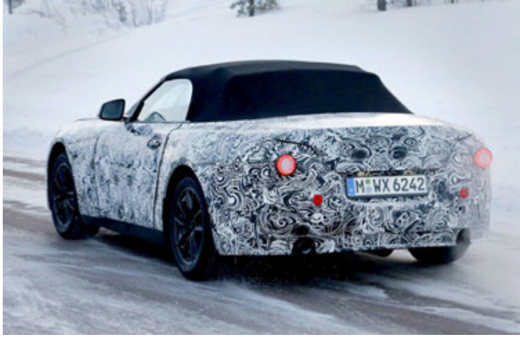
BMW Z5 Roadster.