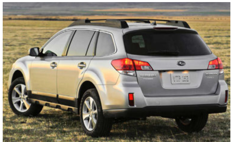
Subaru selur 66% bíla sinna í Bandaríkjunum.

í Bandaríkjunum í 7 ár í röð en allan þann tíma segir Ghosn að Nissan hafi verið að undirbúa sig undir stöðnun í sölu og sótt af krafti á markaði í Brasilíu, Taílandi, Indónesíu, Malasíu, Kína og Mexíkó. Einnig setti Nissan lágverðsmerkið Datsun á markað á mörkuðum sem ekki þola hátt verð.