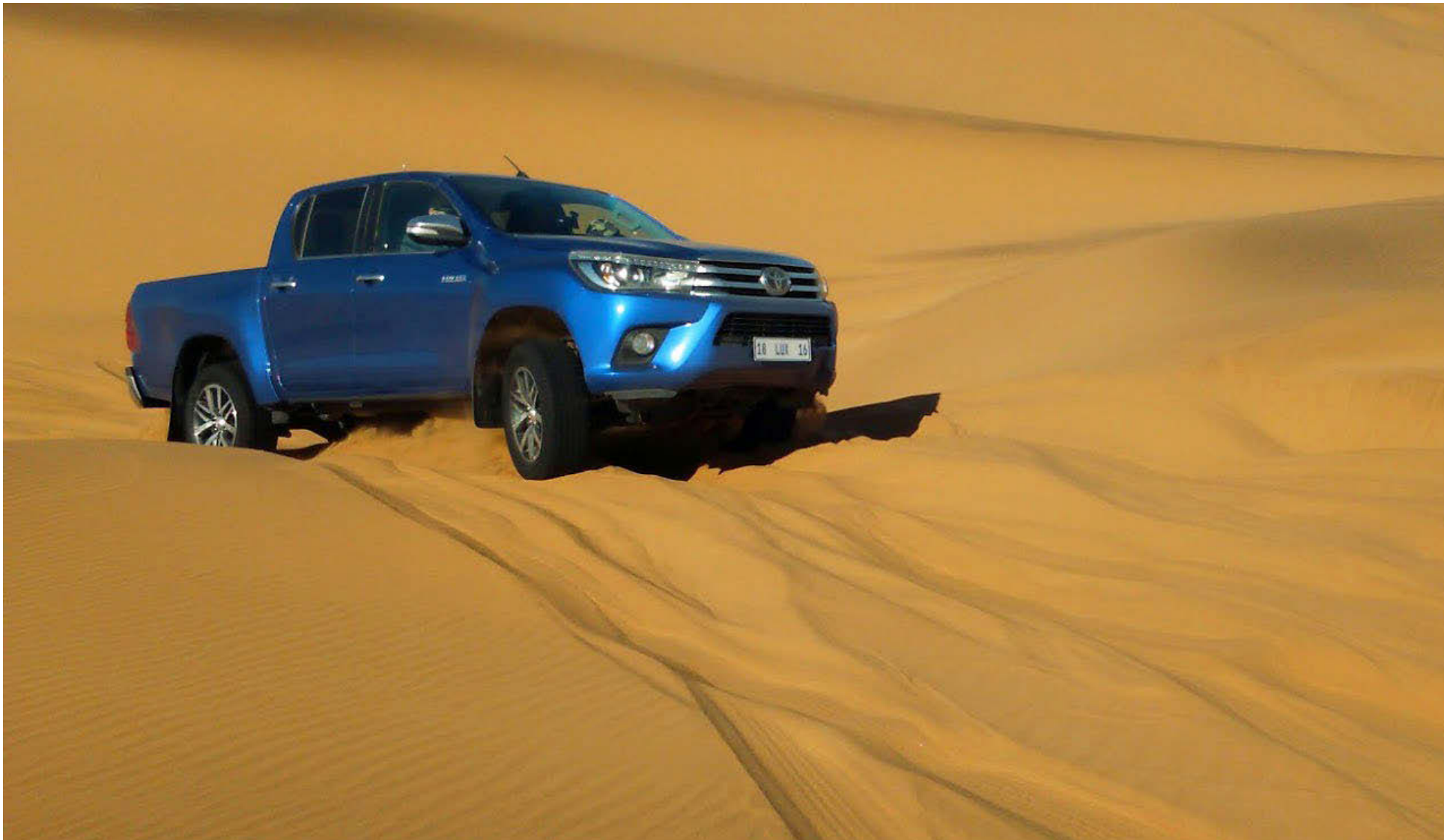
Hiluxinn að glíma við sandöldurnar í Dune 7 en hæstu sandöldur í heimi eru í Namibíu.

• Engin lúxus-bílainnrétting, en ekki þannig hugsaður