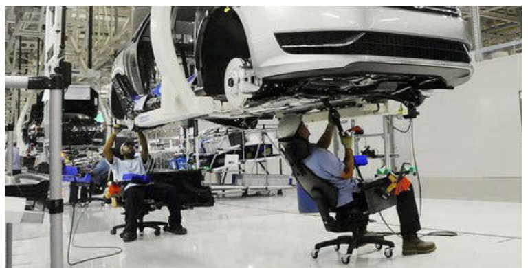
Í verksmiðju Volkswagen í Wolfsburg.

Það starfsfólk sem vinnur í samsetningarverksmiðjum Volkswagen en vant að fá myndarlega ársbónusa fyrir vinnu sína og á því verður engin breyting nú. Volkswagen ætlar að verðlauna allt starfsfólk sitt með 540.000 króna bónus fyrir vinnu sína í fyrra. Í fyrra fékk starfsfólkið reyndar 800.000 kr. bónus og því hefur hann lækkað um 260.000 krónur. Fjárhagur Volkswagen hefur versnað mjög í kjölfar uppgötvunar dísilvélasvindls fyrirtækisins, en það hefur samt fjárhagslegt bolmagn til að greiða starfsfólki sínu vel og bónusa ofan á föst laun. Í skýringu stjórnarmanns Volkswagen vegna greiðslu bónusanna nú sagði hann að starfsfólk hefði unnið undir miklu álagi, ekki síst vegna umræðunnar sem dísilvélasvindlið hafði í för með sér,