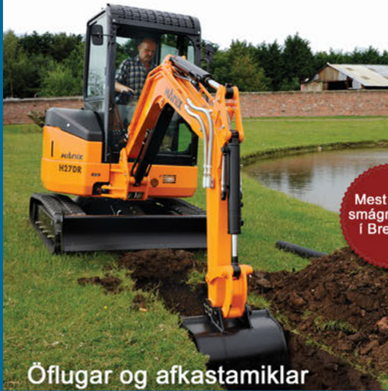
Öflugar og afkastamiklar