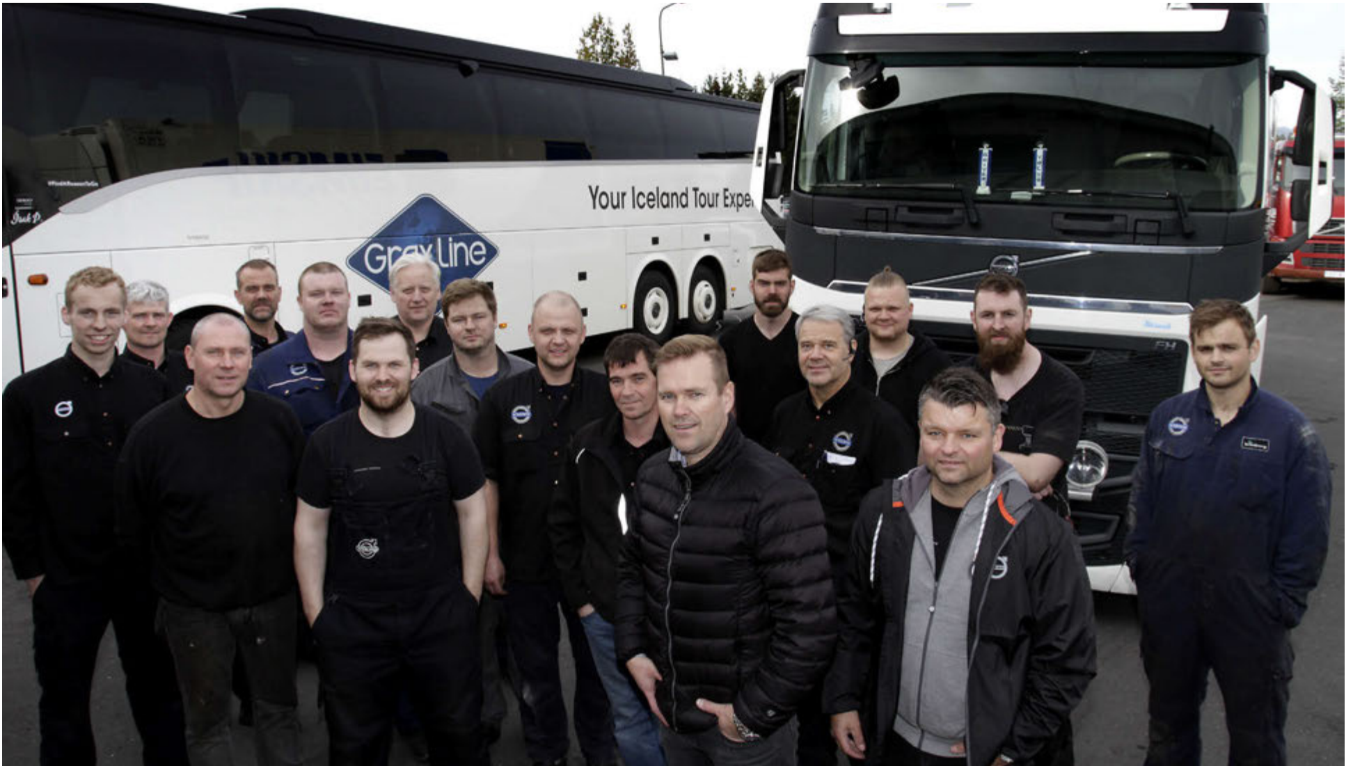
Við flutningana í Hádegismóa mun skapast umtalsvert hagræði og verður hægt að veita enn betri þjónustu.