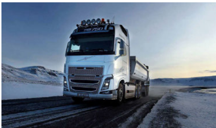
Starfið er annasamt og unnið á öllum tímum sólarhrings við mismunandi aðstæður.

Við flutning á svo verðmætum farmi skiptir hitastigið öllu máli að sögn Gísla. „Þar sem við erum með nýjustu bíla og vagna náum við að stýra því mjög vel. Framleiðendur og kaupendur eru eðlilega mjög stífir á þessum þætti þegar kemur að flutningi laxins. Þeir geta meira að segja fengið afrit úr vagninum ef einhver kvörtun berst þar sem hægt er að sjá nákvæm-