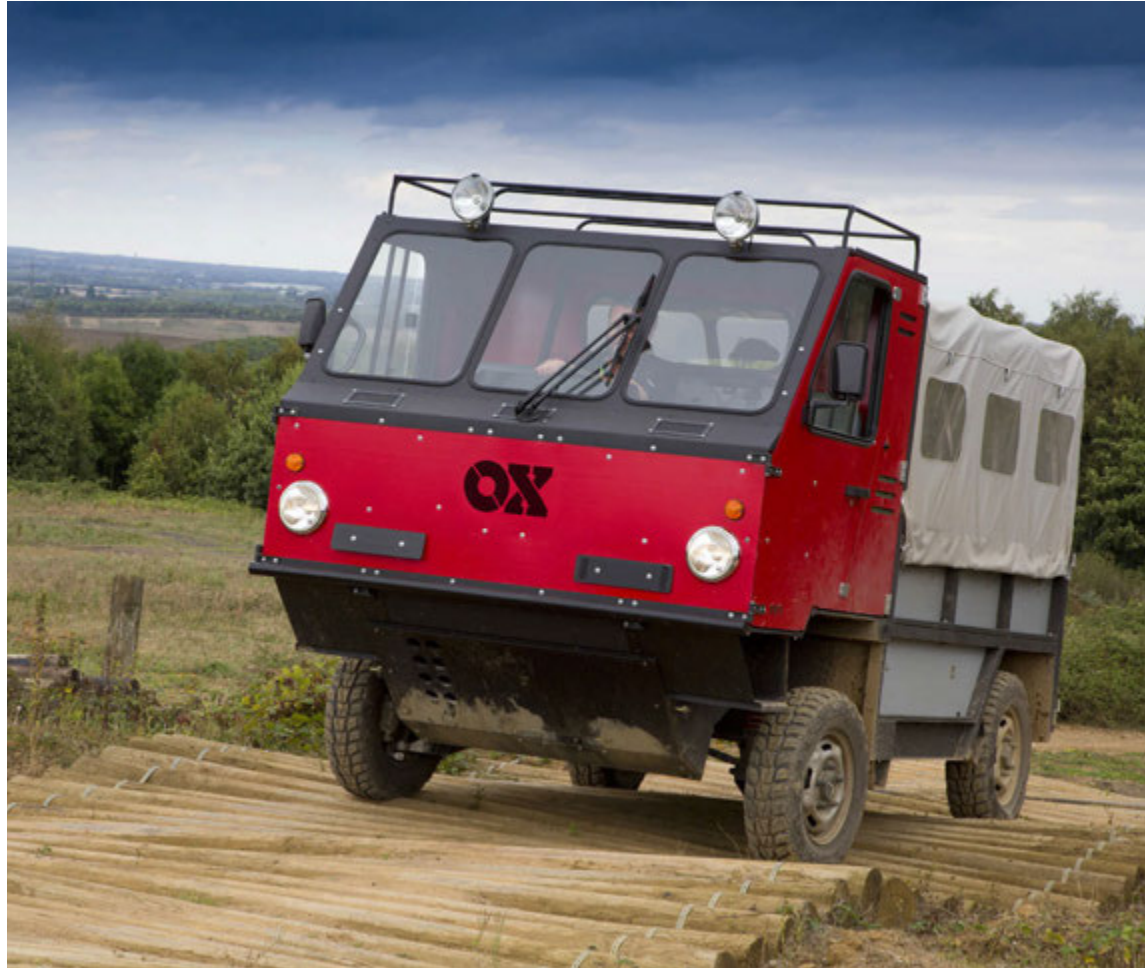
Trukkurinn er hannaður til að þola erfiða vegi.