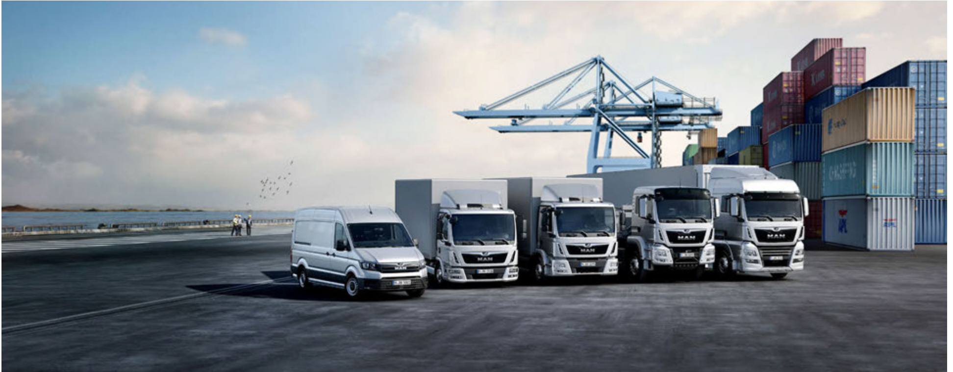
Með þyngdarsvið frá þremur tonnum upp í 44 tonn mun MAN geta boðið upp á fjölbreytt úrval þjónustu- og flutningabifreiða.