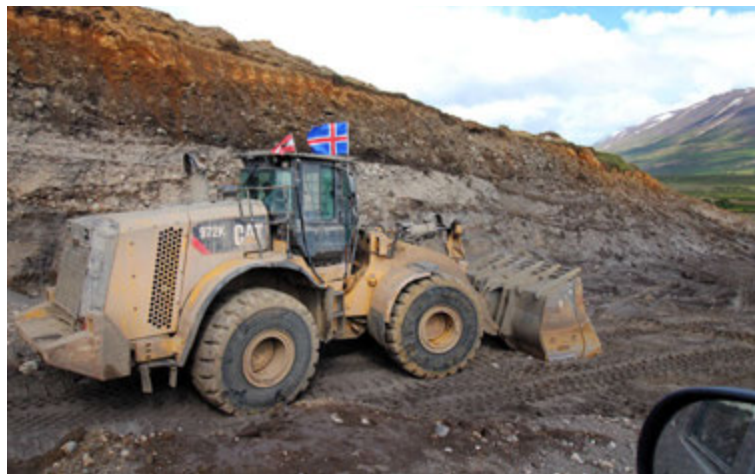
Milli 50 og 60 manns vinna við gerð Vaðlaheiðarganga.