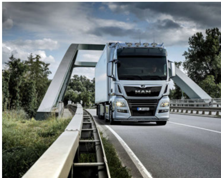
2017 módelin frá MAN verða allt upp í 640 hestöfl. Þeir eru umhverfisvænni og sparneytnari en eldri gerðir.