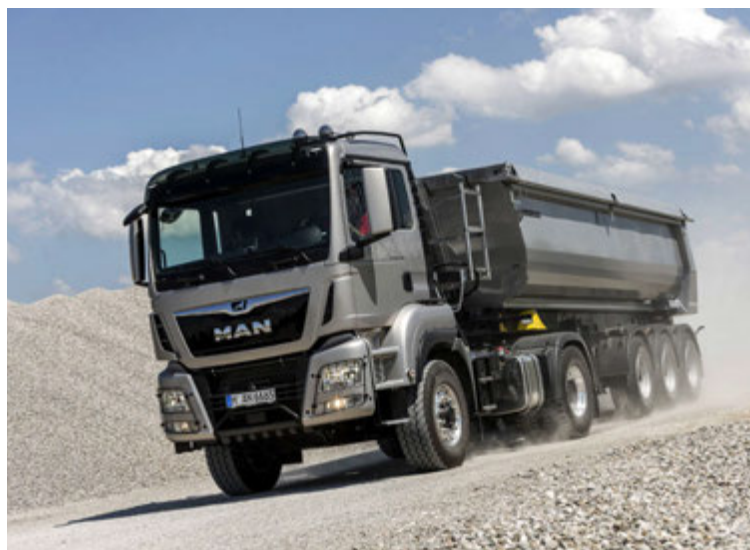
Kraftur hefur flutt MAN bíla til landsins frá upphafi. Í nóvember fagnar fyrirtækið fimmtíu ára afmæli sínu en það hefur alltaf verið í eigu sömu fjölskyldunnar.