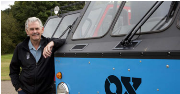
Hönnuðurinn Gordon Murray við einn af OX bílunum.

Samkvæmt GVT tekur það þrjár manneskjur undir sex tímum að pakka bílnum saman fyrir flutning. Þegar trukkarinn koma á áfangastað eru þarlend sérhæfð fyrirtæki fengin til að setja þá saman á ný og sjá um viðhald þeirra. Þrír þjálfaðir starfsmenn geta sett OX saman á