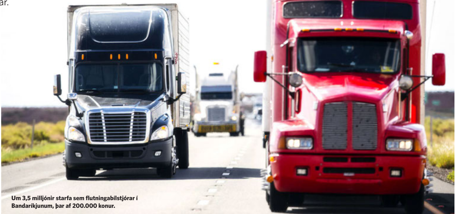
Um 3,5 milljónir starfa sem flutningabílstjórar í Bandaríkjunum, þar af 200.000 konur.