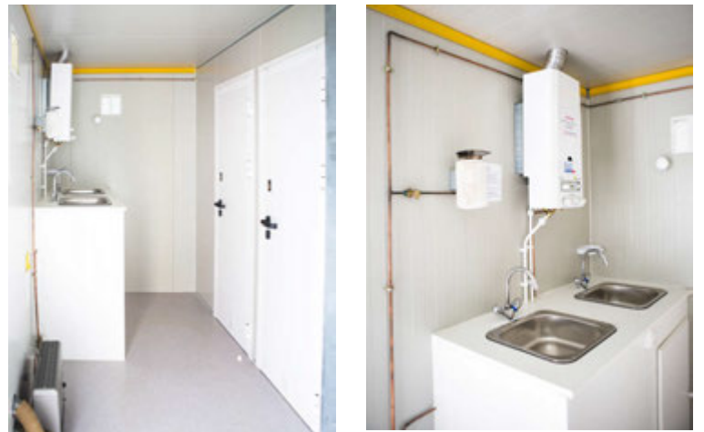
Þessi vagn er með tveimur salernum.