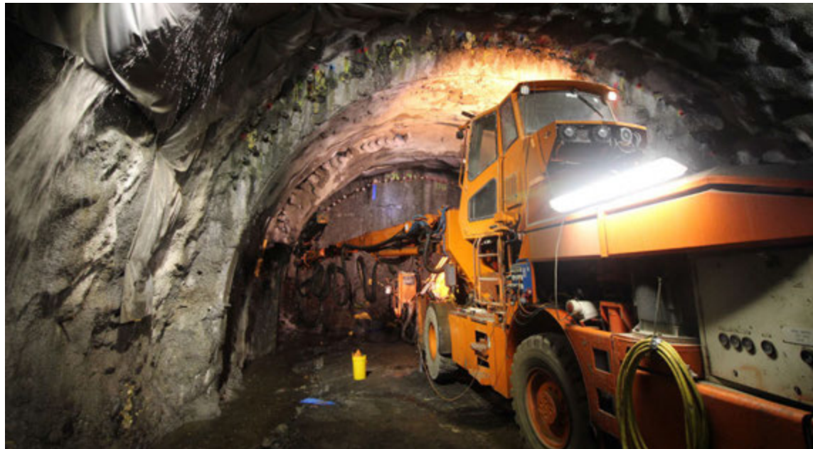
Sú vinnuvél sem er mest notuð við framkvæmdirnar er þriggja arma borvagn frá Sandvik DT1131. Borvagninn borar um það bil 130 til 150 holur, 5 metra djúpar, í stafninn. Sprengiefni er sett í holurnar og sprengt.

boltum. Boltarnir eru steyptr fastir til að tryggja öruggt vinnusvæði og síðan hefst borun fyrir sprengiefni í stafninn sjálfan að nýju. Ef vel gengur er sprengt tvisvar á dag og göngin lengjast þá um 10 metra þá daga. Meðalafköst í íslenskum jarðgöngum eru 40-60 metrar á viku á einum stafni.“