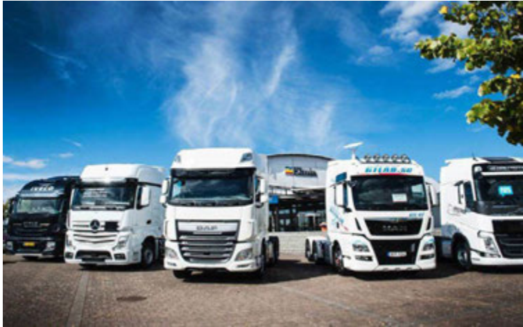
Sýningarsvæði Elmia Lastbil var gríðarstórt, 75 þúsund fermetrar bæði inni og úti.