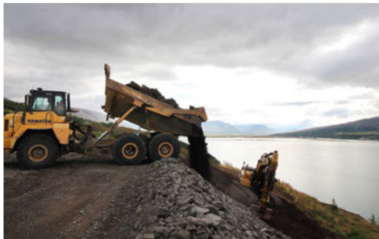
Fjórar til fimm búkollur keyra efnið út úr göngunum þegar búið er að sprengja.

Útvegum varahluti í flestar gerðir traktora og vinnuvéla. Einnig olíuverk í flestar gerðir bíla og tækja.