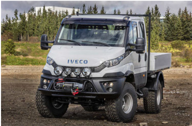
Iveco bílarnir hafa verið vinsælir hjá björgunarsveitum, bæjar- og sveitarfélögum og verktökum.