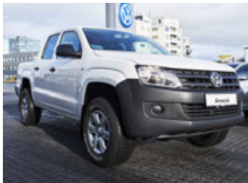
Volkswagen Amarok D/C er einstaklega rúmgóður pallbíll.