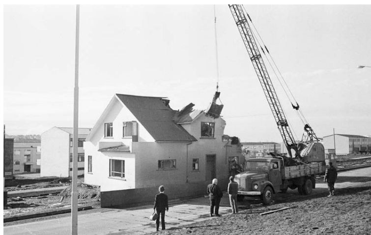
Hús við Bústaðaveg í Reykjavík rífið árið 1971.