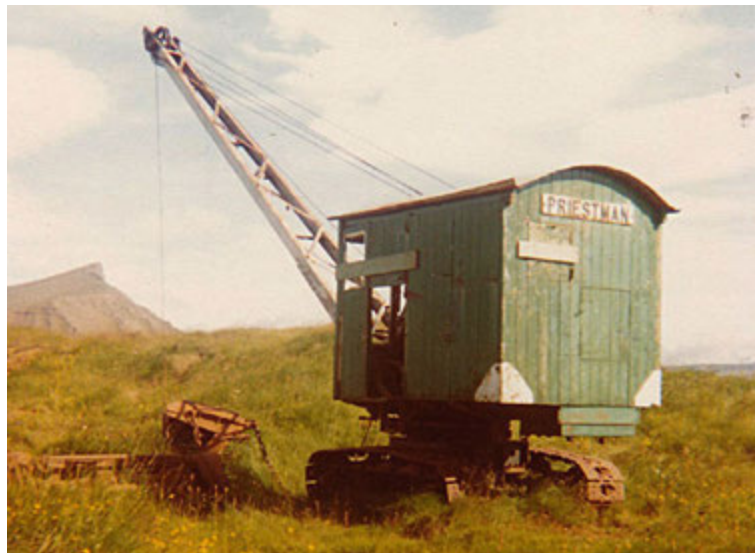
Önnur af tveimur elstu dragskóflugröfum landsins frá 1942.