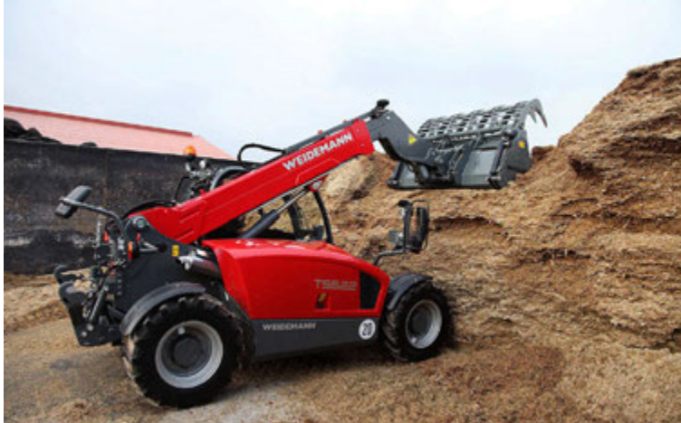
Weidemann skotbóman er hentug til ýmissa verka.

Kraftvélar hafa áður farið í svipaðar hringferðir um landið en þá hafa fleiri tæki verið með í för. „Í fyrri ferðum höfum við sýnt heildarvöruúrvalið okkar. Þá höfum við tekið traktora, gröfur