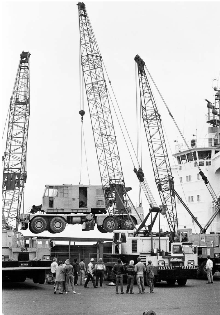
110 tonna krani sem fluttur var til landsins árið 1983 var sá stærsti sinnar tegundar. Hér er hann hífður upp á hafnarbakkann.

Almenn hagsmunagæsla og útgáfa gjaldskrár var þungamiðja félagsins árum saman að sögn Hauks. „Tilgangurinn með útgáfu gjaldskrár var upphaflega að láta reikna út rekstrarkostnað fyrir vinnuvélar en ekki síður til