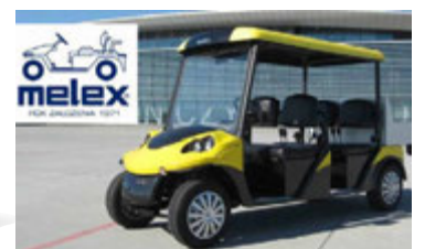
Verkfæri bjóða mikið úrval af rafmagnsbílum frá MELEX.