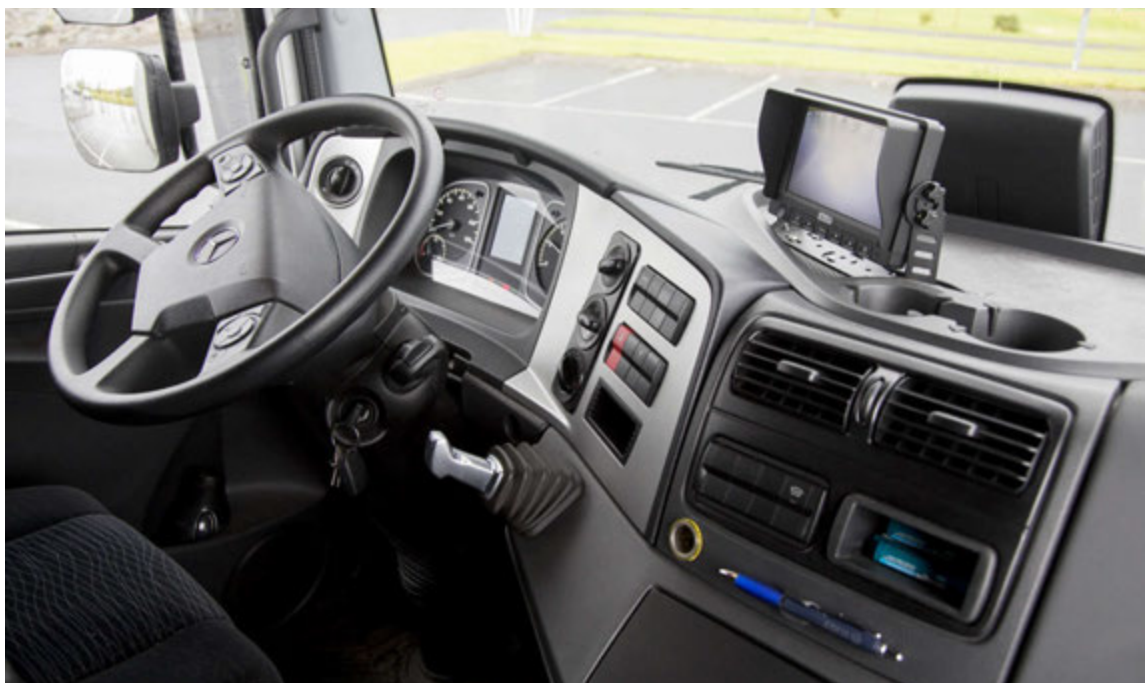
Bílinn er rúmgóður og þægilegur í akstri.

aka bíl daginn út og inn í tugi ára. „Þetta er alls ekki verra en hvað annað. En jú, það er ekki verra að hafa gaman af því að keyra og svo er gott að endurnýja bílinn öðru hvoru. Það lífgar upp á tilveruna.“