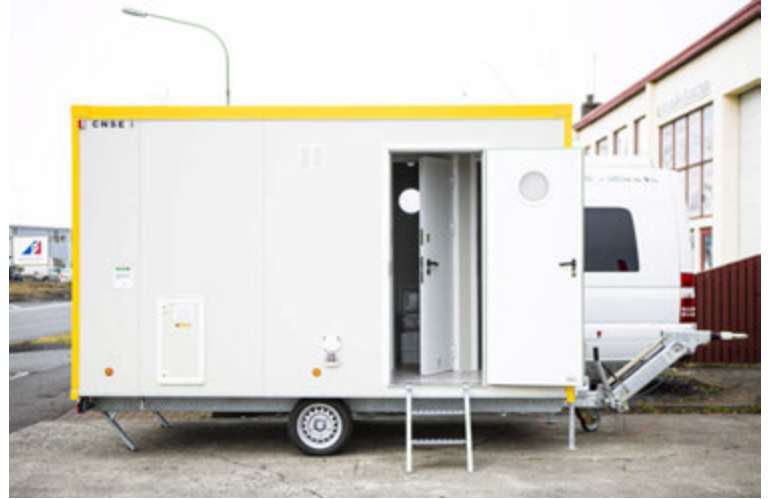
Salernisvagnarnir eru í mismunandi stærðum og útfærslum.