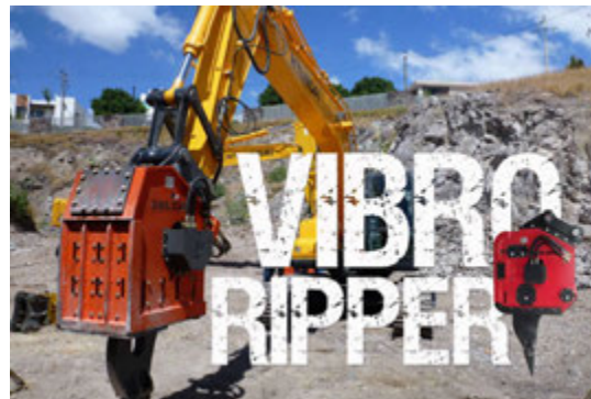
Verkfæri ehf. sérhæfa sig í aukahlutum eins og MaxBrio Vibra Ripper fyrir verktaða.