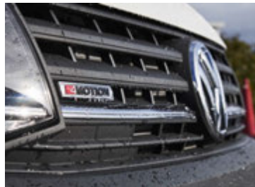
Fjór hjólaakerfið hjá Volkswagen kallast 4Motion.