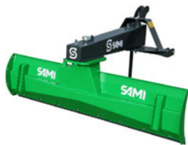
Vélburstar, flagheflar, fjölplogar Sanddreifarar, skóflur og brettagafflar