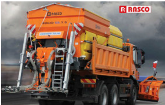
Búnaður frá RASCO til snjóruðnings og saltdreifingar.