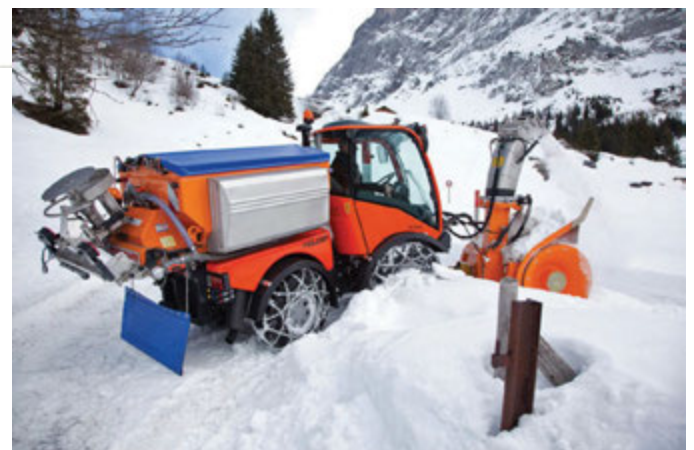
Alhliða liðstýrðir fjölnota vinnubjarkar til notkunar allt árið