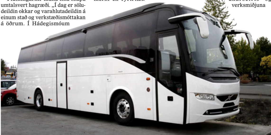
Volvo 9900 49 sæta VIP hópferðabifreið.