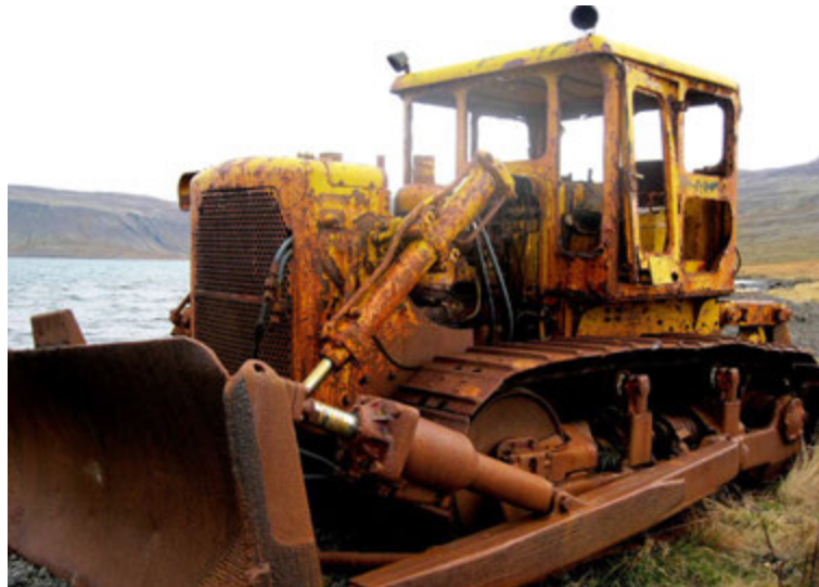
Þessi Caterpillar grafa frá 1964 hefur lokið verkefnum sínum.

Lagaumhverfið breyttist seinna meir og varð þá óheimilt að gefa út gjaldskrá. Í kjölfarið má segja að almenn hagsmunagæsla ásamt fræðslumálum og umsögnum um lagafrumvörp hafi verið helstu verkefni félagsins síðan. „Svo hefur drjúgur tími farið í að aðstoða vinnuvélaeigendur við að koma sér upp viðeigandi gæðakerfi enda sú krafa gerð af hálfu verkkaupa. Einnig höfum við veitt aðstoð vegna útboða á tryggingum, staðið fyrir námskeiðum, haldið árlegt útboðsþing, haldið úti vefnum vinnuvel.is og svo má nefna að mikil vinna fór í endurútreikning erlendu lánanna á sínum tíma.“