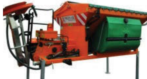
Fjölplogar, salt- og sanddreifarar