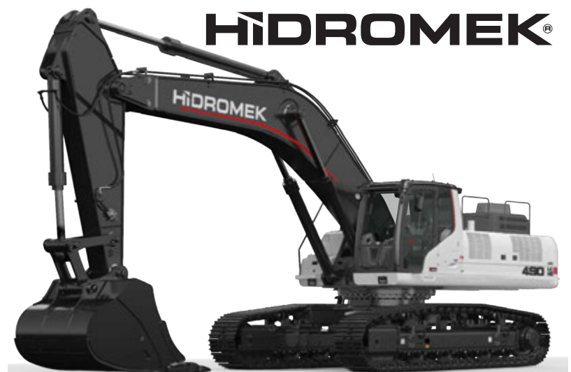
Beltagröfur 14 - 53 tonn - Hjólagröfur 14 - tonn