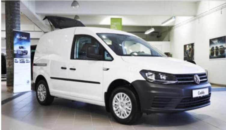
Volkswagen Caddy er vinsælasti atvinnubíll á Íslandi undanfarin ár.

Í byrjun árs frumsýndi Hekla nýja línu Volkswagen T6 atvinnubíla sem samanstendur af Transporter, Caravelle og Multivan sem byggja allir á arfleifð hins þekktu Volkswagen „rúgbrauðs“. Allir atvinnubílar T6 línunnar bjóðast með fjór hjóladrifi sem getur gert