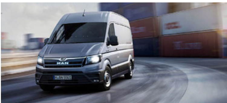
CW gildi útblástursins í MAN TGE er aðeins 0.33 og verður sparneytnasti bíllinn í sínum flokki. Lágur viðgerðar- og viðhaldskostnaður er einnig heillandi.

Það eru fleiri nýjungar á leiðinni frá MAN en á IAA sýningunni sem nú stendur yfir í Hannover í