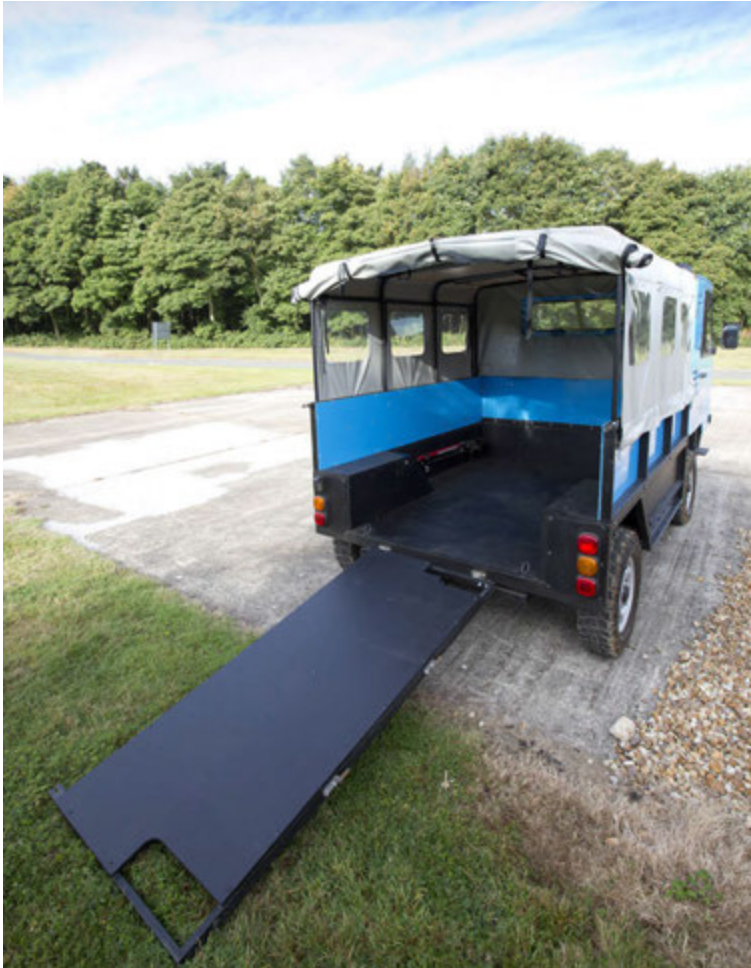
Afturhlerann má taka af og nota sem ramp.