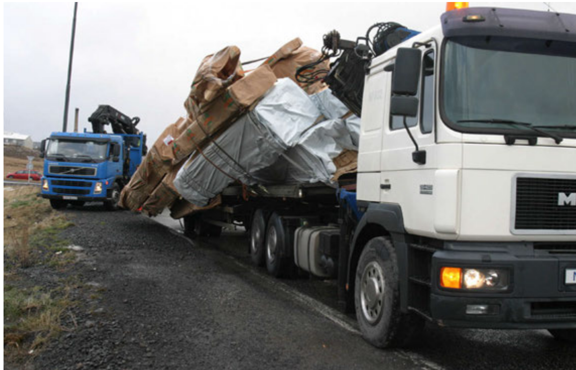
Farmur féll af flutningabíl við Rauðavatn fyrir nokkrum árum. Talið er að farmurinn hafi fallið af bílnum vegna þess að hann var illa festur.

Ýmsar reglur eru hins vegar til sem lúta að frágangi farms og er reglur um lestun vörubíla, festingu á farmi og umfang farms að finna í eftirtöldum reglugerðum: Reglugerð um hleðslu, frágang og merkingu farms, nr. 671/2008, Reglugerð um flutning á hættulegum farmi á landi, nr. 1077/2010.