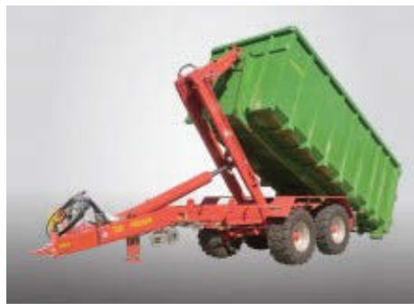
Vagnar og krókheysisvagnar