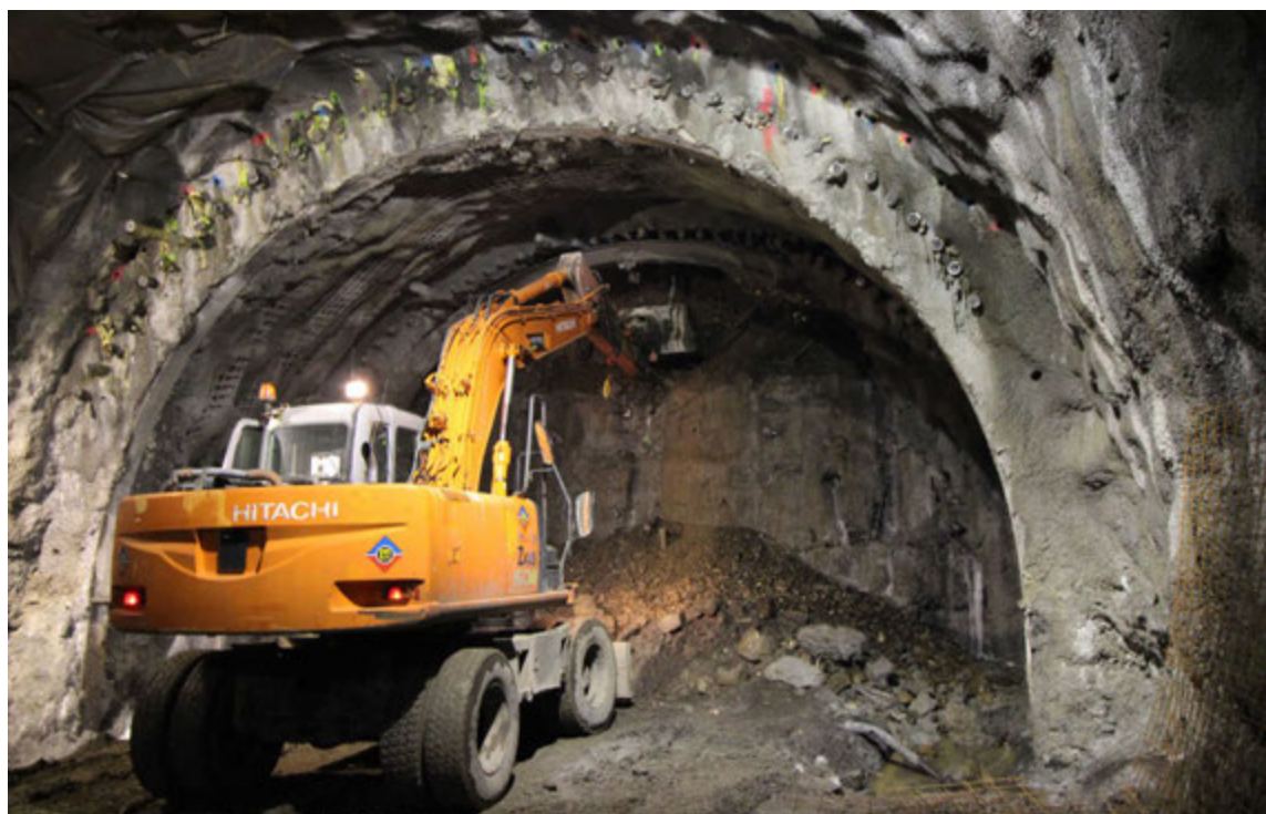
Þegar búið er að sprengja og lofta út moka hlólaskóflu lausa efnið á bíla.