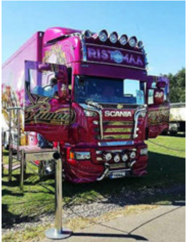
Önnu þótti gaman að sjá fallega skreytta trukka.