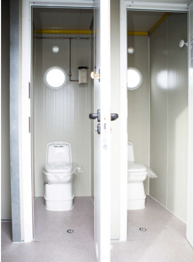
Hentug ferðasalerni geta leyst ýmis vandamál.

Nánari upplýsingar um ferðasalernin má sjá á heimasíðu RAG ehf, www.rag.is eða í síma 565 2727.