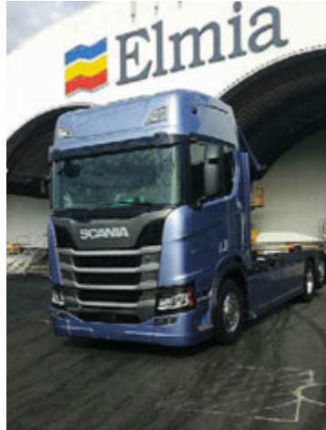
Sýningin er stór partur í kynningu Scania á nýjum útfærslum.