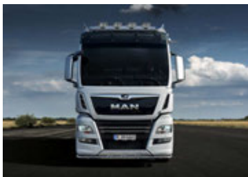
Nýju bílarnir frá MAN hafa fengið smávegis andlitslyftingu.