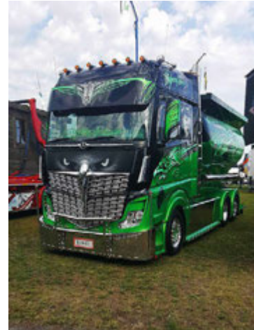
Vörubílar á sýningunni voru æði fjölbreyttir.