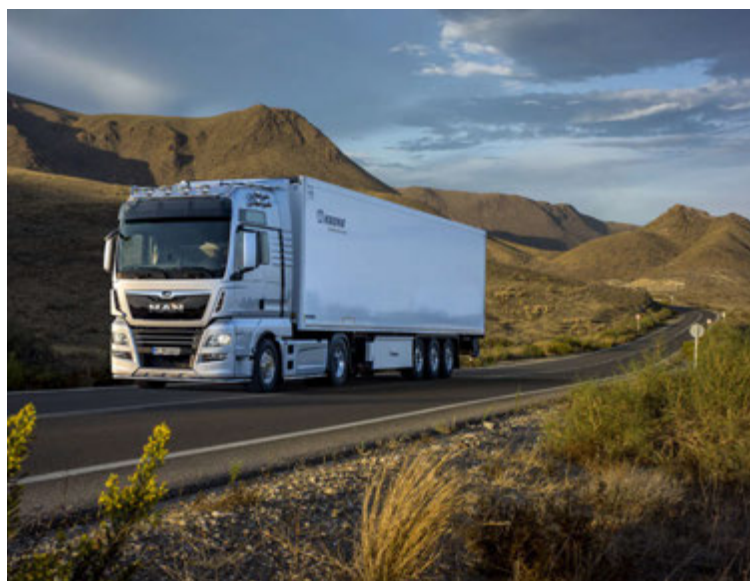
Allir bílar sem fluttir verða inn eftir áramót þurfa að uppfylla nýjan staðal til þess að þeir fái skráðir.