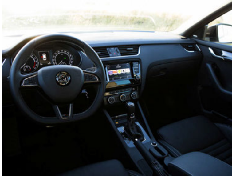
Lagleg en mjög dökk innrétting.