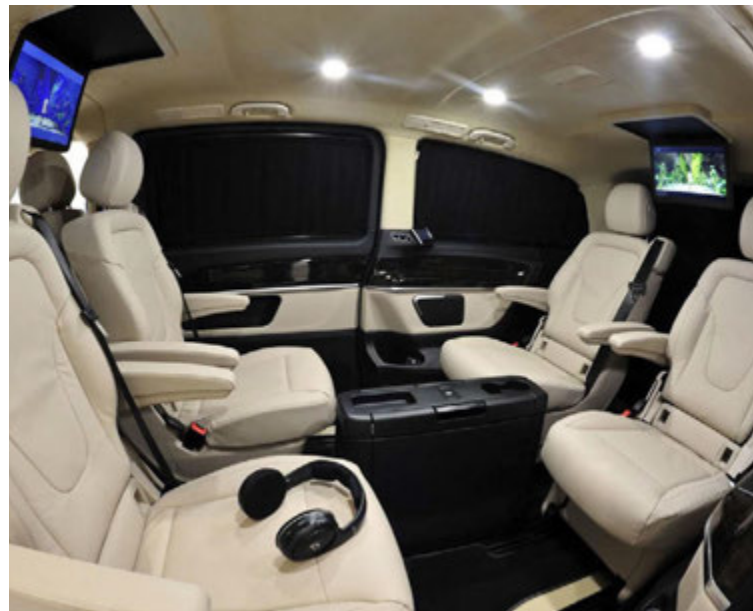
Ekki dónalegt innanrými í Mercedes-Benz V-Class bílunum.