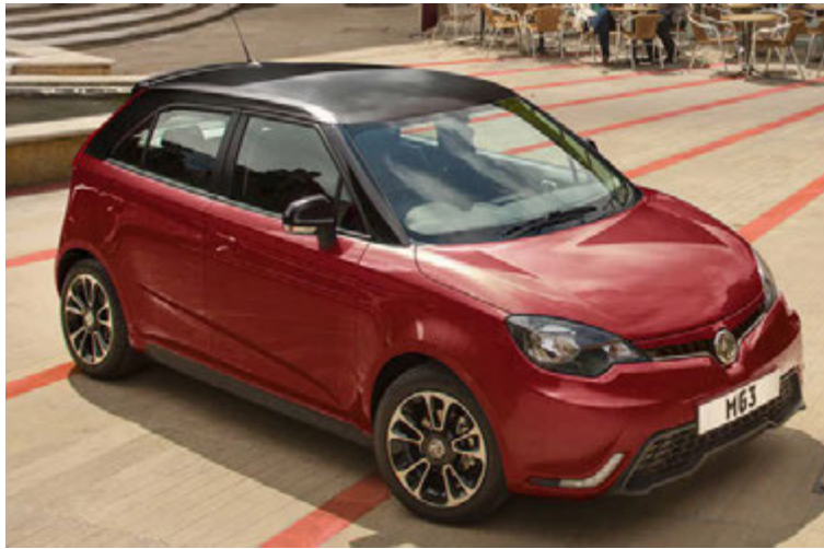
MG 3 er eini bíll MG sem framleiddur hefur verið í Bretlandi.