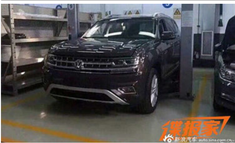
Þessi mynd náðist af nýja Volkswagen-jeppanum í Kína.