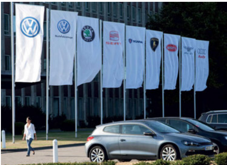
Frá höfuðstöðvum Volkswagen í Wolfsburg í Þýskalandi.

það sama 3,6 lítra vélin sem finna má í Passat í Bandaríkjunum. Engu að síður er líklegt að bíllinn verði einnig í boði með fjögurra strokka vél með forþjöppu og síðar meir með tengiltvinnafjárás. Bíllinn sem myndir náðust af í Kína er leðurklæddur að innan og frekar rífkulegur. Í fyrri áætlunum Volkswagen var meiningin að markaðssetja þennan jeppa í Bandaríkjunum, og verður hann þar í boði með þriðju sætaröðinni, fljótlega á næsta ári og á hann að hafa upp dræma sölu Volkswagen-bíla þar í landi. Sala Volkswagen-bíla í Bandaríkjunum hefur verið dræm frá uppgötvum dísilvéla-svindls Volkswagen.