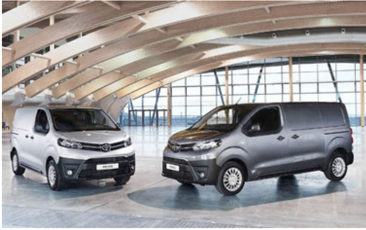
Proace kemur nú í fjölmörgum útfærslum.

Ný kynslóð Toyota Proace er væntanleg til landsins á allra næstu vikum, en þessi sendi- og fjölnotabíll var kynntur fyrir blaðamönnum í Póllandi fyrir stuttu. Vinnuþjarkurinn Proace er mörgum Íslendingnum kunnur og hefur hann verið í þjónustu ófárra íslenskra fyrirtækja í gegnum tíðina. Nýr Proace verður fáanlegur í þremur lengdum og mörgum útfærslum. Hann kemur bæði sem tiltölulega hrár flutningabíll sem og mjög vel búinn fólksflutningabíll með sæti fyrir allt að 9 manns. Báðar aftari sætaraðir bílsins eru á brautum. Í lengstu útgáfu Proace má koma fyrir farangri sem er allt að 3,5 metra langur og 3 Euro-pallettum, enda lengsta gerð Proace orðin 40 cm lengri en fyrr. Lengsta gerðin ber allt að 1,4 tonna farm, 200 kg meira en fyrri kynslóð Proace.