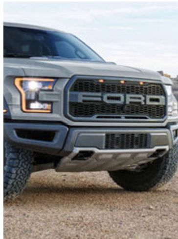
Ford Raptor eykur aflið.