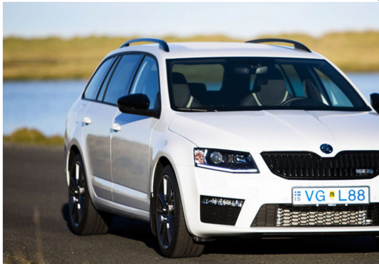
Skoda Octavia VRS.