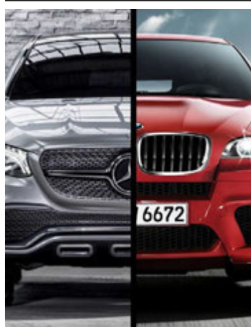
Hatrömm barátta Benz og BMW.

Kraftaútgáfa Ford F-150 heitir Raptor og hefur verið framleiddur frá árinu 2009. Hann hefur hingað til verið í boði með 5,4 eða 6,2 lítra V8 vélum, 310 og 411 hestöfl. Nýjasta gerð Raptor verður hins vegar með miklu minni en samt mun öflugri vél. Það er 3,5 lítra V6 EcoBoost vél sem tengist 10 gíra sjálfskiptingu, en eldri gerð bílsins var með ansi úrelta 6 gíra sjálfskiptingu. Nýja vélin togar 691 Nm, er 450 hestöfl sem dugar til að draga allt að 3.628 kg farm. Þessi nýja gerð Ford F-150 Raptor var fyrst kynnt á bílasýningunni í Detroit í fyrra, en nú er bíllinn fyrst að koma á markað. Ford F-150 Raptor af eldri gerðinni kostaði um 42.000 dollara en Ford hefur ekki gefið upp verð nýja bílsins.