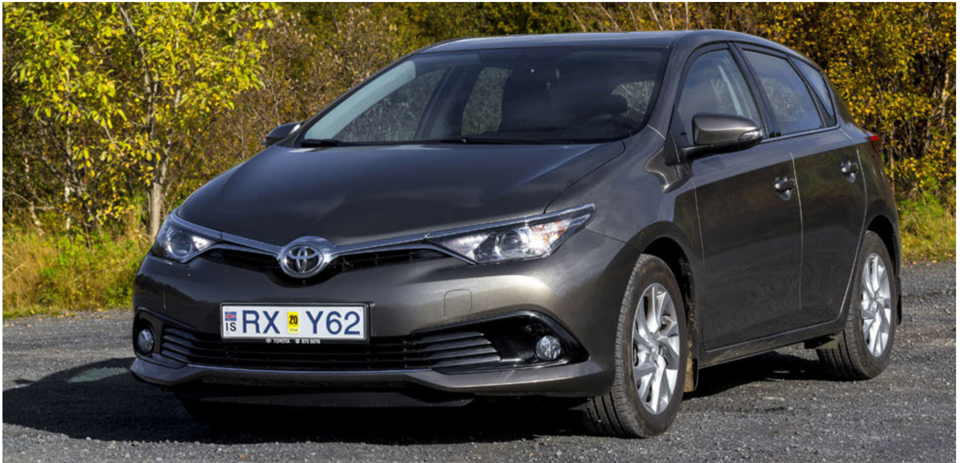
Toyota Auris 1,2 Turbo.