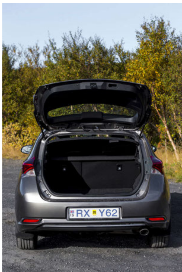
Gott aðgengi að skottrými og mikið pláss.