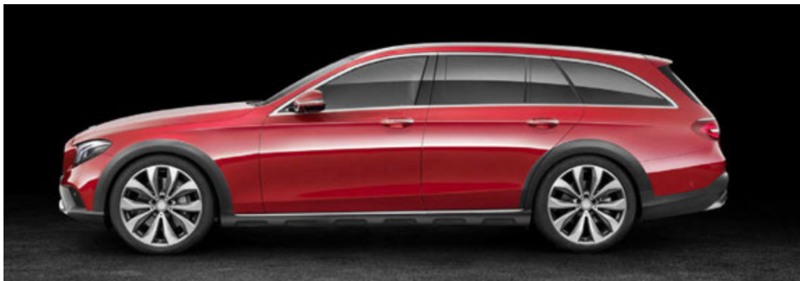
Mercedes Benz E-Class All Terrain er upphækkuð útfærsla af hefðbundnum E-Class bíl.

sína og sannaðist það í reynsluakstri hans í Póllandi, en hér mun bráðlega birtast reynsluakstursgrein um bílinn frá þeim akstri.