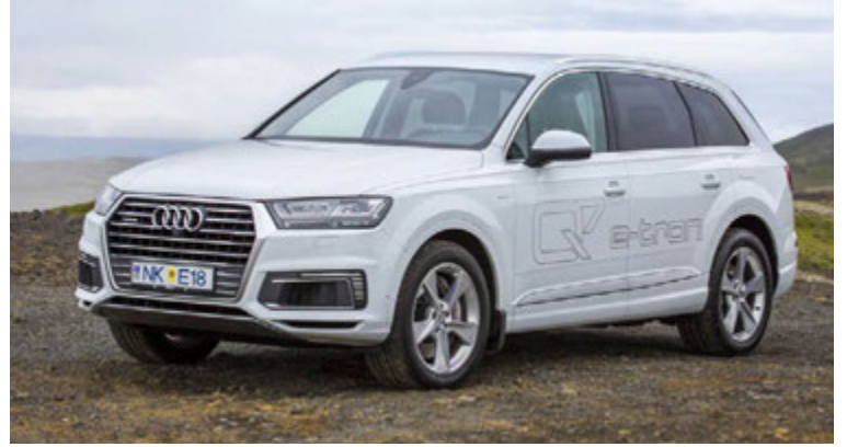
Á þriðja tug Audi Q7 e-tron seldust ósédur.

Borgward ætlar að kynna minni BX5-jepping seinna á þessu ári.