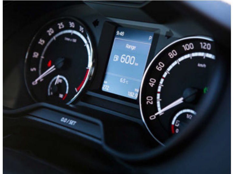
Flottir mælari í Skoda Octavia VRS.

bæra 7 girá DSG-sjálfskiptingu. Hann má einnig fá fjórhjóladrifinn og að sjálfsgöðu í sedan-útfærslu líka og einnig beinskiptan ef spara skal aurinn. Reynsluakstur bíllinn var sjálfskiptur og fjórhjóladrifinn langbakur og þannig búinn kostar hann 5.990.000 kr. en í sinni ódýrustu mynd, þ.e. sem sedanbíll með framhjóladrifi og beinskiptur kostar hann 4.990.000 kr. Það er lægra verð en á 220 hestafla bensínbílnum, sem kostar frá 5.290.000 kr. Rétt er þó að taka fram að Octavia VRS með bensínvélinni er nokkru snarpari og fer