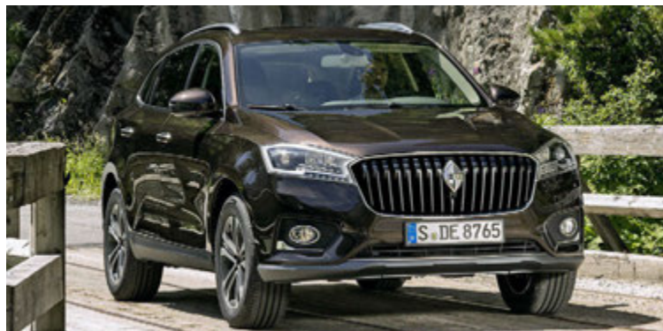
Borgward BX7 jeppinn hefur selst í fjögur þúsund eintökum í Kína og 10.000 pantanir bíða afgreiðslu.

Í apríl síðastliðnum kynnti Borgward BX7-jeppa sinn í Kína og er hann með 2,0 lítra forþjöppudrifna vél. Hann hefur nú þegar selst í 4.000 eintökum í Kína að sögn Borgward og bíða 10.000 pantanir í bílinn afgreiðslu. Borgward hefur