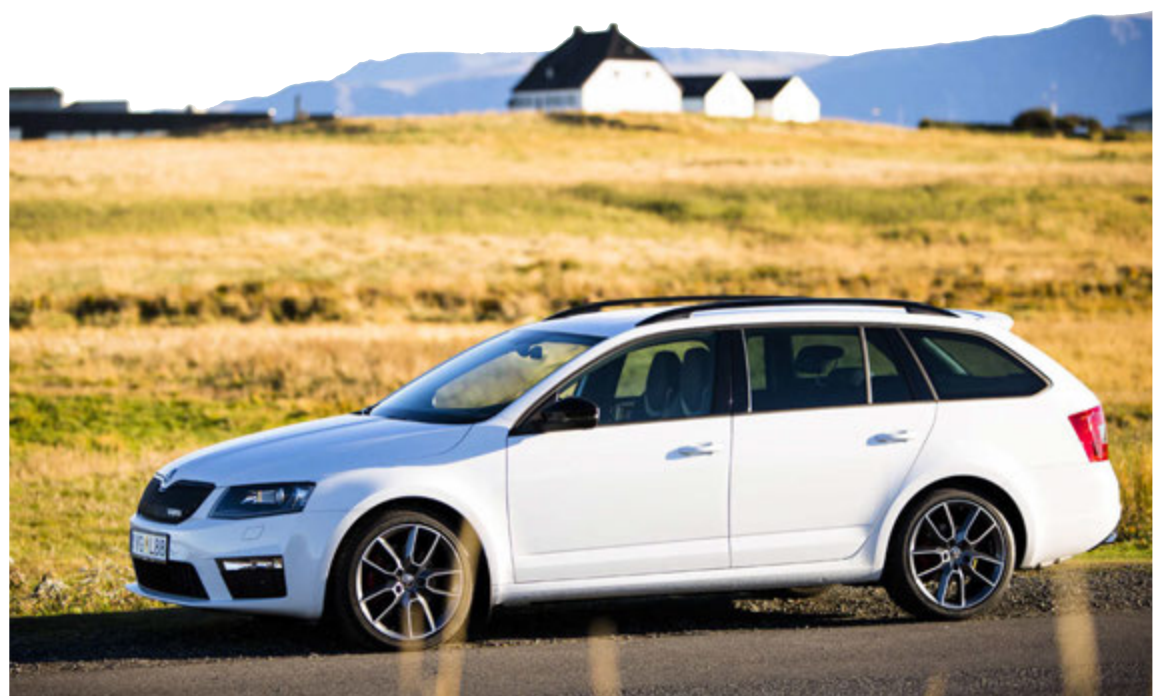
Skoda Octavia VRS er úlfur í sauðargæru.

að fá í einum bíl 5 manna fjölskyldubíl með 590 lítra flutningsrými sem er innan við 8 sekúndur í hundraðið og eyðir samt aðeins 4,7 lítrum á hverja 100 ekna kílómetra. Þannig er Skoda Octavia VRS með 2,0 lítra dísilvél, en hún skilar 184 hestöflum gegnum frá-