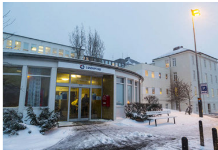
Matsalir og eldhús Landspítala eru með Svansvottun.

Meira lífrænt ræktað hráefni er notað á spítalanum, boðið er upp á fjölbreyttan og hollan mat úr úrvals hráefni og framboð aukið af grænmeti. Minna plast og einnota vörur eru notaðar. Boðið er upp á margnota matarbox eða einnota