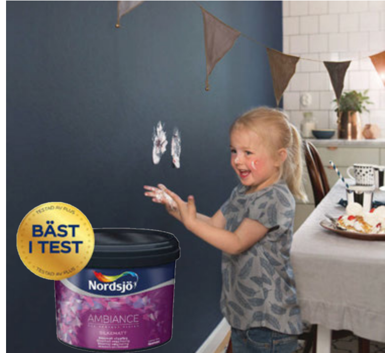
Nordsjö málningin hlaut viðurkenninguna Bäst i test á þessu ári.

Það er algengur misskilningur að umhverfisvottuð málning sé