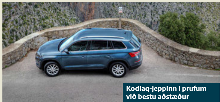
Kodiaq-jepinn í prufum við bestu aðstæður

„Þetta er besta ár Kia frá upphafi á Íslandi og það er frábær árangur