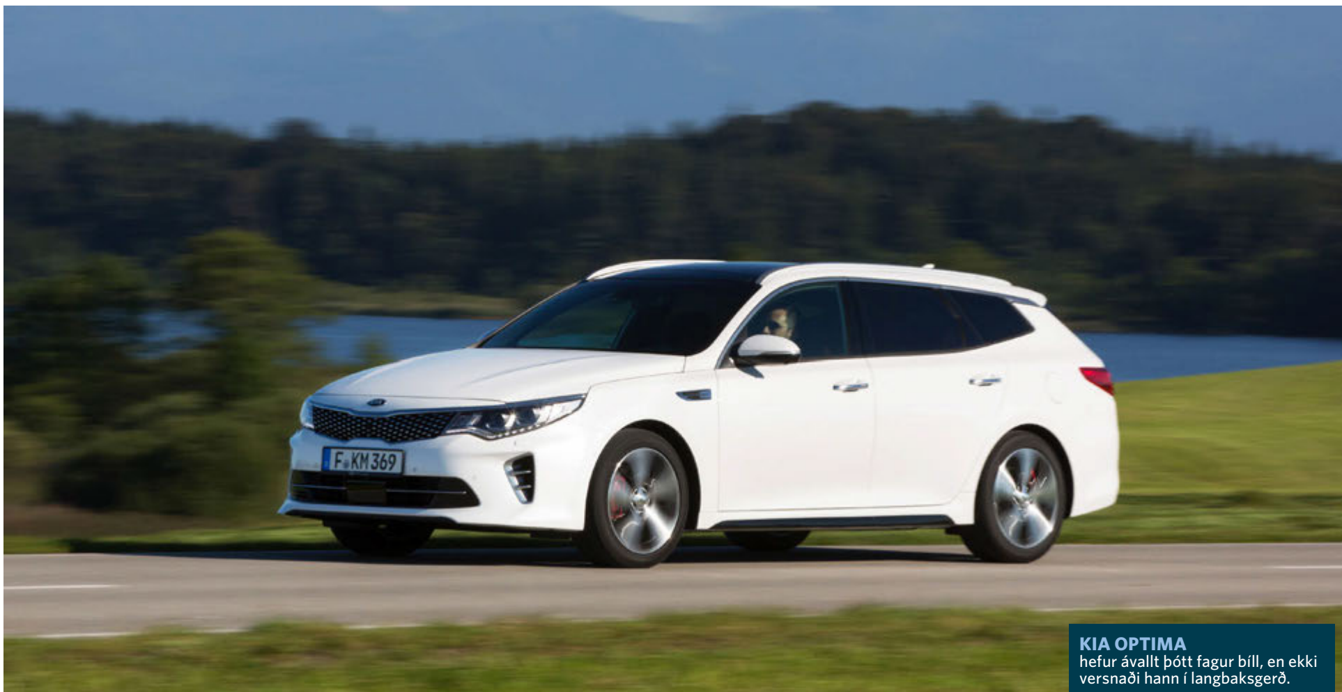
KIA OPTIMA hefur ávallt þótt fagur bíll, en ekki versnaði hann í langbaksgerð.