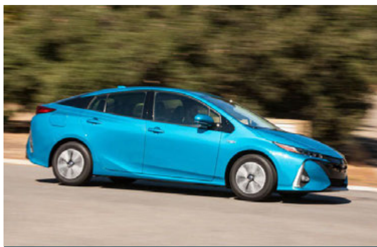
TOYOTA PRIUS ruddi brautina fyrir hybrid-bíla Toyota og brátt mun Toyota líka auka úrvalið í tengiltvinnbílum.

Fyrir mörgum árum ákvað Toyota að veðja á hybrid-bíla fyrir Evrópumarkað og tók með því ekki slaginn við evrópska bílaframleiðendur í framleiðslu dísilbíla. Sú ákvörðun virðist nú vera að bera ríkulegan ávöxt því sala hybrid-bíla í Evrópu hefur vaxið um 40% á árinu á meðan dísilbílanna evrópsku bílaframleiðendanna hefur dregist saman. Á þessu fyrsta heila ári frá dísilvélasvindli Volkswagen og þeirri andstöðu sem dísilbílar hafa mætt síðan þá er sala Toyota-bíla með hybrid-tækni orðin þriðjungur af allri sölu Toyota í Evrópu og á að fara yfir helmingshlutdeild í lok þessa áratugar.