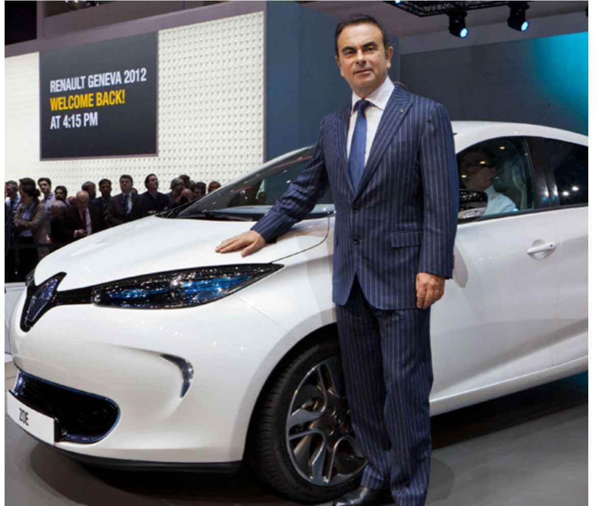
RENAULT ZOE. Carlos Ghosn, forstjóri Renault Nissan, við hlið rafmagnsbílsins Renault Zoe.

Við lifum á tímum þar sem tæknipróun er mjög hröð. Tæknibyltingarnar knýja til breytinga á gömlu