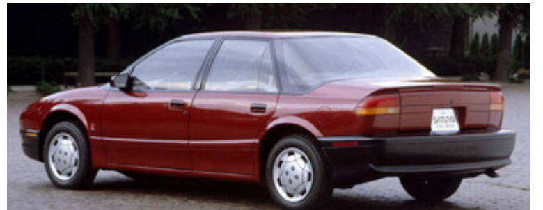
SATURN SL ágerð 1991 þótti hvorki falgur né góður bíll, en dæmigerður fyrir framleiðslu Saturn.

Fyrstu árin gekk þó vel og höfðu bílar Saturn til hóps fólks sem