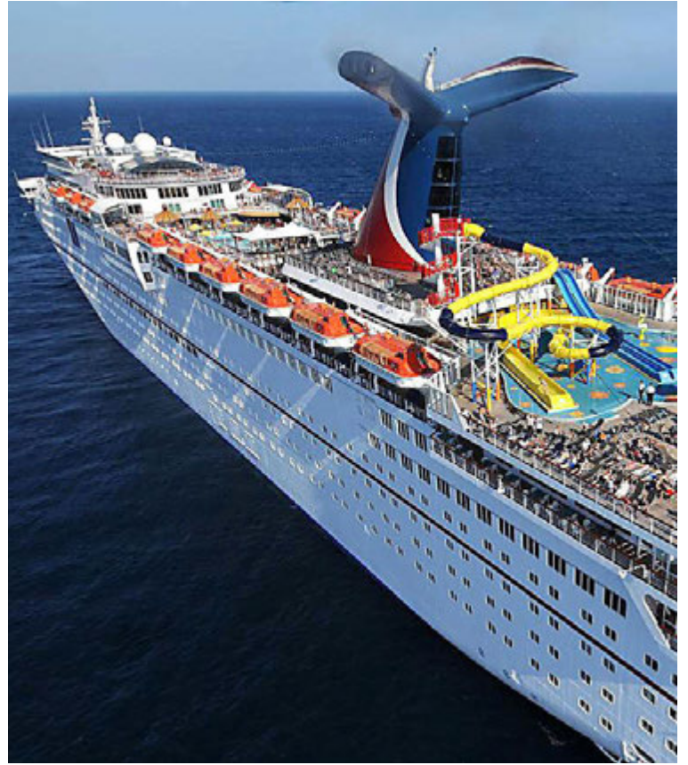
Carnival Miracle er glæsilegt skip í flota Carnival Cruises. Sigt verður með þessu skipi frá Los Angeles til „Mexíkósku rívierunnar“.