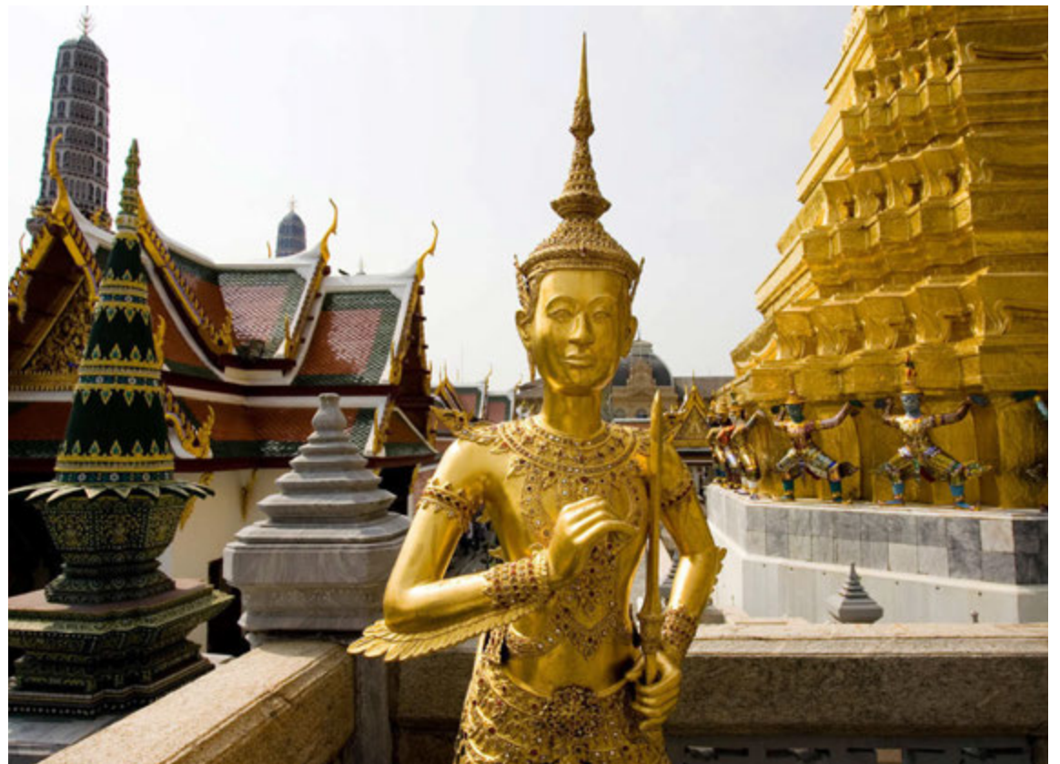
Grand Palace í Bangkok er vinsælasti viðkomustaður ferðamanna í borginni.

mikið af grænmeti og kryddi, t.d. spila sitrónugras og kókósmjólk oft stórt hlutverk.“