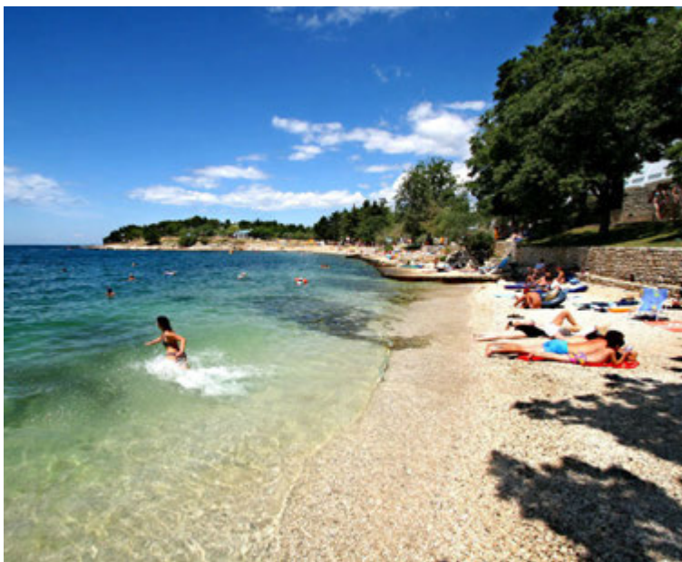
Króatía er einn eftirsóttasti áfangastaður ferðamanna í Evrópu.

Sólaráfangastaðurinn Porec er á Istria-skaganum en skaginn er nyrsti hluti Króatíu og þar eru