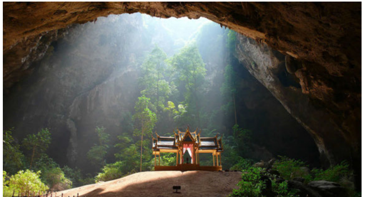
Það er mögnuð upplifun að sjá sólina skína í gegnum lítið hellisgat á hofið í hellinum í Khao Sam Roi Yot þjóðgarðinum.