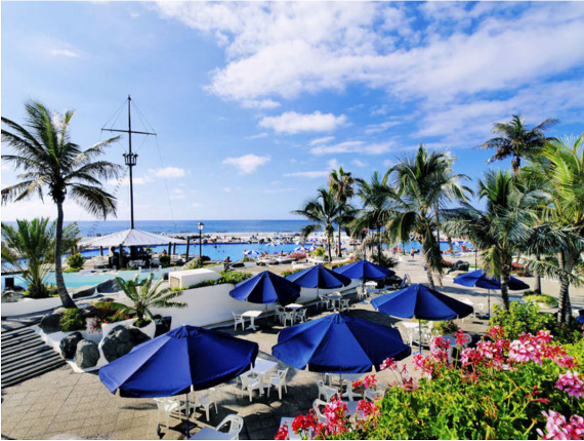
Tenerife er sívinsæll áfangastaður enda er þar allt til alls.

KYNNINGARBLAÐ Gaman Ferðir | Heimsferðir