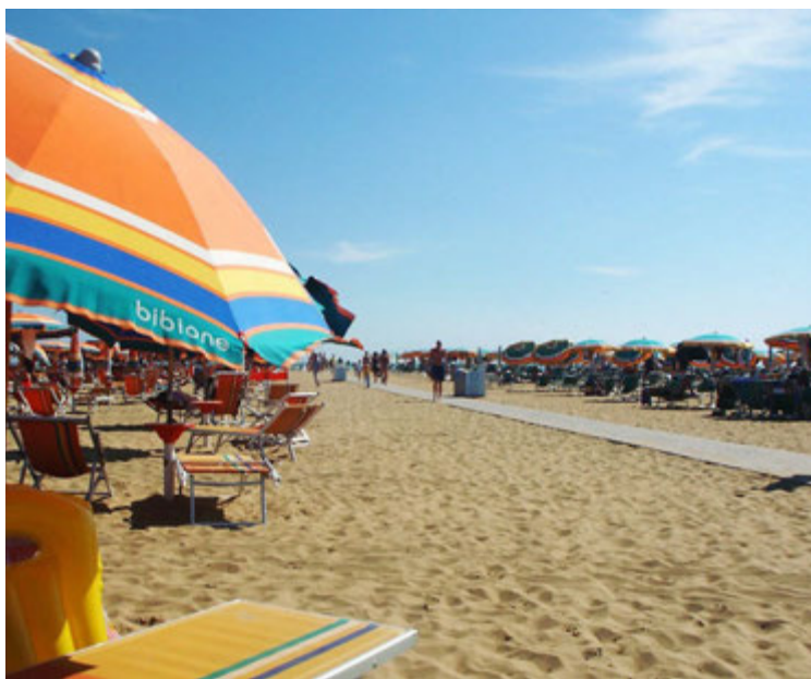
Heimsferðir bjóða upp á beint flug til Bibione á Ítalíu í sumar.

Bibione er frábær staður fyrir barnafjölskyldur. Ströndin er einstök og þar líður dagurinn hratt hvort heldur er við leik eða