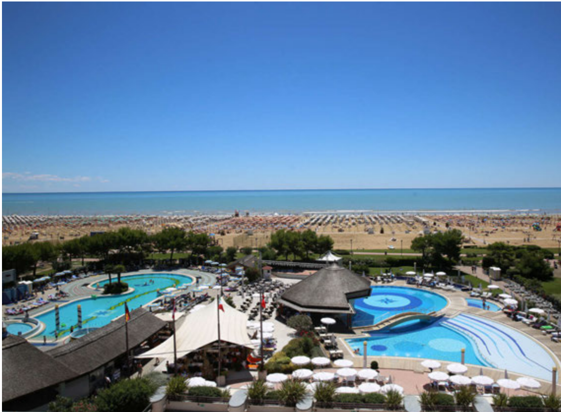
Bibione á Ítalíu er einstök strandperla við norðanvert Adríahafið.

Þeir staðir sem Heimsferðir býður upp á eru Krít, Gran Canaria, Costa de Almería, Albir, Mallorca, Costa del Sol, Tenerife,