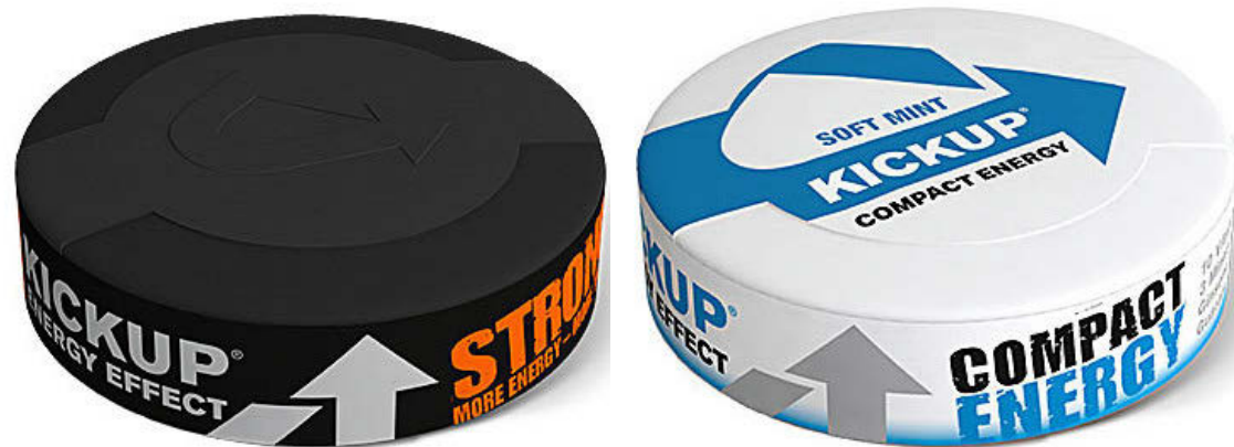
Til eru fjórar tegundir; strong, salmiak, soft mint og real white.