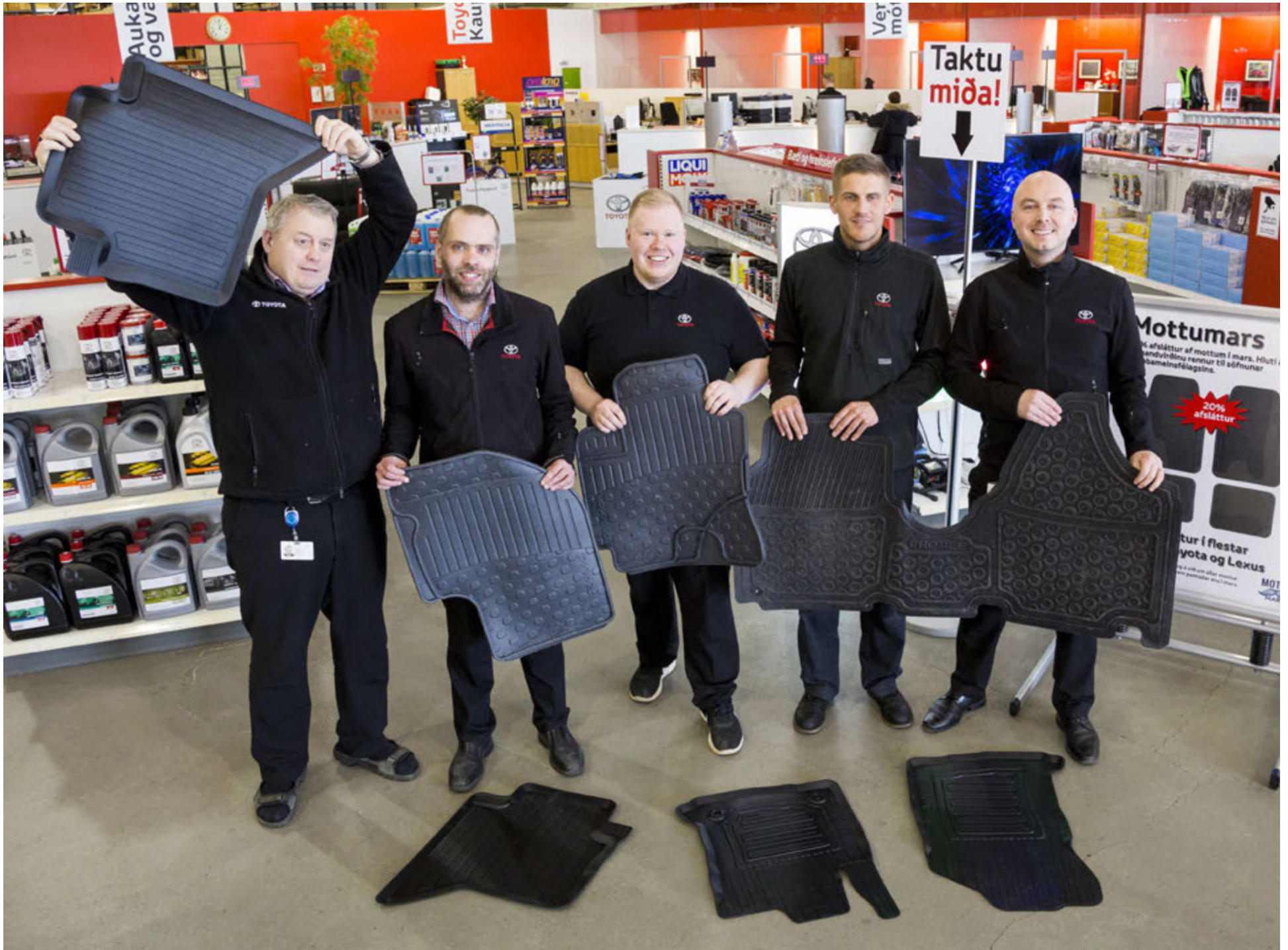
Starfsmenn verslunar Toyota Kaupþúni búa yfir mikilli reynslu og taka vel á móti viðskiptavinum. Í mars bjóða þeir 20% afslátt af öllum mottum.