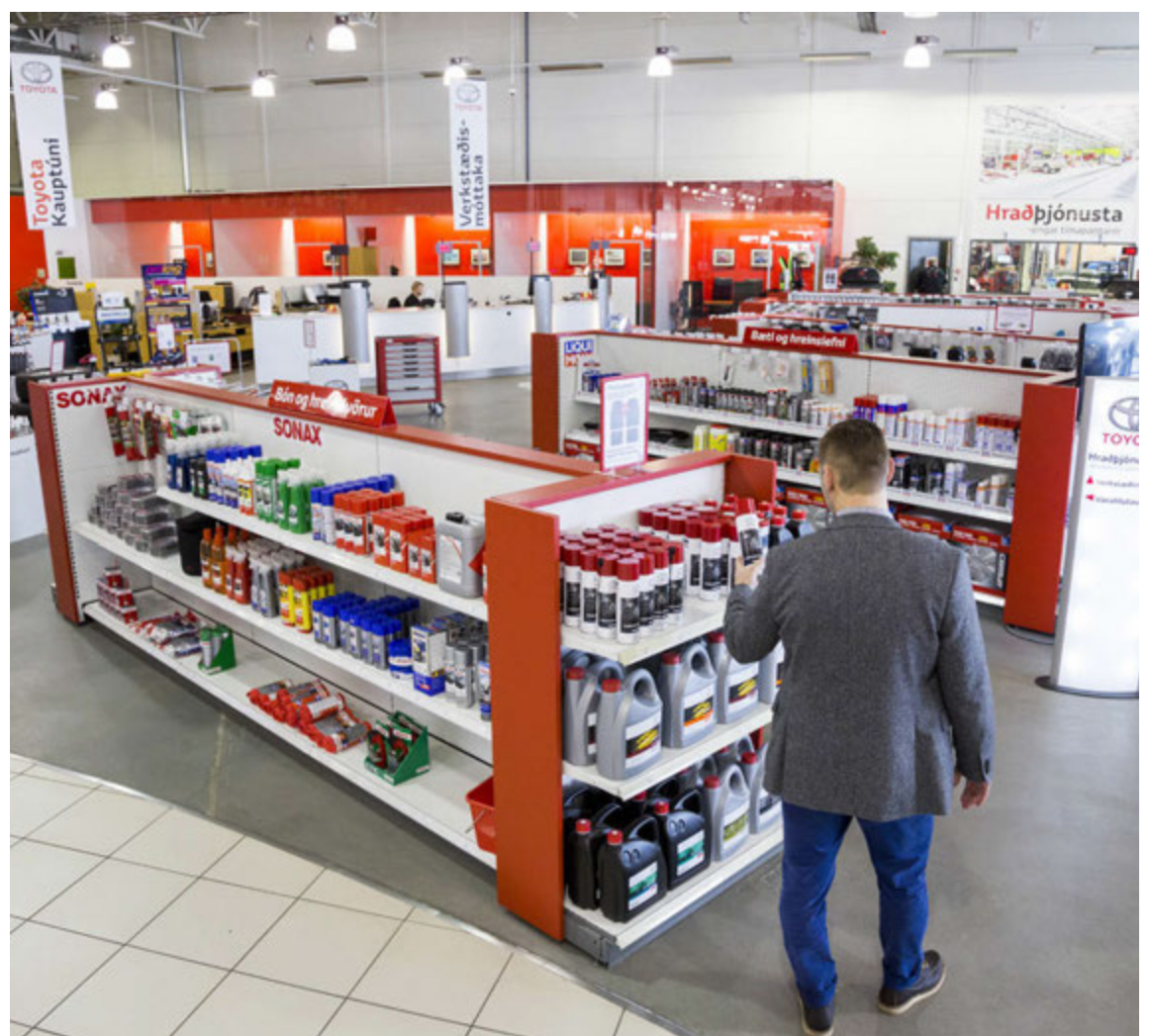
Verslun Toyota býður upp á mikið úrval af vörum á borð við bón, hreinsivörur, hjólkoppa og ýmis verkfæri.

Opnunartími verslunarinnar er frá 7.45-18 á virkum dögum og milli kl. 12 og 16 á laugardögum. Utan hefðbundins opnunartíma má hringja í sérstakt neyðarnúmer, 570 5000, ef þörf er á.