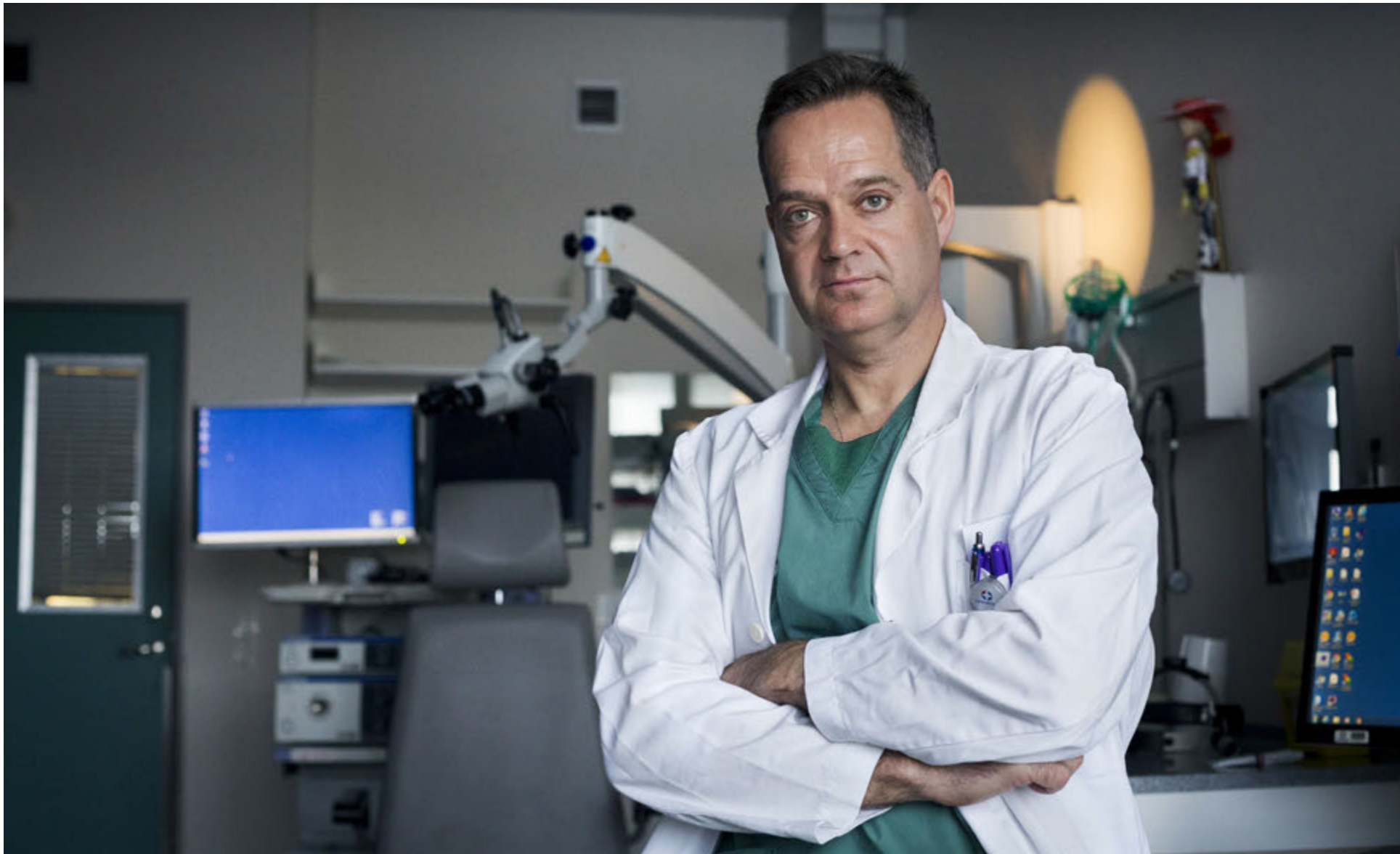
Ef sjúkdómurinn greinist á fyrri stigum er meðferðin einfaldari og horfurnar góðar. Ef hann er hins vegar lengra genginn við greiningu vandast málið.