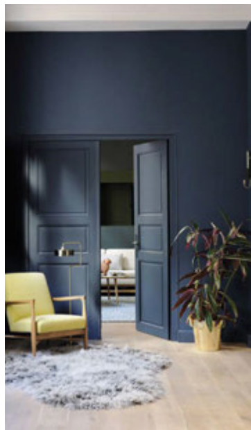
Dökkir litir eru einnig afar vinsælir.

„Lýsing hefur ótrúlega mikið að segja og getur gjörbreytt rýmum. Með því að nota dimmera má stjórna lýsingunni úr því að lýsa upp allt rýmið niður í „kertaljósa-birtu“. Mikilvægt er að hafa góða lýsingu þar sem verið er að vinna en leika sér með áberandi loftljós,