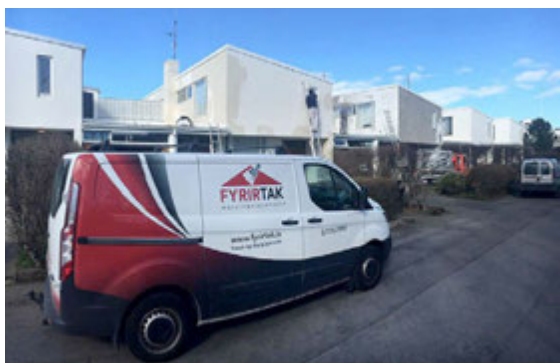
Fyrirtak tekur að sér öll helstu verkefni sem snerta viðhald og breytingar á fasteignum.