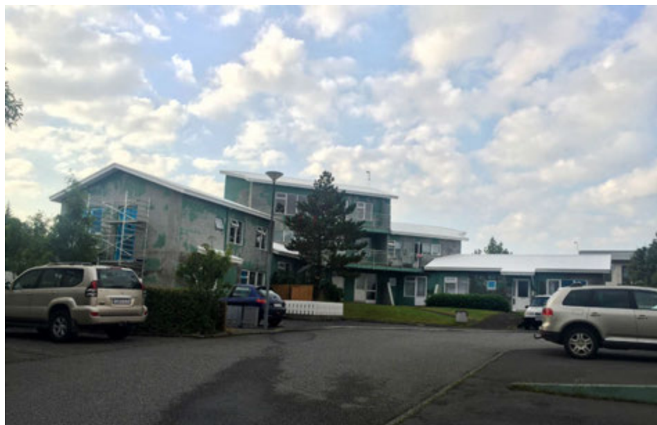
Reglulegt viðhald á fasteignum borgar sig.