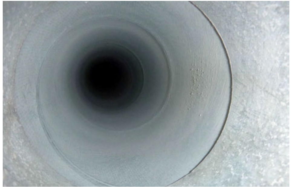
Rör eftir hreinsun.