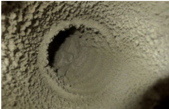
Mjúkur barki fyrir hreinsun.

Hreinsað fyrir hverja íbúð Þegar þörf er á hreinsun mæta starfsmenn K2 á staðinn, fara upp á þak