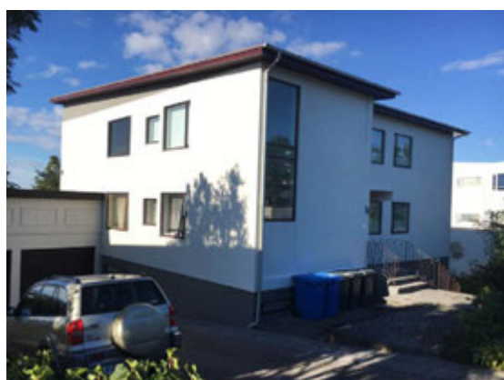
Fallega máluð hús eru sannarlega bæjarprýði.