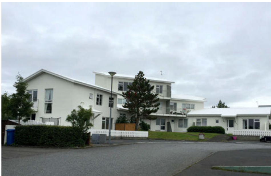
Málning er oftast en ekki eina vörnin fyrir veðri og vindum.

Fyrirtak málningarpjónusta, sími: 770-7997. fyrirtak@fyrirtak.is. www.fyrirtak.is