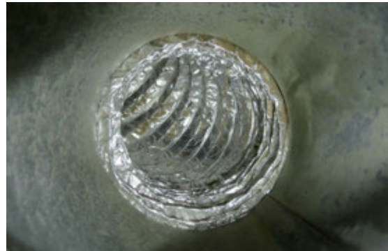
Mjúkur barki eftir hreinsun.