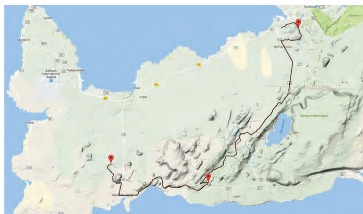
Leiðin sem þátttakendur hjóla frá Hafnarfirði og í Bláa lónið.

Hjólað er eftir skemmtilegum malarvegi fyrir fjallið Þorbjörn og sem leið liggur að Bláa lóninu. Ísólfskálabrekkan er síðasta raunin áður en komið er inn að lóninu en þá hafa keppendur lokið 57 km langri leiðinni sem er um 60% á mól og 40% á malbiki.