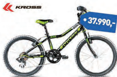
KROSS HEXAGON 20"