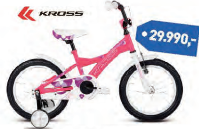
KROSS LILLY 16"