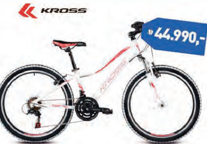
KROSS LEA REPILICA 24"