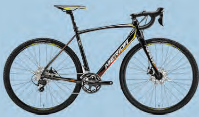
MERIDA CYCLOCROSS 500 VERÐ 219.990.-