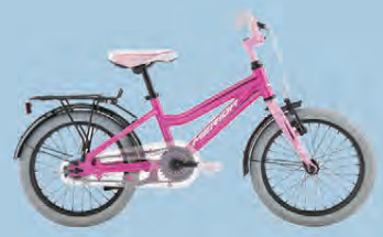
MERIDA BELLA 16 VERÐ 27.990.-