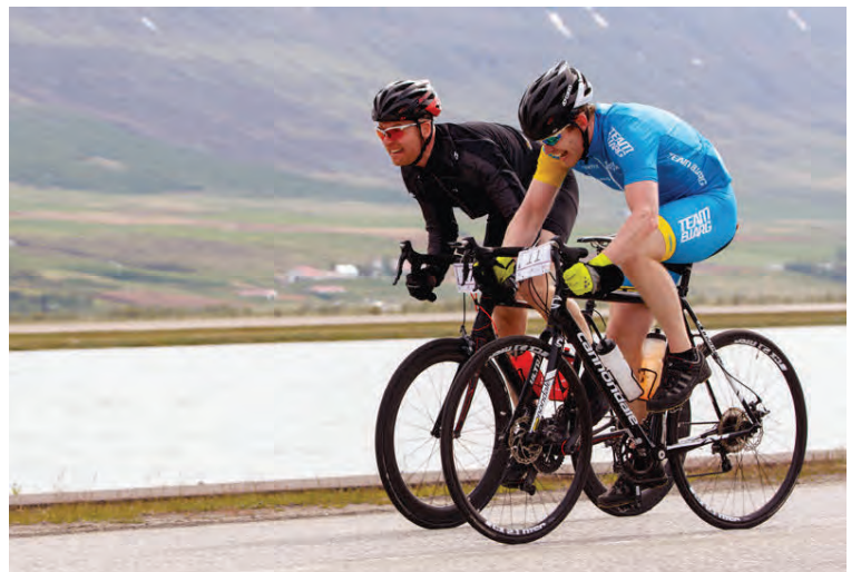
Hjólreiðafélag Akureyrar stendur fyrir Hjólreiðahelginni, helgina fyrir verslunarmannahelgi.