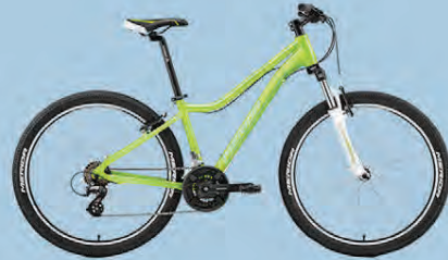
MERIDA JULIET 10 VERÐ 69.990.-