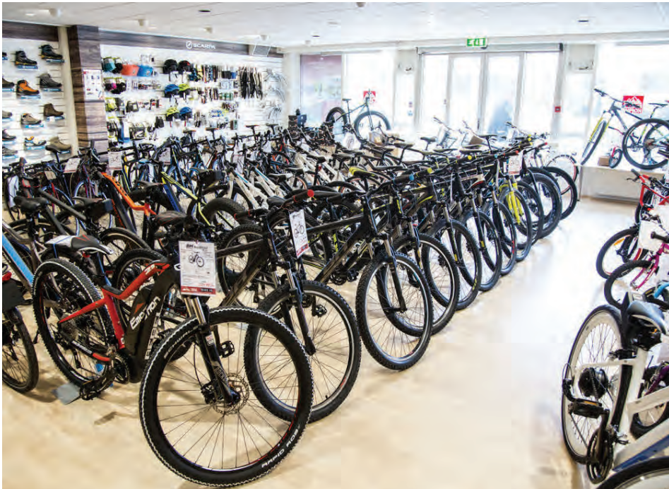
Fjallakofinn er með mikið úrval af hjólum frá BH.