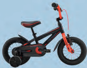
MERIDA DINO 12 VERÐ 24.990.-