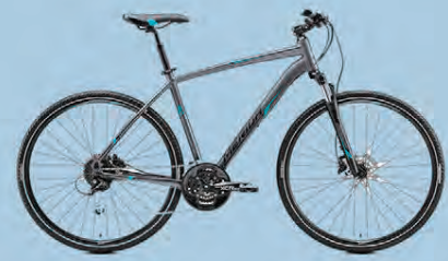
MERIDA CROSSWAY 100 VERÐ 119.990.-