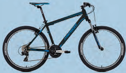
MERIDA MATTS 10 VERÐ 69.990.-