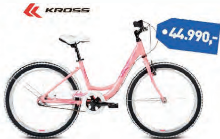
KROSS JULIE 24"