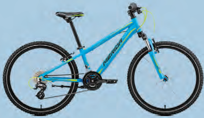
MERIDA MATTS J24 VERÐ 64.990.-