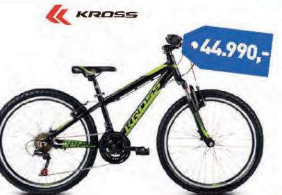
KROSS DUST REPILICA 24"