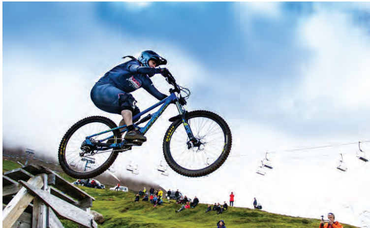
Lifleg hjólreiðamening er á Akureyri.

„Þeir sem selja reiðhjól hér í bæ segja mér að margir séu farnir að kaupa hjól með dempurum bæði að framan og aftan, einmitt af því