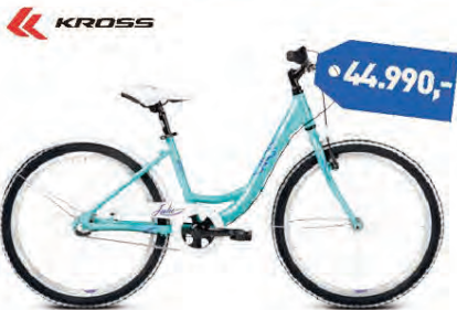
KROSS JULIE 24"