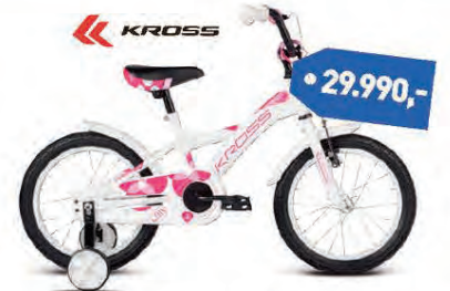
KROSS LYLLY 12"