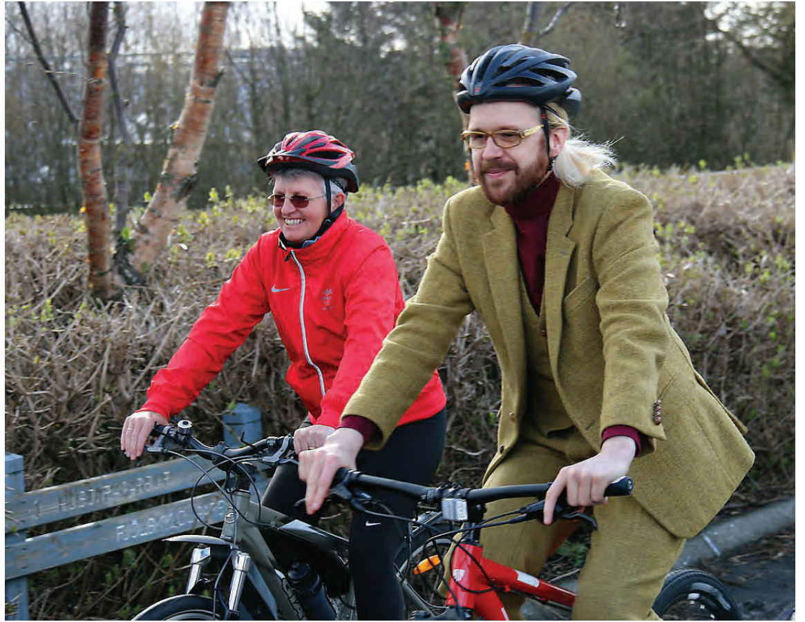
Óttarr Proppé heilbrigðisráðherra setti verkefnið í gang en því er ætlað að vera heilsuhvatning til landsmanna.

Á heimasíðunni í gær var búið að skrá 137.269 km sem verður að teljast góður árangur. Á Facebook-síðu Hjólað í vinnuna má fylgjast með keppendum og skoða myndir af því sem er að gerast. Almenningsíþróttasvið ÍSÍ stendur fyrir Hjólað í vinnuna en átakið er fyrst og fremst heilsu- og hvatningarverkefni.