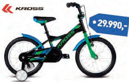
KROSS LEO 16"