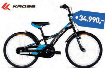
KROSS ELI 20"