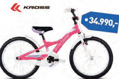
KROSS ELLA 20"