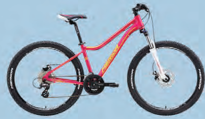
MERIDA JULIET 15 VERÐ 79.990.-