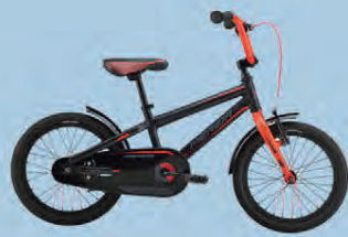
MERIDA DINO 16 VERÐ 27.990.-