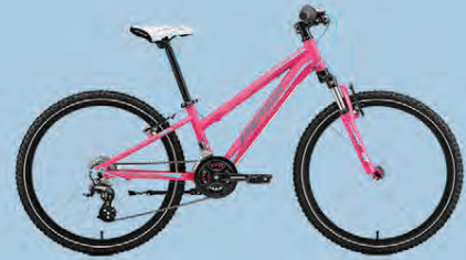
MERIDA MATTS J24 VERÐ 64.990.-