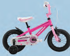
MERIDA BELLA 12 VERÐ 24.990.-