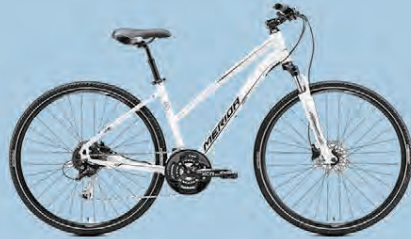
MERIDA CROSSWAY 100 VERÐ 119.990.-