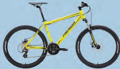
MERIDA MATTS 15 VERÐ 79.990.-