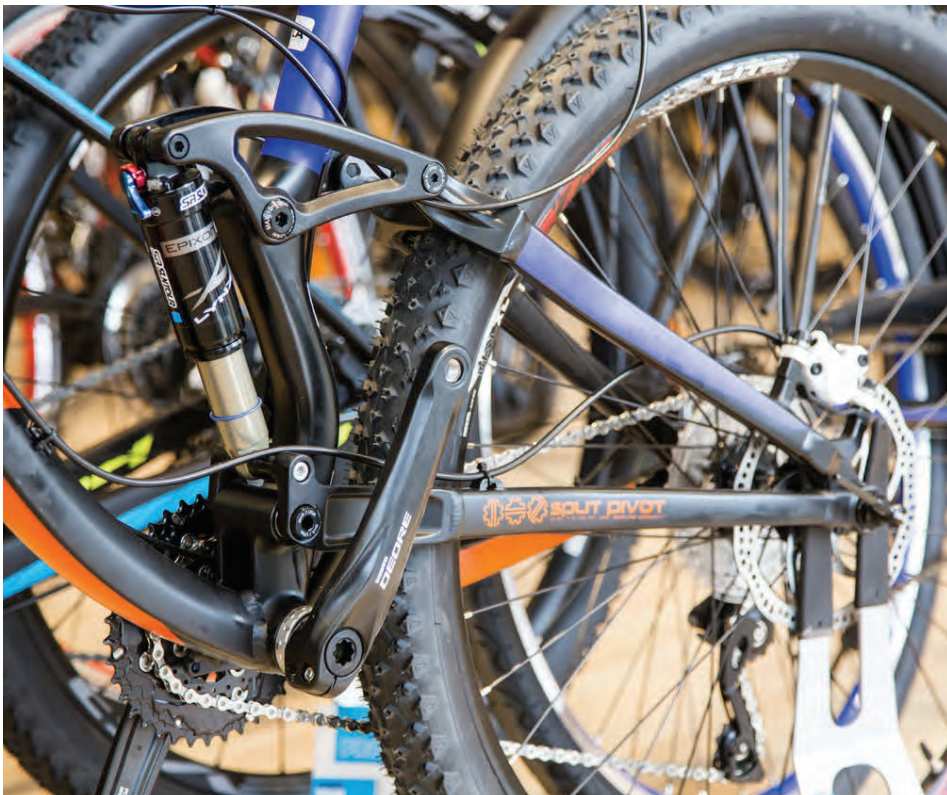
BH leggur mikinn metnað í að nota eingöngu góða íhluti sem endast í hjólin sín.