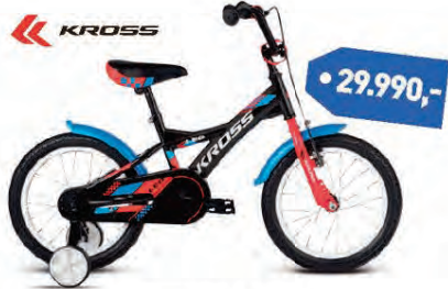
KROSS LEO 16"