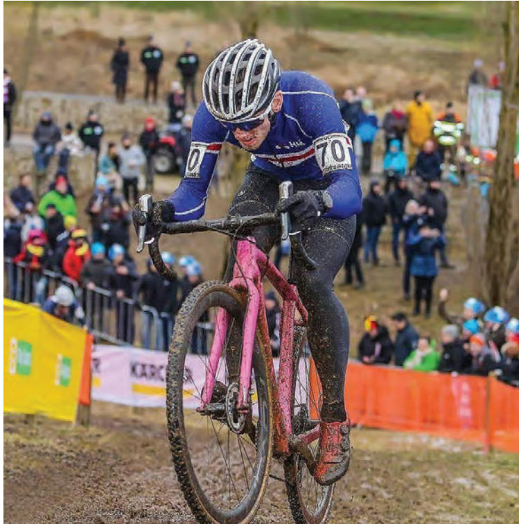
Keppnin á heimsmeistaramóti í Cyclocross var hörð en hún fór fram í Lúxemborg. MYND/RÓBERT STRAUS

Stóra tækifærið kom árið 2014 þegar Ingvari var boðið til Bandaríkjanna til að taka þátt í fjallahjólakeppni sem var hluti af einni af stærstu reiðhjólasyningum í heiminum, Sea Otter Classic. „Sú