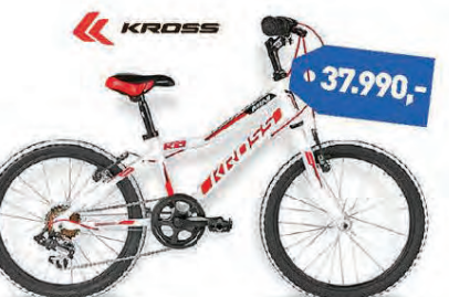
KROSS HEXAGON 20"