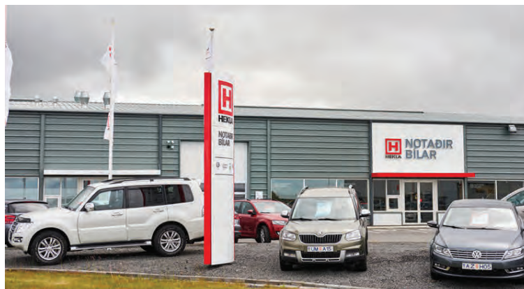
Utan þess að hafa einn stærsta sýningarsal landsins býður Hekla Notuðir bílar líka upp á afar rúmt útisvæði í kringum húsið sem hýsir allt að 180 bíla.

ekki gleyma Audi Q7 e-tron sem keyrir á dísil og rafmagn. Einnig höfum við verið með gott úrval af metanbílum sem ganga flestir fyrir metani og bensíni en þar má