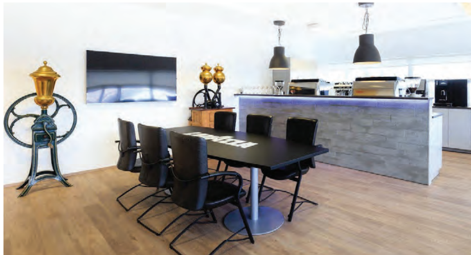
Danól tók í gagnið nýjan og glæsilegan sýningarsal að Tunguhálssi 19 á vordögum.