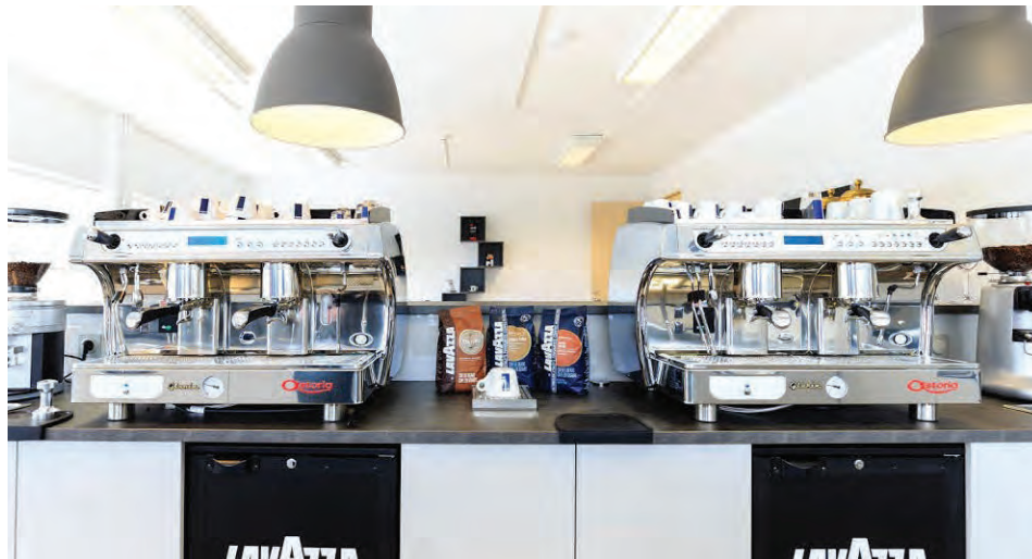
Gestir geta komið og gætt sér á ólíkum kaffidrykkjum.