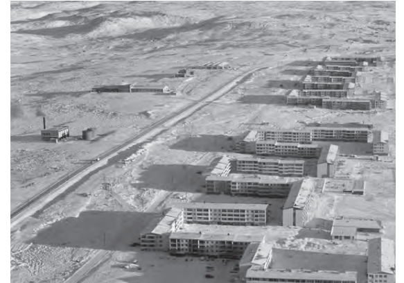
Það var lítil byggð í Hálsahverfinu árið 1968 sem sést hér til vinstri á myndinni.

Þar fyrir ofan er Tunguháls 2, húsnæði sem í dag hýsir Þvottahús spítalanna.