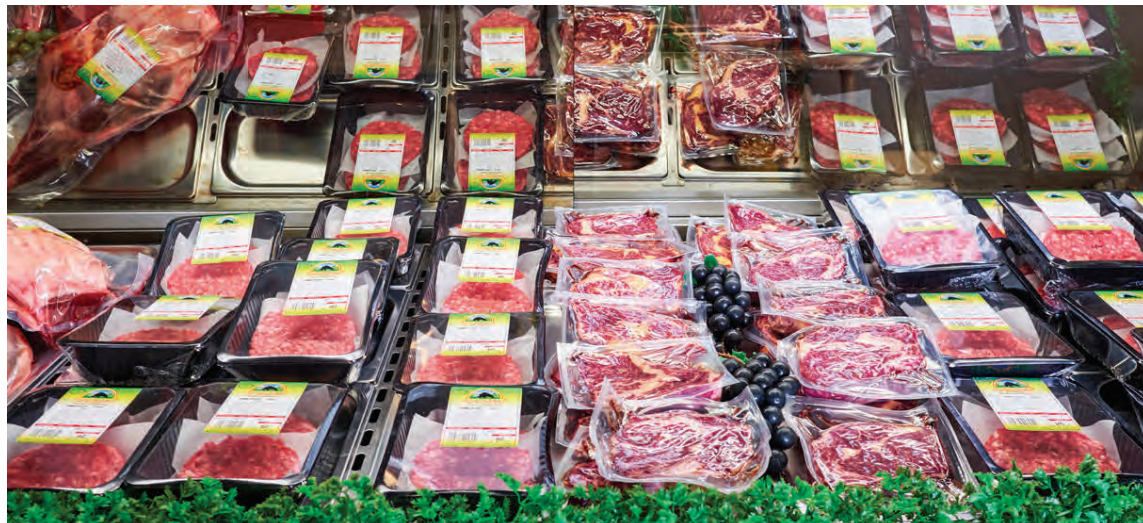
Kjötborðið í kjörbúð Kjötsmiðjunnar er stútfullt af gírnilegum hágæðavörum.