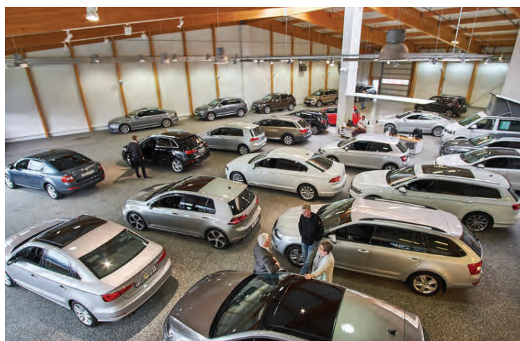
Stór og rúmgóður sýningarsalurinn hýsir fjölda bifreiða við allra hæfi.