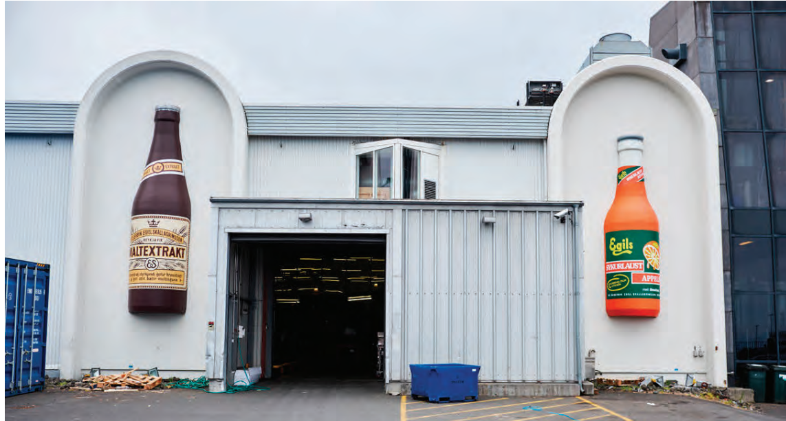
Flöskurnar og dósirnar eru steiptar úr trefjaplasi í bátasmiðju og síðan málaðar.

Flöskurnar og dósirnar eru steiptar úr trefjaplasi í bátasmiðju og síðan málaðar. „Húsið er byggt á árunum 1979 til 1980 og starfsemin var flutt inn í húsið á árunum 1982 til 1985 frá miðborg Reykjavíkur. Á þessum árum var