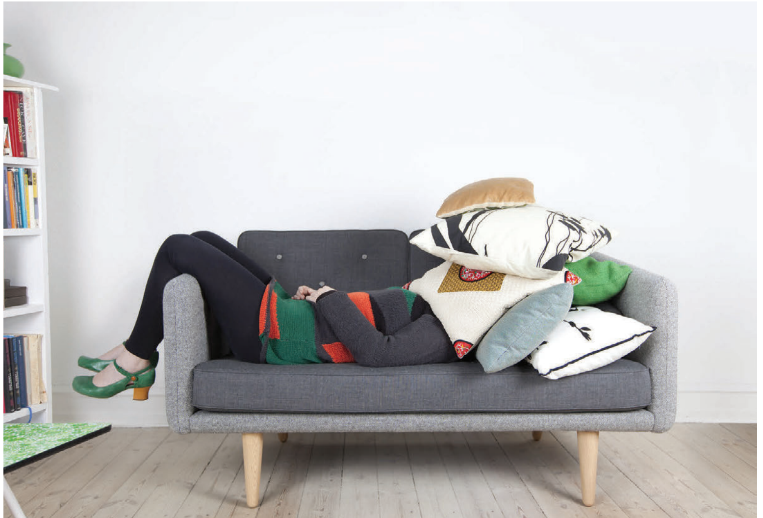
Kulnun í starfi getur haft alvarlegar afleiðingar.

Kulnun í starfi getur verið gríðarlega alvarleg og leitt af sér langvarandi vandamál fyrir bæði starfsmann og vinnustað. „Samfélagið þarf að átta sig á að vinnustaðurinn ber ábyrgð á andlegri og líkamlegri heilsu starfsmanna sinna. Við hjá Vinnueftirlitinu reynum því að einblína á fyrirbyggjandi aðgerðir og þá helst hvað vinnustaðurinn getur gert til að bæta vinnuumhverfi starfsmanna. Hægt er að nálgast vinnuumhverfisvísa á heimasíðunni okkar vinnueftirlit.is sem gagnast við gerð áhættumats fyrir andlegt og félagslegt vinnuumhverfi. Tryggja þarf heilsusamlegt vinnuumhverfi og innleiða áætlun um að draga úr streitu og meta síðan árangurinn. Starfsmenn, stjórnendur og allir sem að vinnustaðnum koma þurfa að vera meðvitáðir um að markmiðið sé að draga úr álagi og streitu. Þetta er í grunninn