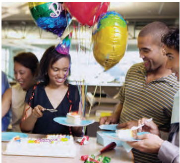
Föstudagskaffið á vinnustaðnum verður enn skemmtilegra með örlitilli viðhöfn.

Setjið volga mjólk í hrærivélarskál og út í hana teskeið sykurs og gerið. Vigið þurrefnið og bræðið smjórið. Bætið út í þegar gerið er byrjað að freyða í skálinni. Hnoðið deigið og látið lyfta sér í 40-60 mínútur. Fletjið út, penslið með bræddu smjóri og stráðið vel af kanilsykri yfir. Rúllið upp deiginu, skerið í sneiðar og bakið á plötu við 200°C í um 10 mínútur.