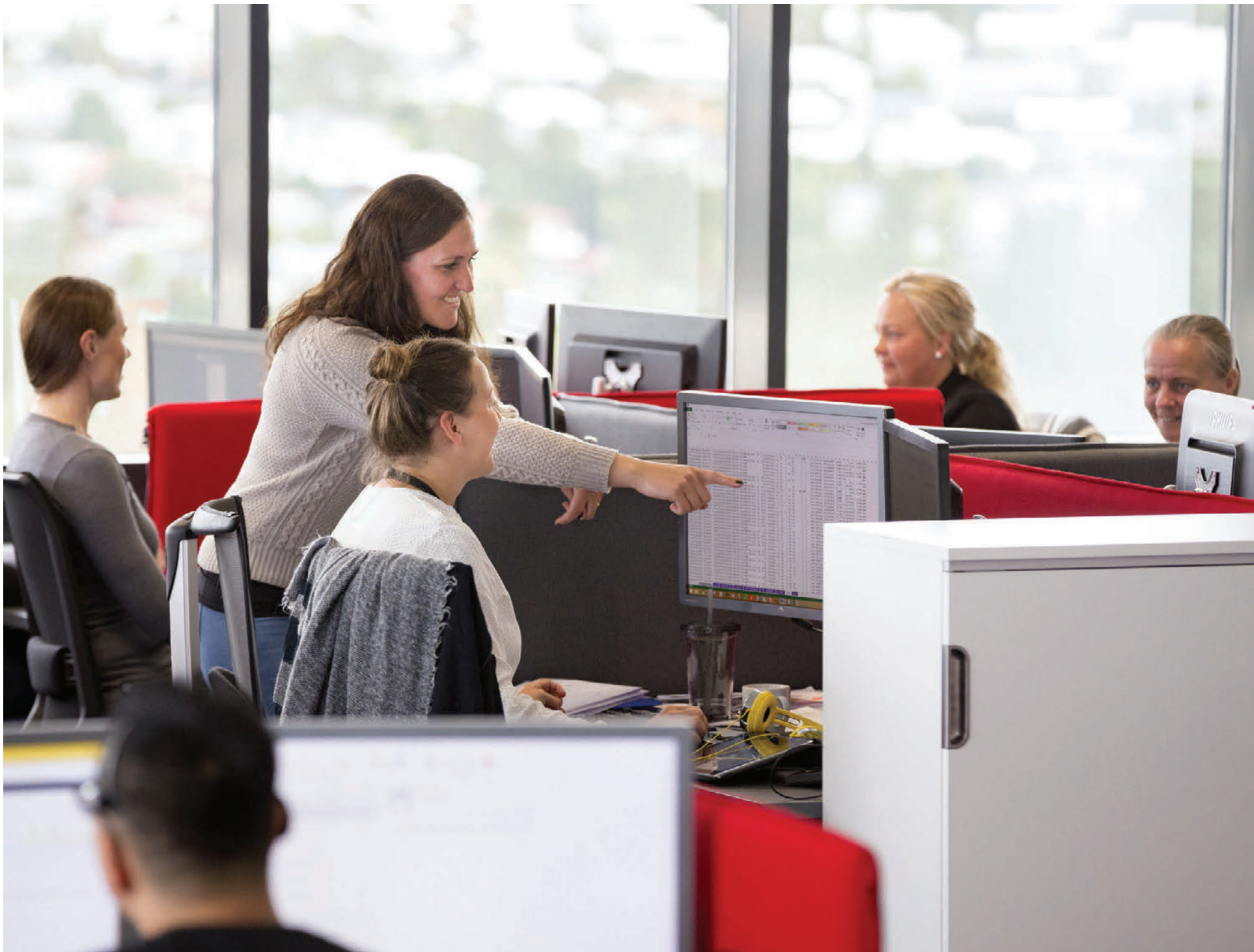
Starfsemi dk hefur farið ört vaxandi undanfarin ár og nú vinna 58 starfsmenn hjá fyrirtækinu, allt sérfræðingar á sinu sviði. Í Reykjavík starfa 52 og sex á Akureyri.