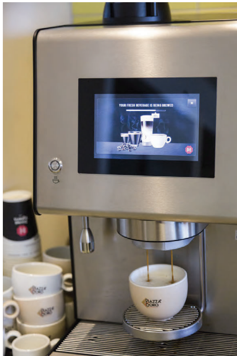
Promesso kaffivélin er fallega hönnuð og sómir sér vel á öllum vinnustöðum.