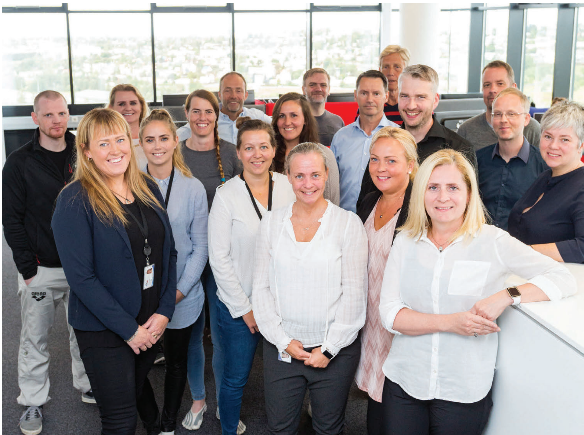
dk er nú flutt í nýtt og glæsilegt húsnæði við Smáratorg 3 (Deloitte-turninn), á 15. hæð. Fyrirtækið er einnig með starfsstöð á Akureyri.

Kynningar: dk hugbúnaður, Pricewaterhouse Coopers, Fakta