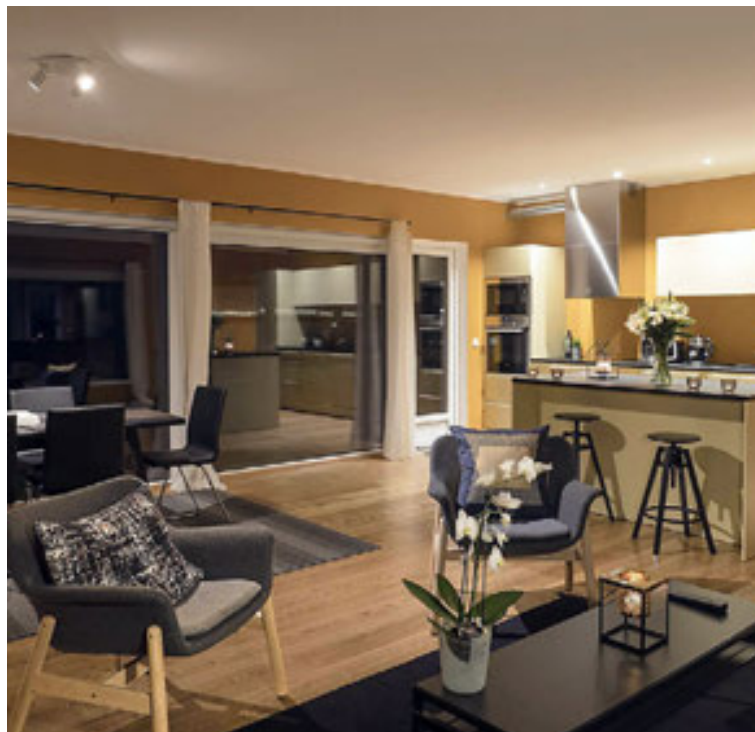
Einingahúsin eru björt og falleg að innan.