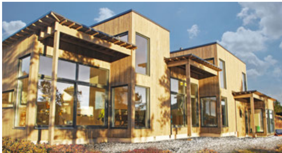
Fjölbreyttar og skemmtilegar útfærslur eru í boði.

Frekari upplýsingar um Seve einingahúsin, stálgrindarhús, krosslímd einingahús frá Húsasmiðjunni, svalalokanir og fleira tengt húsasmiði má fá hjá fagsviði í Kjalarvogi þar sem veitt er fagleg og persónuleg þjónusta. Einnig er hægt að nálgast upplýsingar á www.husa.is og hjá Ingvari Skúlasi sýni í síma 660-3087.