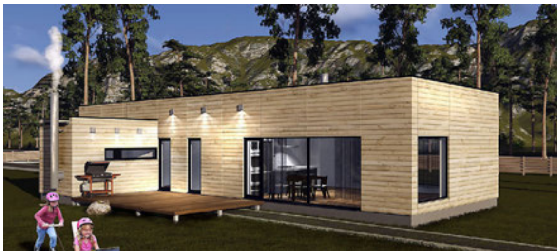
OTTO húsin eru 145 fermetrar. Þau kosta 18,6 milljónir án uppsetningar.