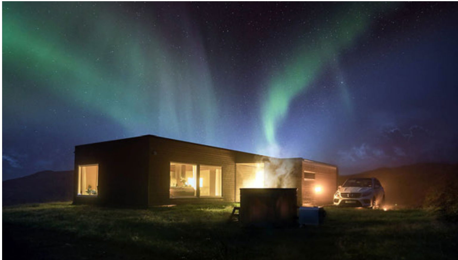
Húsasmiðjan býður upp á gott úrval tómstundahúsa og einbýlishúsa. Þetta hús stendur í Hrífunes Natural Park á Suðurlandi.

Hægt er að velja um margvíslegar utanhússklæðningar hjá Húsasmiðjunni.