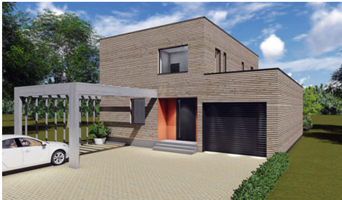
Hægt er að kaupa tengihús og raðhús í mörgum stærðum og útfærslum.