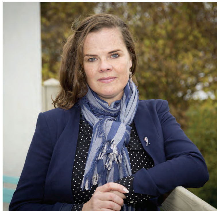
Hingað til hafa úrræði fyrir unga aðstandendur verið takmörkuð. Ungmennanámskeið Ráðgjafarþjónustunnar er liður í að bæta úr því.

Allar nánari upplýsingar um næstu námskeið er að finna á krabb.is