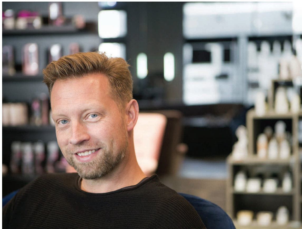
Baldur og félagar í bpro leggja mikinn metnað í söfnun sína fyrir Krabbameinsfélagið.

bpro vill auk þess styðja við fagið að öllu leyti. „Við viljum byggja undir fagið með kynningum,