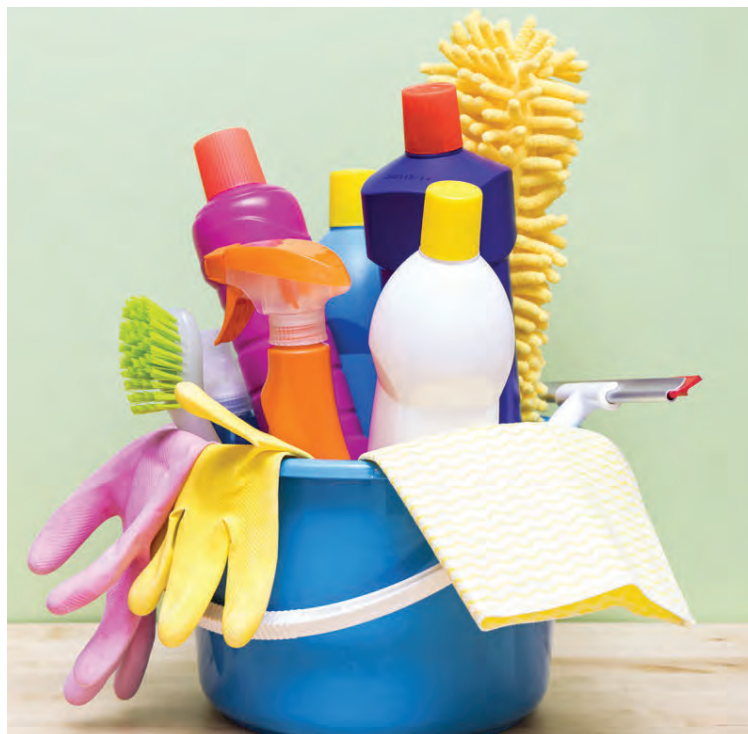
Með því að þrifa jafnt og þétt verður það síður óyfistiganlegt.