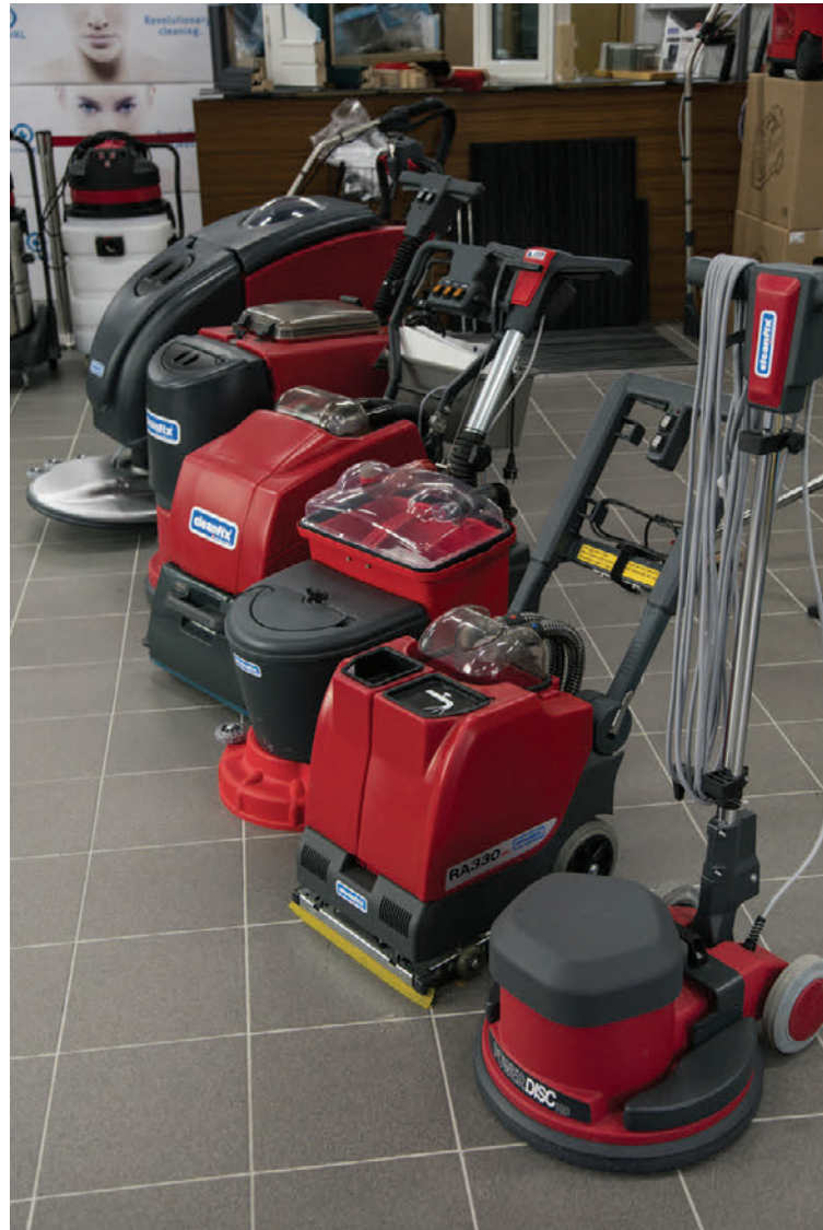
Buska selur einnig hefðbundnar gólfþvottavélar frá Cleanfix í Sviss sem eru miklar gæðavélar sem hafa sannað sig vel undanfarin ár.

aðstæður sem þau þekkja til. „Oft þegar við komum á staðinn og gólfín eru nýpvegin þá nær i-mop upp úr gólfínu ótrúlegum óhreinindum. Þessi vél er algert undratæki.“