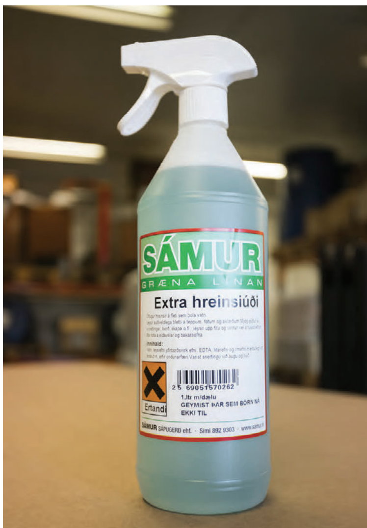
Extra hreinsiúði er alhlíða hreinsiefni sem dugur á öll möguleg heimilisþrif.

„Stálflétirnir er fljótir að útbíast í fingraförum þegar barnabörnin koma í heimsókn en með blautri tusku og Extra hreinsiúða hverfur allt kám á augabragði og tækin líta út eins og ný á eftir. Extra hreinsi-