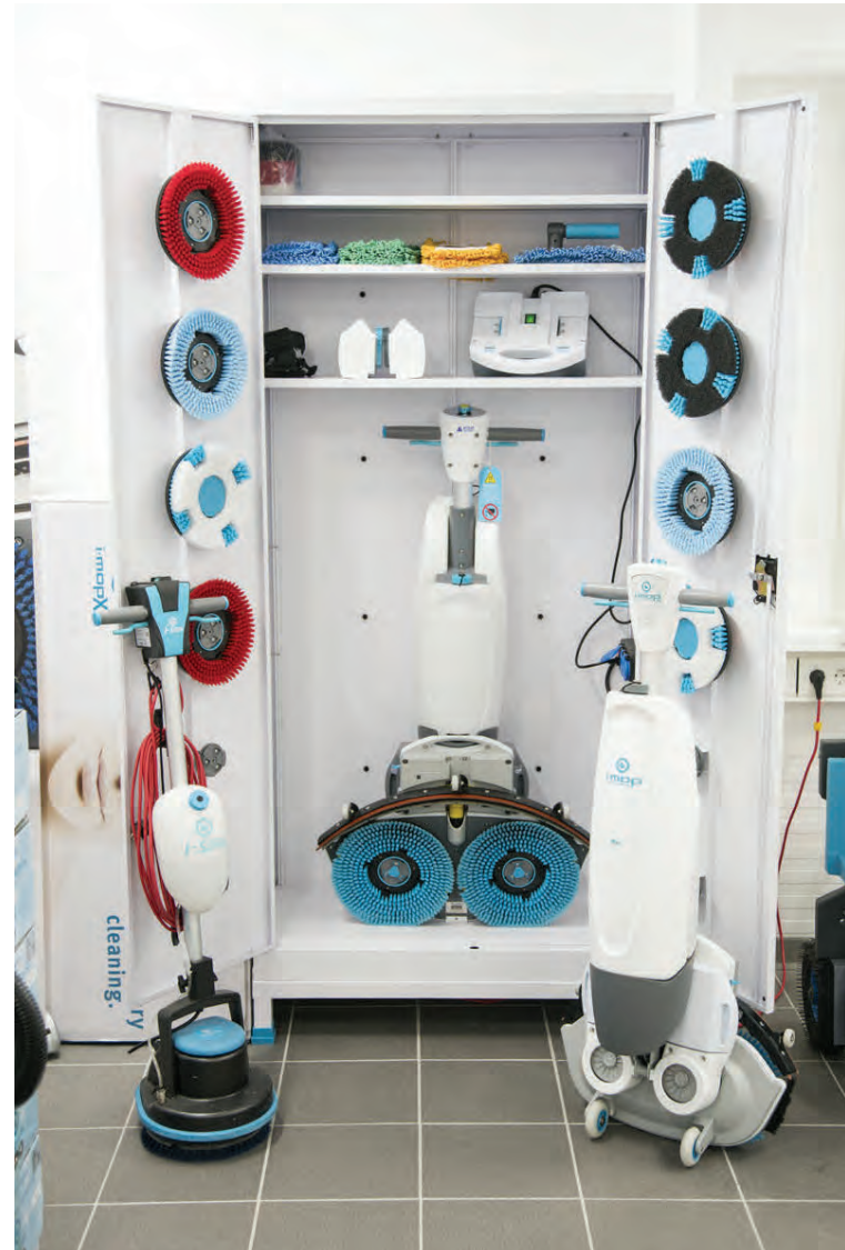
Vörum frá i-team er hægt að koma haganlega fyrir í þar til gerðum skápum sem viðskiptavinir geta keypt hjá Buska undir vélar sínar.

Starfsmenn Busku ehf. bjóðast til þess að koma í heimsókn til fyrirtækja og kynna i-mop og leyfa áhugasömum að prófa vélinu á eigin gólfi við