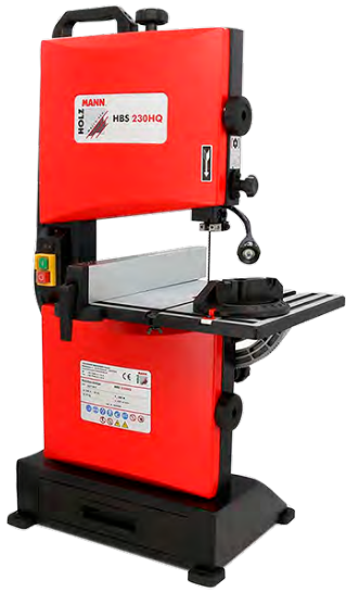
Bandsög HBS230HQ 63.763 kr.