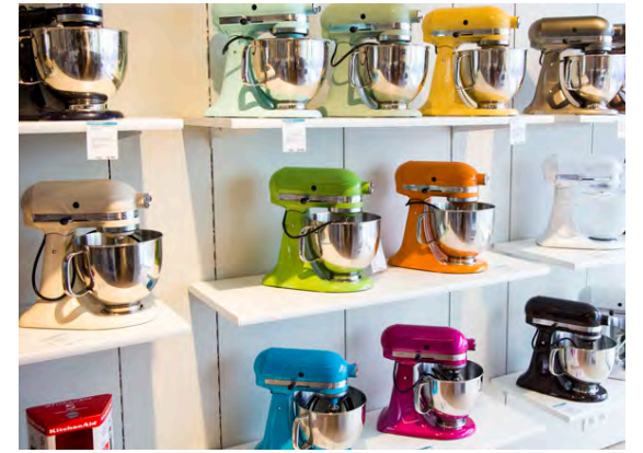
Heimilistæki eru vinsæl til jólagjafa í Danmörku.

Rannsóknin sýndi einnig að Danir eyða að meðaltali um 21 prósent af ráðstöfunartekjum heimilisins í jólagjafir. Árið 2014 var sú tala 13 prósent.