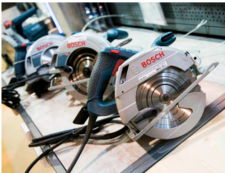
BYKO jók úrvalið af fagmannaverkfærum frá Bosch.