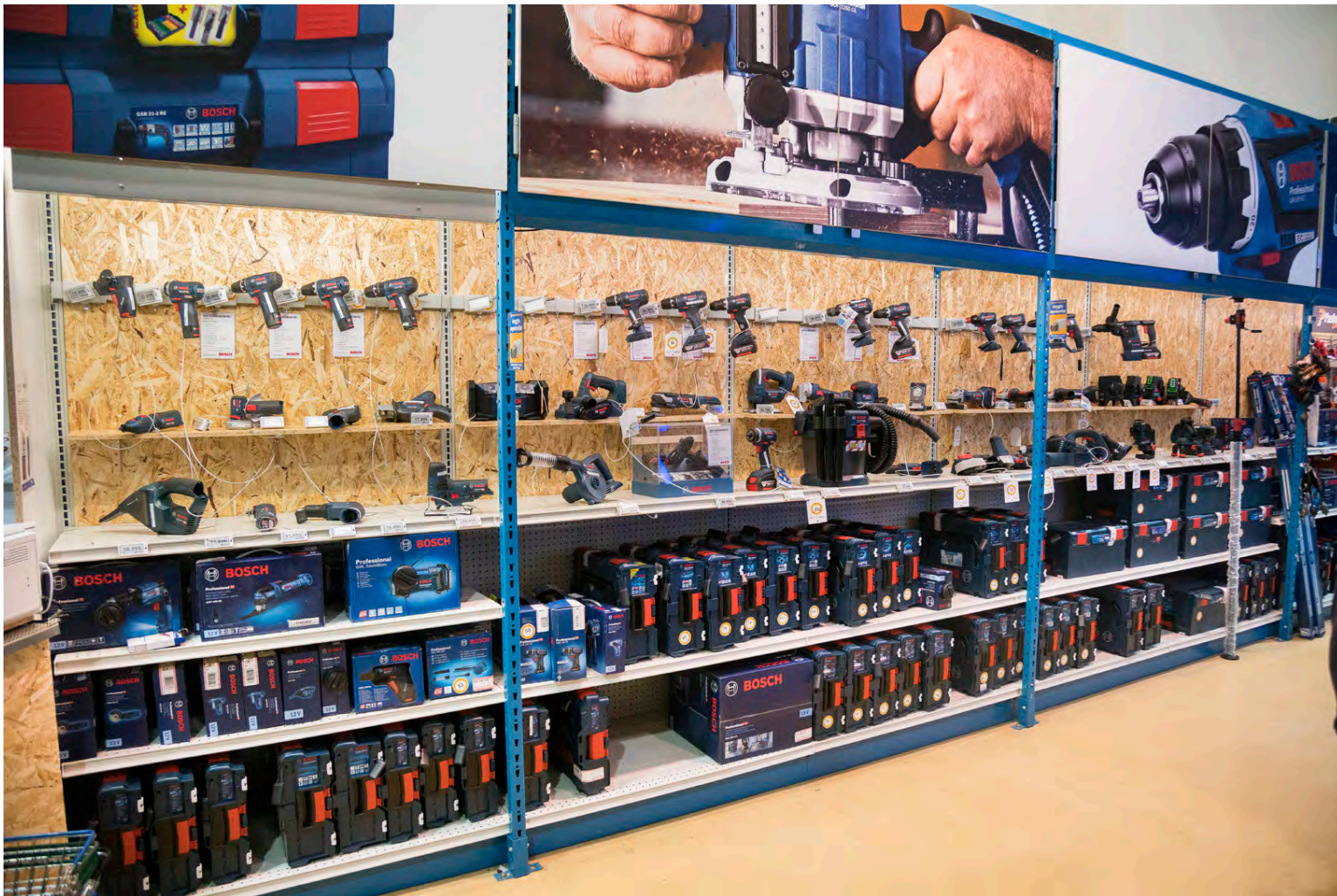
BYKO selur allar gerðir verkfæra.

Svo eru líka komin leysigeisla-tæki sem mæla fjarlægðir og eru í rauninni bara stafrænt málband,“ segir Kristinn. „Þau geta mælt allt frá nokkrum sentimetrum upp í nokkur hundruð metra og allt með millimetránákvæmni. Þetta verður sífellt flottara, aðgengi-legra og áreiðanlegra.“