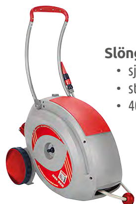
Slönguhjól WSR40M - vatn • sjálfvirk innhölun með pedala • stýring fyrir upprúllun • 40+2 m gúmmí slanga, Ø 12 mm 19.900 kr.