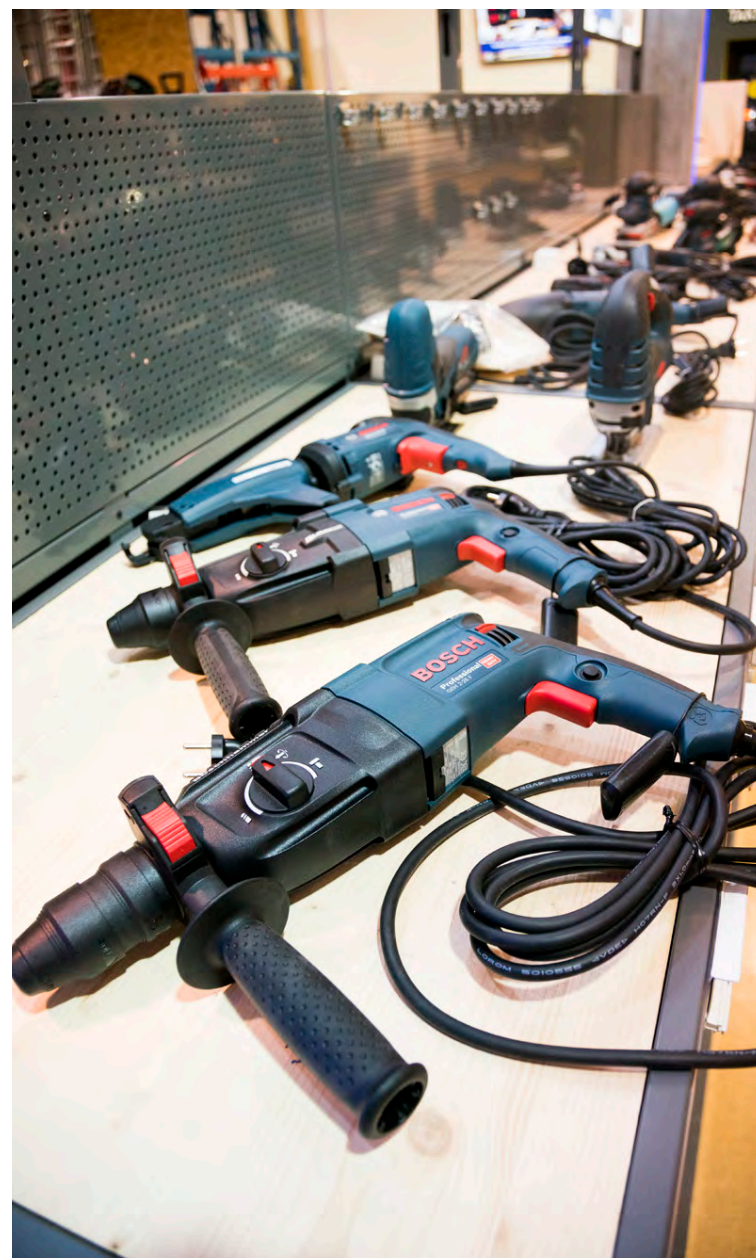
Verkfæraeildinni hjá BYKO hefur verið breytt mikið.