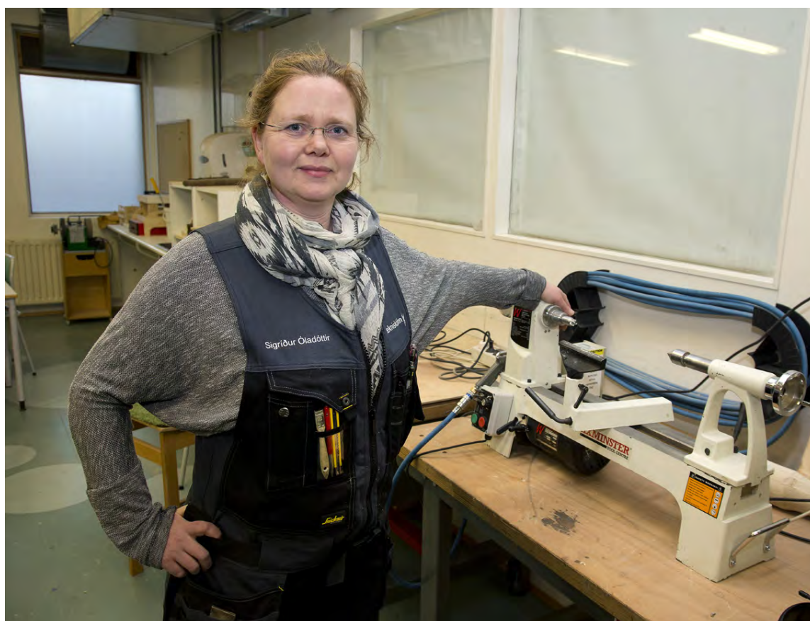
Draumajólagjöfin er rennibekkur og járn.