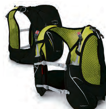
Duro Hlaupavesti 16.990 kr.