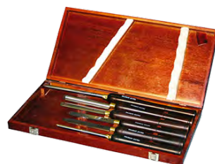
Rennijárn H6TLG 25.196 kr.