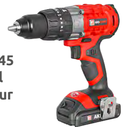
Holzmann AKS45 hleðsluborvél 18V - 2 rafhlöður 27.268 kr.