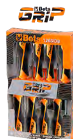
Beta Grip Skrúfjárnasett 8 stk. (+ -) 6.980 kr.