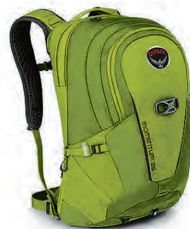
Momentum 26L Hjólabakpoki m/fartölvuhólfi 19.990 kr.