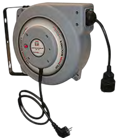
Rafmagnskefli EKR15M með veggfestingu 14.872 kr.