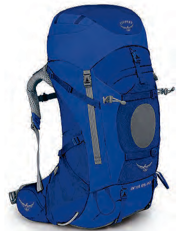
Ariel 65L Burðarbakpoki 41.990 kr.