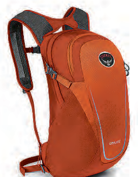
Daylite Alhliða bakpoki 8.990 kr.