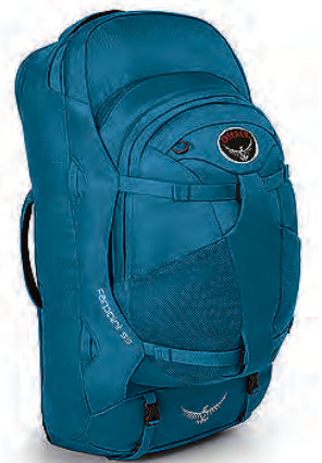
Farpoint 55L Heimsreisubakpoki 26.990 kr.