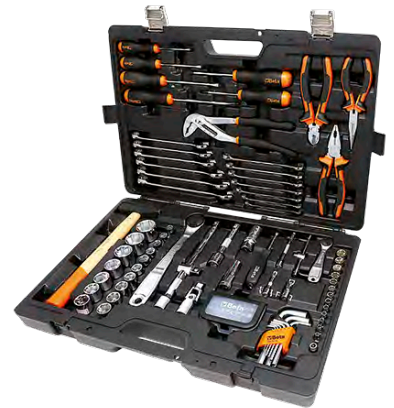
Verkfæra- og topplyklasett 108 hlutir 39.000 kr.