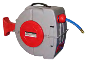
Slönguhjól LSR10M - þrýstiloft með veggveiflu 11.100 kr.