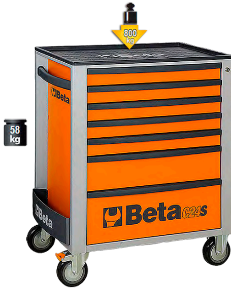
Verkfæraskápur með 127 Beta verkfærum • Verkfæraskápur C24S • 127 vönduð verkfæri • 7 skúffur með mottum og samlæsingum • Burðarþol 800 kg. 159.800 kr.