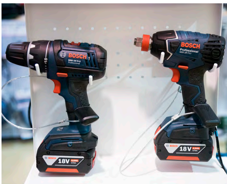
Verkfæri með 18 volta rafhlöðu frá Bosch.