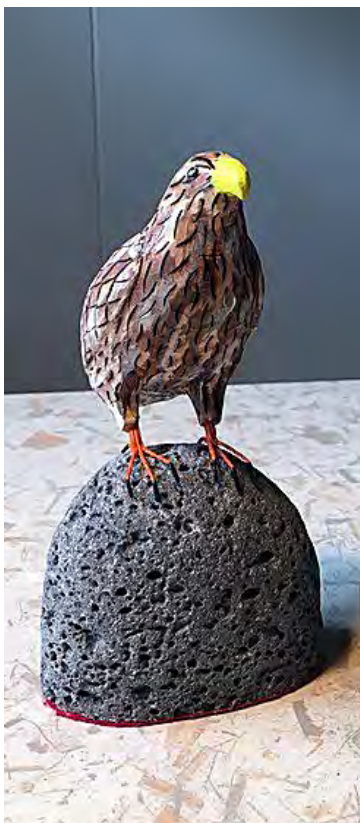
Til vinstri er haförn. Á efri myndum sjást lóan og spóinn saman á mynd og svo fálkinn. Í neðri röð eru rjúpur í vetrar- og sumarþúningi og loks þrjár himbrimar.