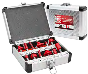
Holzmann hand- fræsitanasett 12 hlutir 5.920 kr.