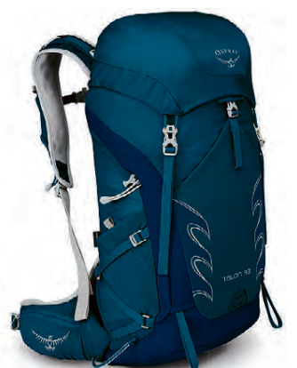
Talon 33L Léttur göngubakpoki 20.990 kr.