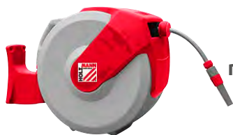
Slönguhjól WSR20M - vatn með veggveiflu 14.723 kr.